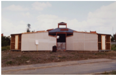
Vue générale IVR31_20055907199NUC