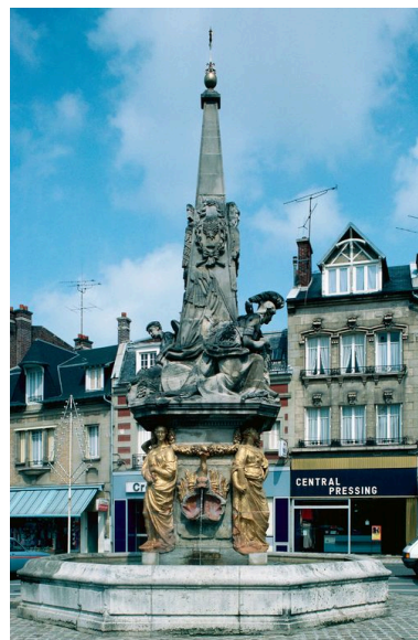
Vue rapprochée. IVR22_19856000654ZA