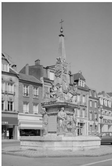
Vue éloignée. IVR22_19856001258X