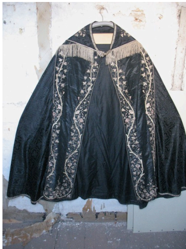
Vue générale : devant IVR31_20106204113NUCA