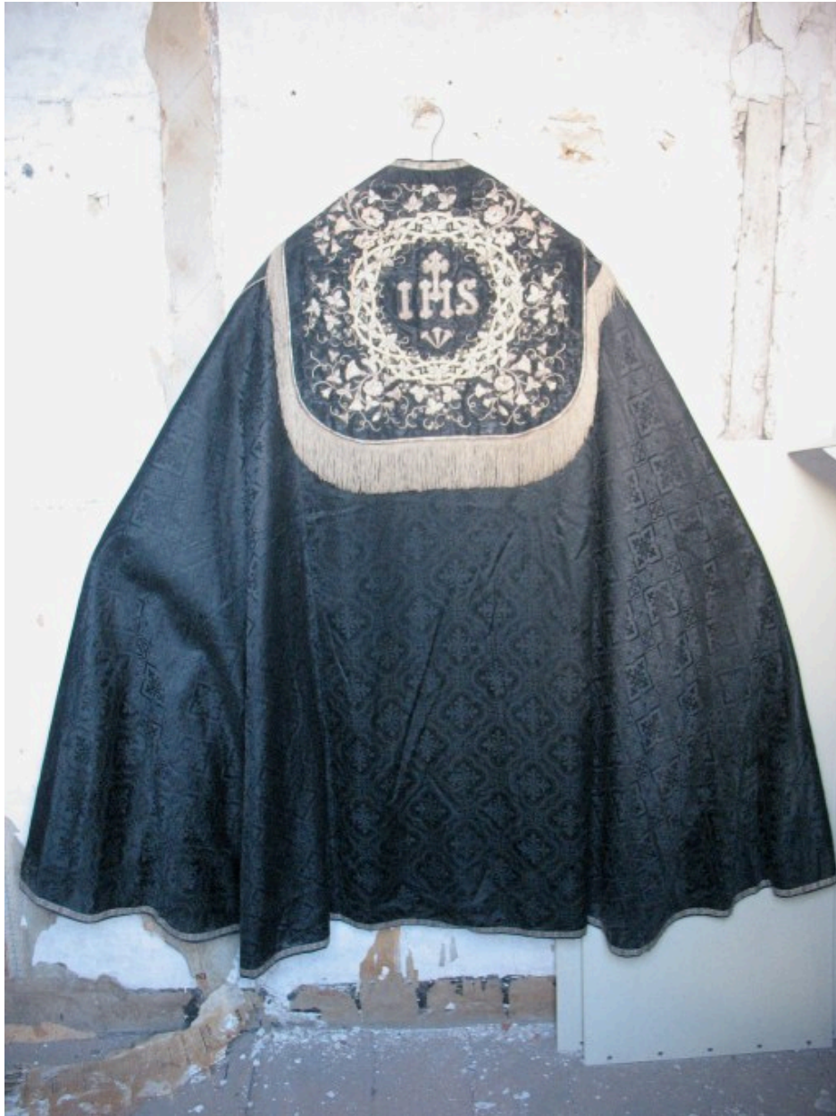
Vue générale : dos