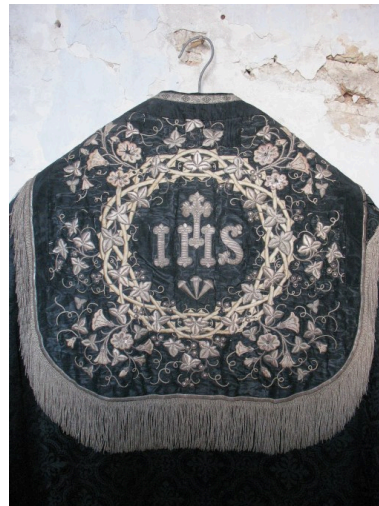
Vue de détail : chaperon IVR31_20106204116NUCA