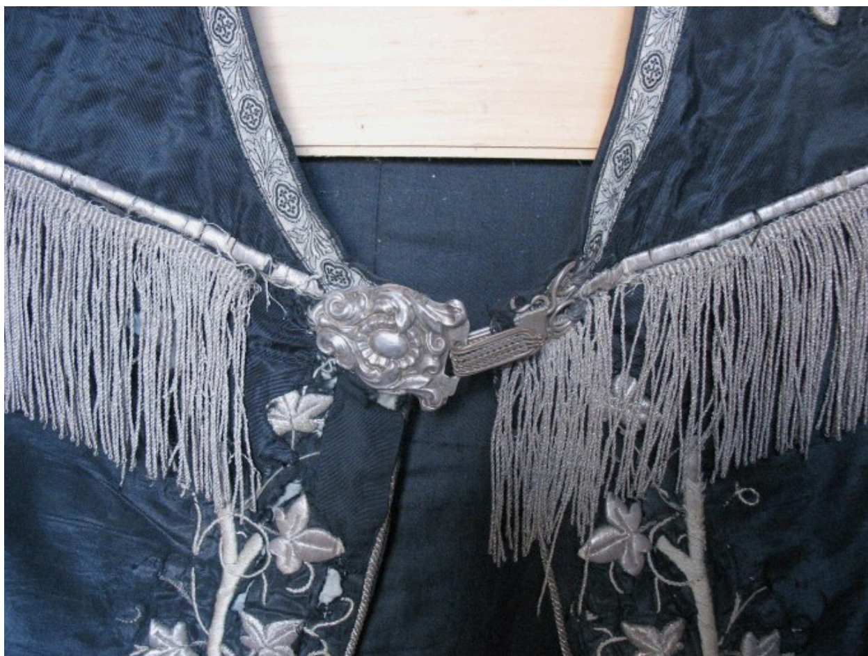
Vue de détail : fermail