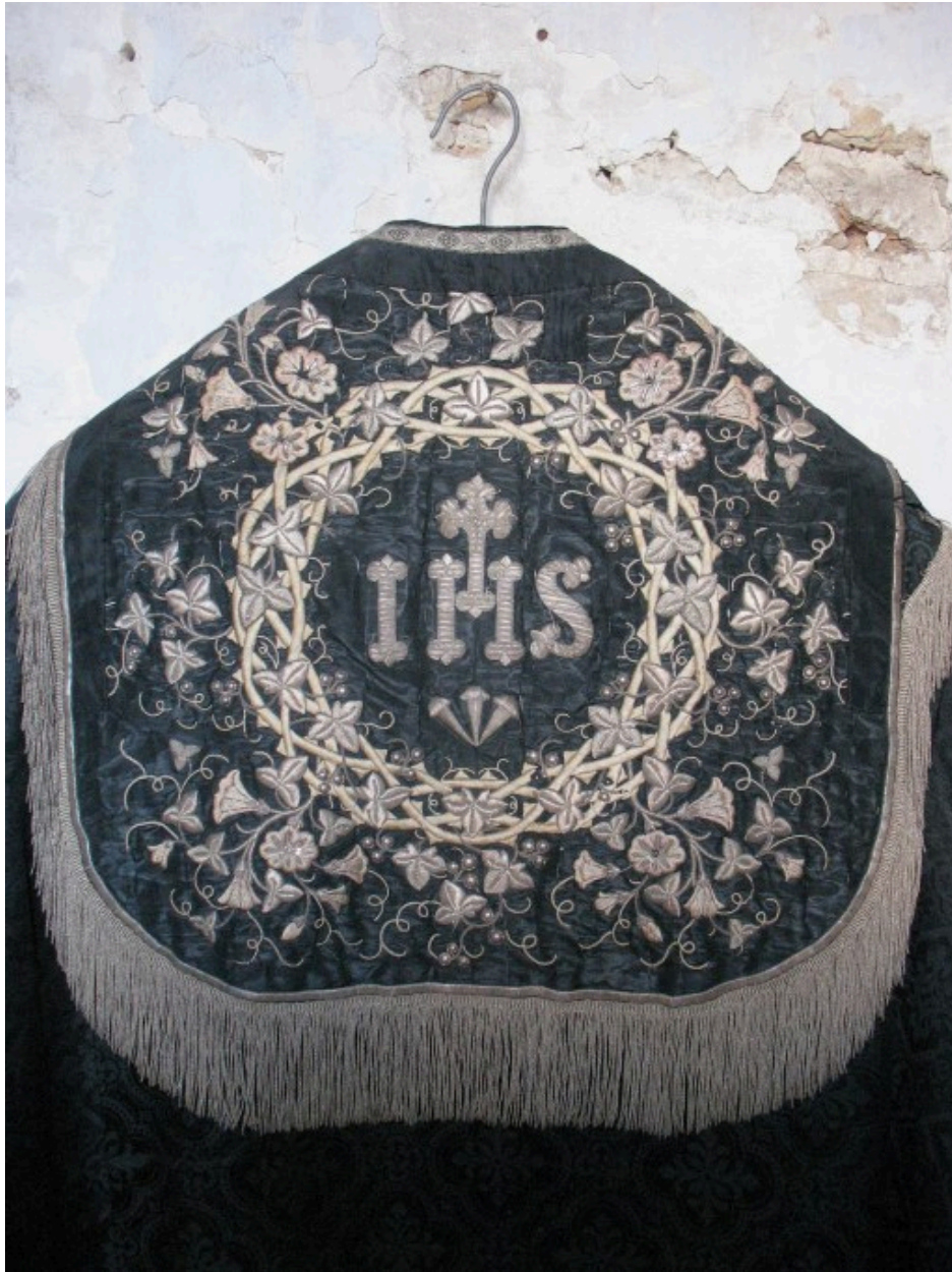
Vue de détail : chaperon