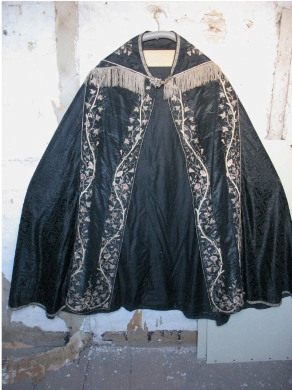
Vue générale : devant