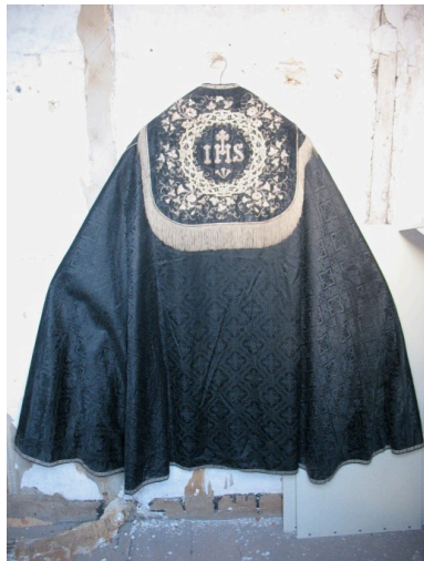
Vue générale : dos IVR31_20106204114NUCA