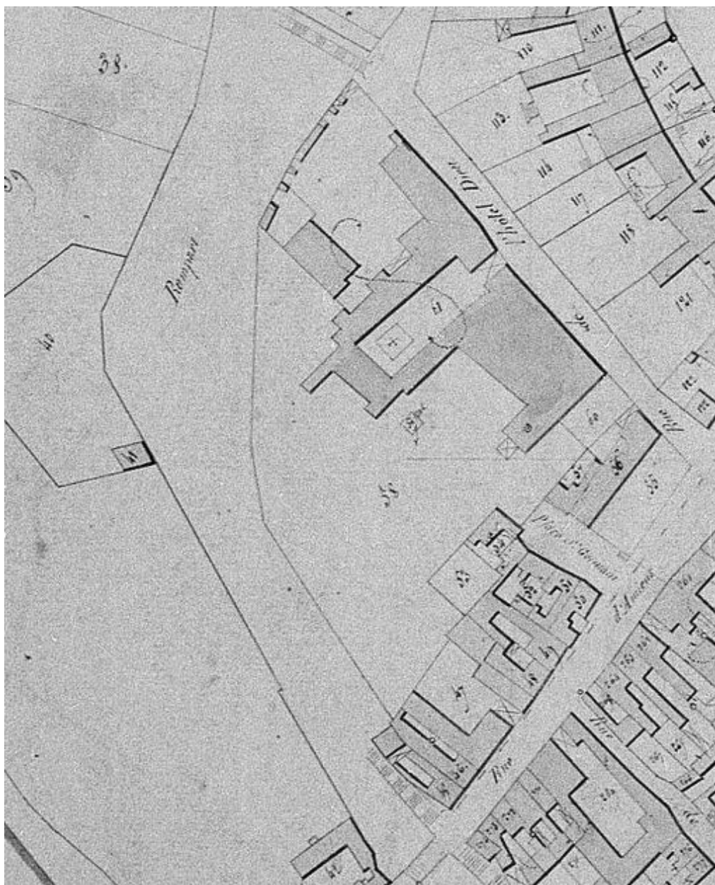
Extrait du cadastre napoléonien (DGI).