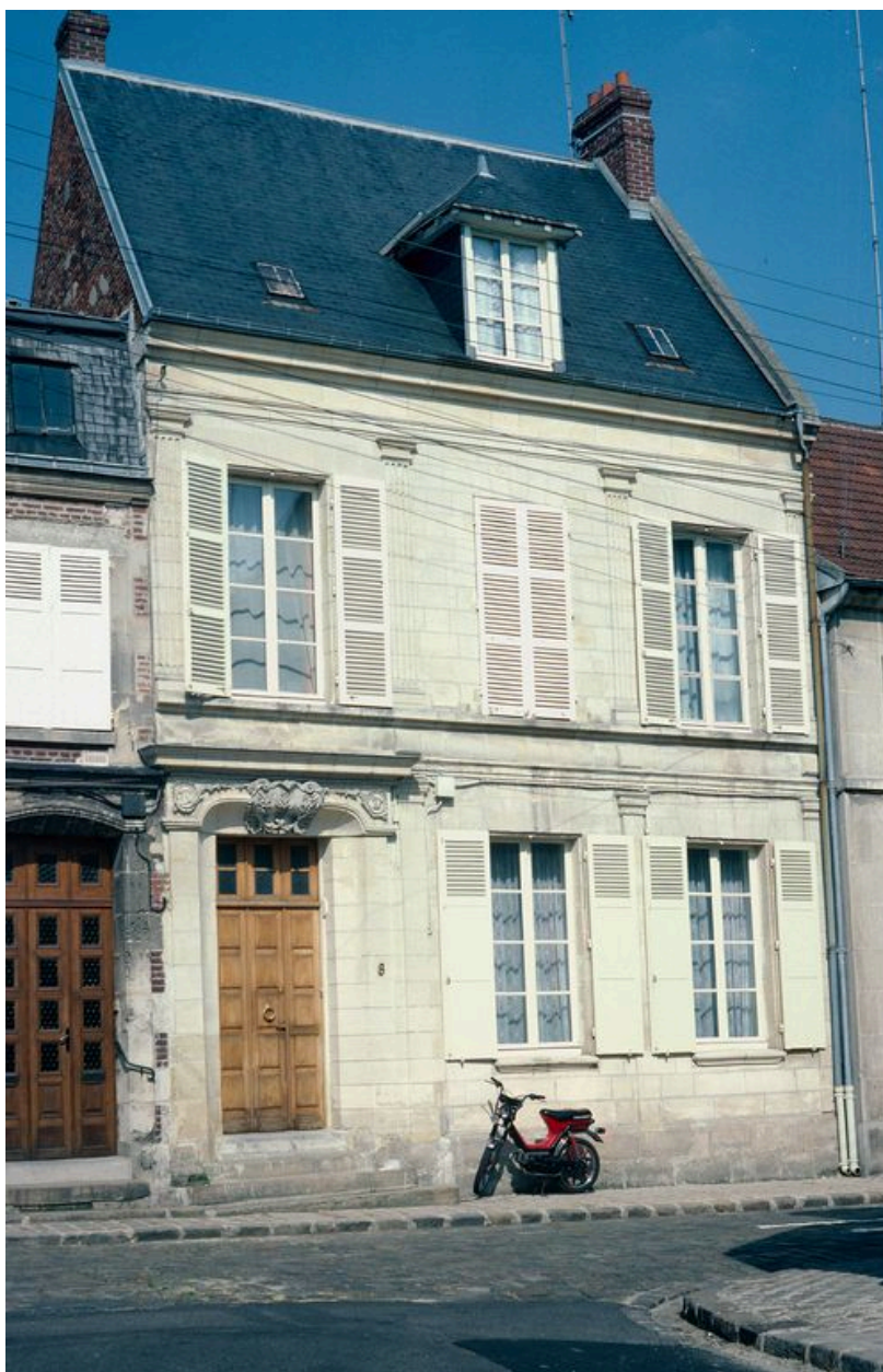
Elévation sur rue, de léger trois-quarts.