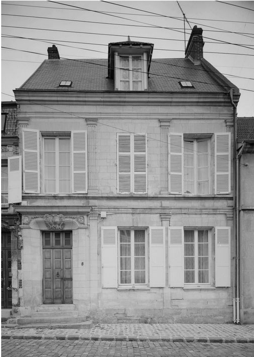
Elévation sur rue.