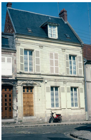
Élévation sur rue, de léger trois-quarts.