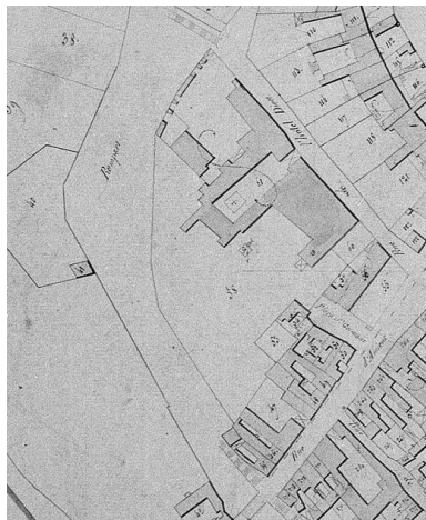
Extrait du cadastre napoléonien (DGI). IVR22_20096000553NUCA