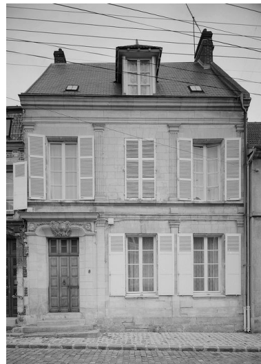
Élévation sur rue. IVR22_19856001418V