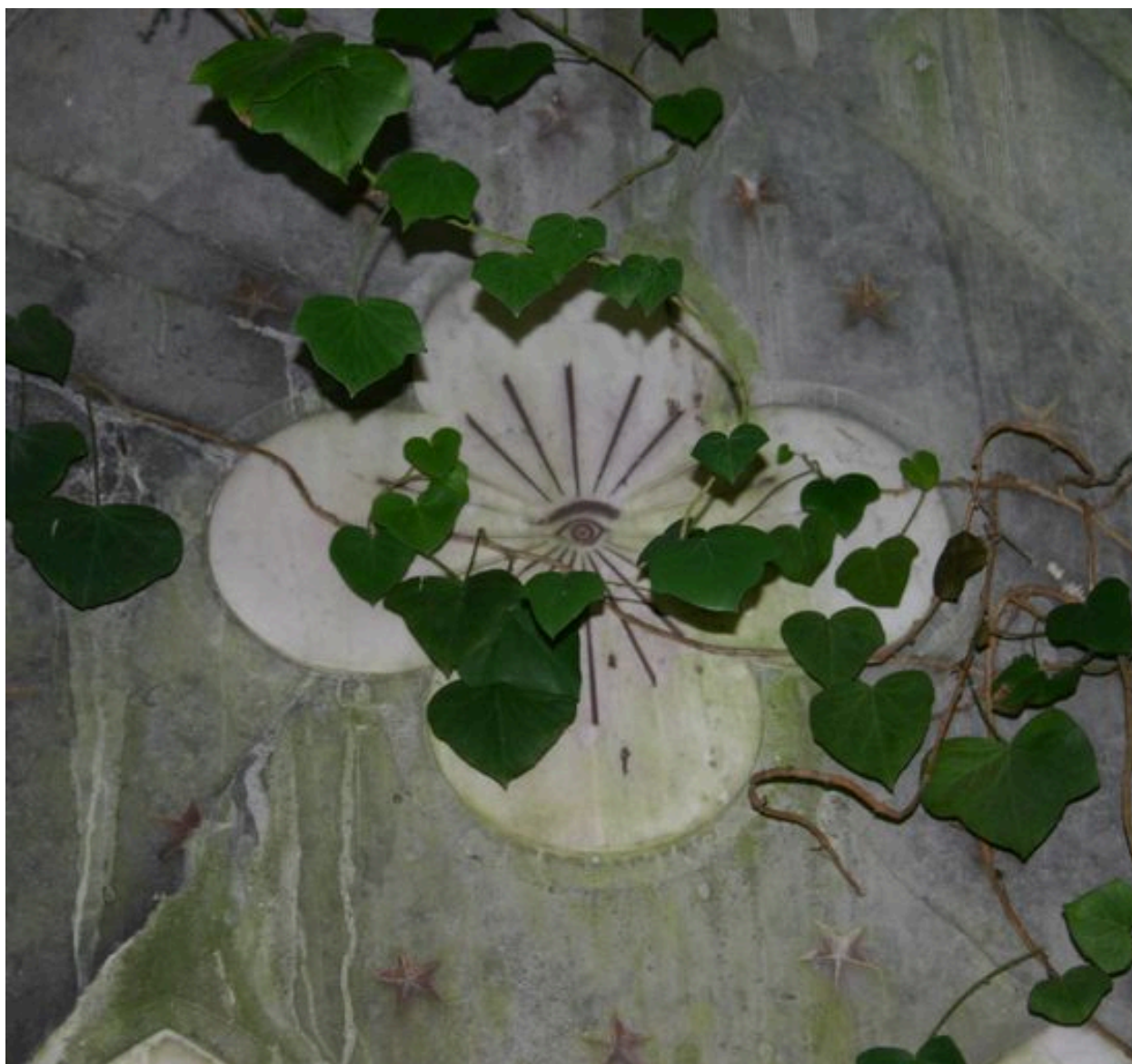
Détail du quadrilobe, ornant le mur postérieur du tombeau.