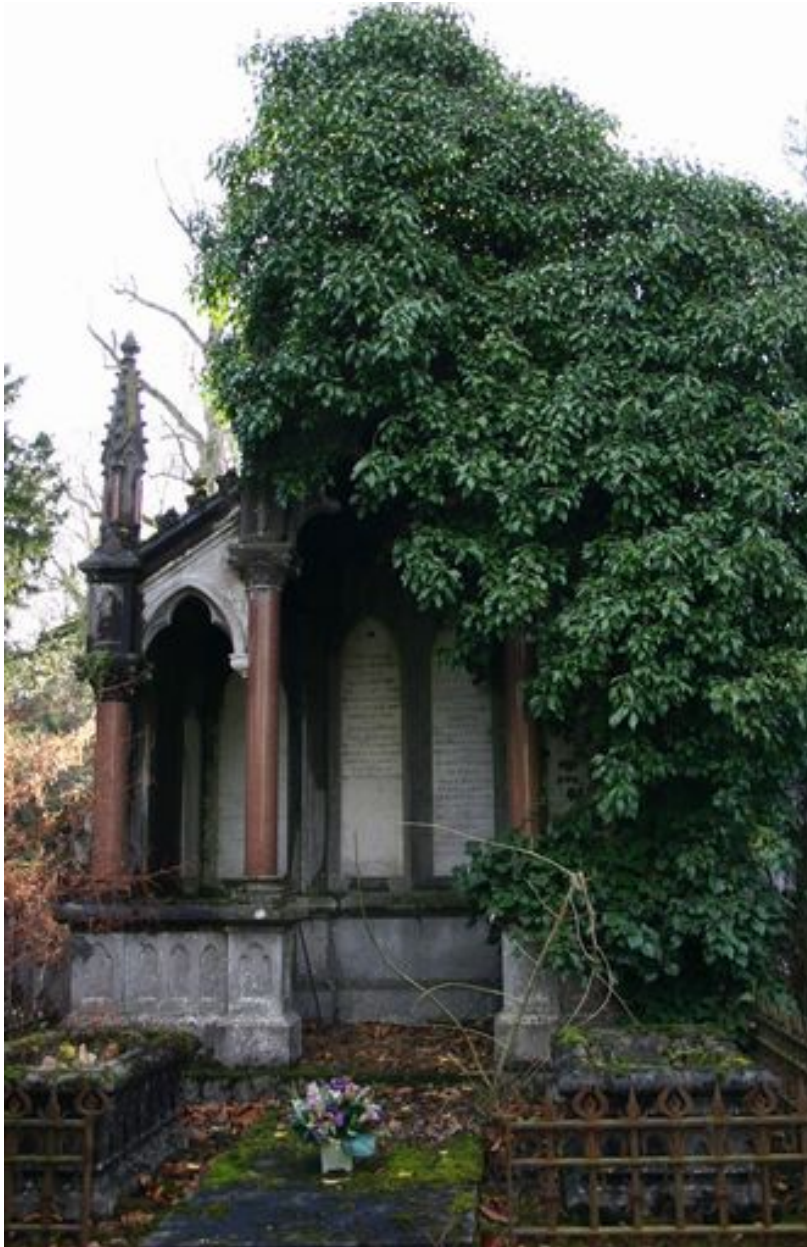
Tombeau en forme de niche monumentale, de style néogothique.