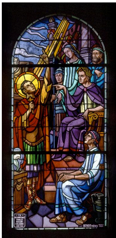
Vue générale de la verrière.