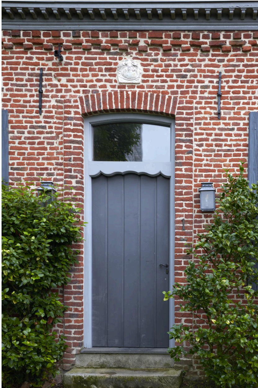
Détail de la porte d'entrée et du blason buché.