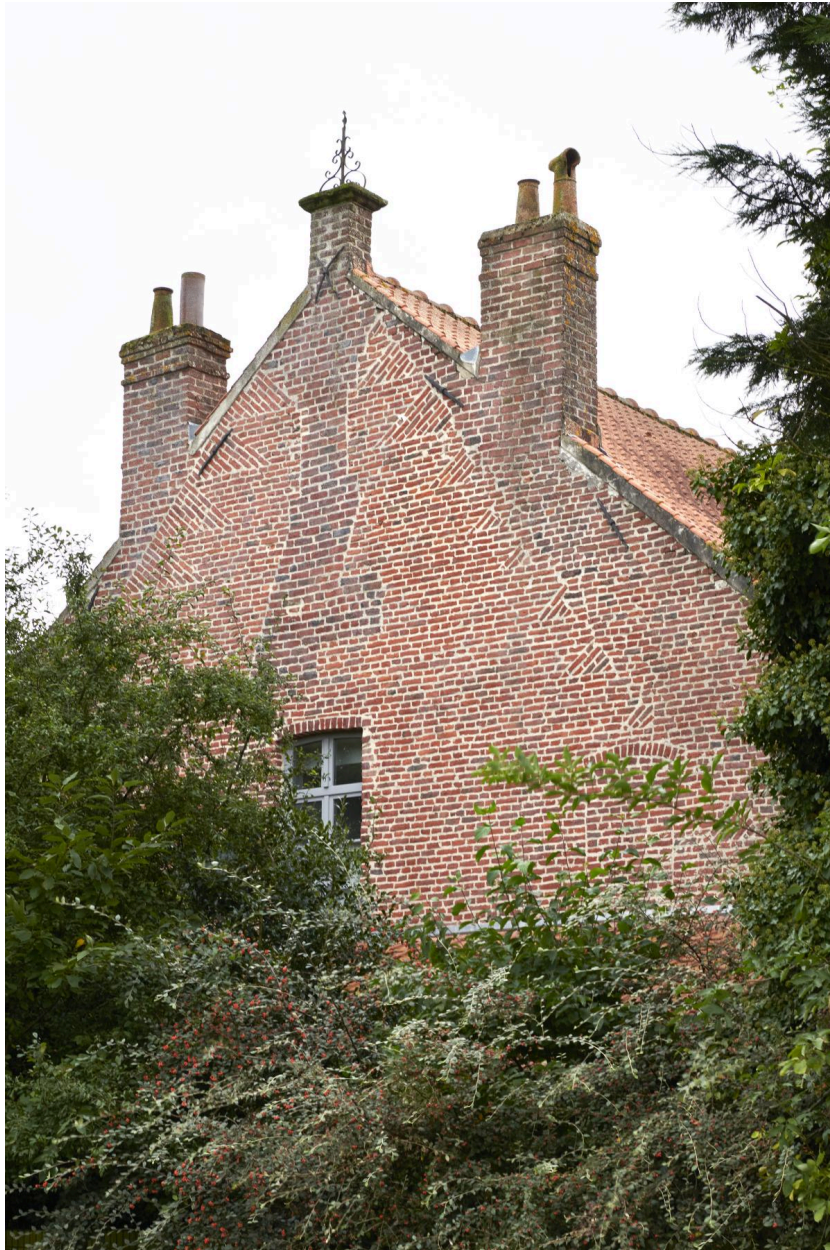
Détail du pignon nord.