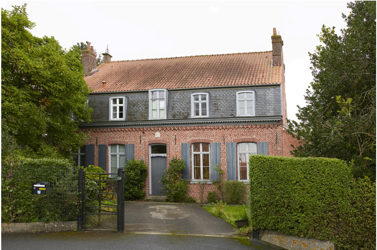
Vue sur rue.