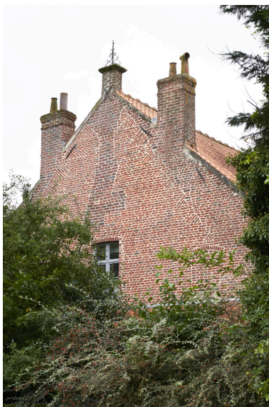
Détail du pignon nord. IVR32_20255900399NUCA