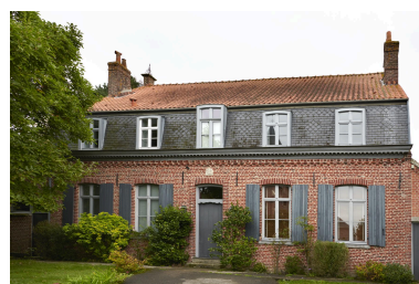
Façade principale (ouest). IVR32_20255900396NUCA