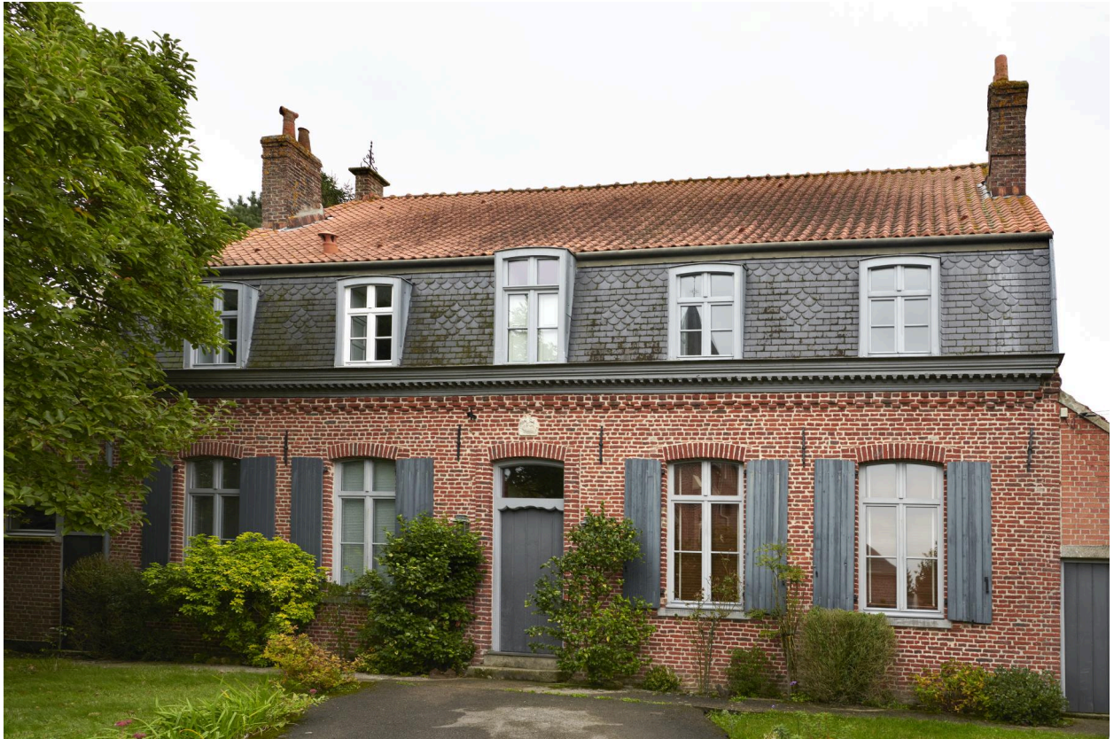
Façade principale (ouest).