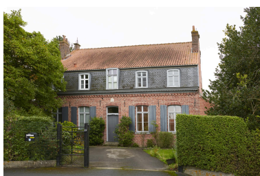
Vue sur rue.