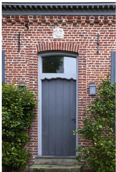
Détail de la porte d'entrée et du blason buché. IVR32_20255900397NUCA