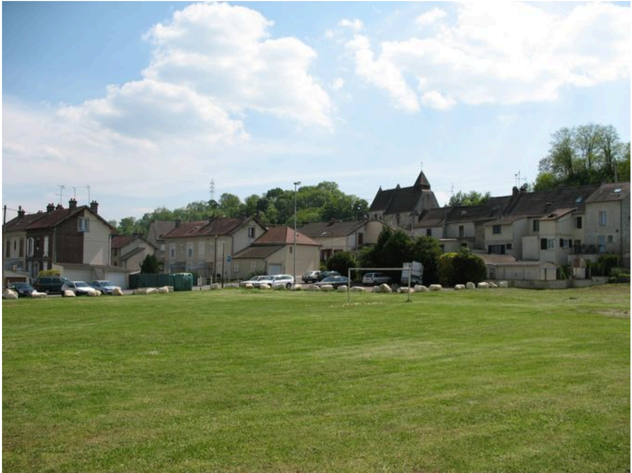
Vue générale de la cité Marinoni.