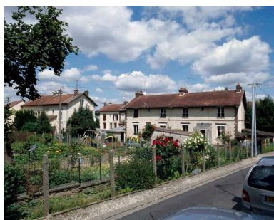
Maison ouvrière de la cité Marinoni.