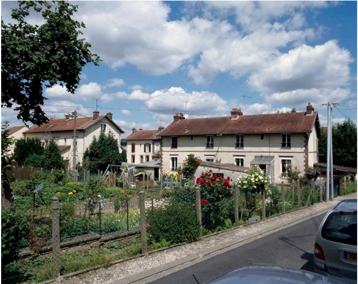
Maison ouvrière de la cité Marinoni.