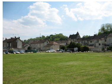
Vue générale de la cité Marinoni. IVR22_20086005151NUCA