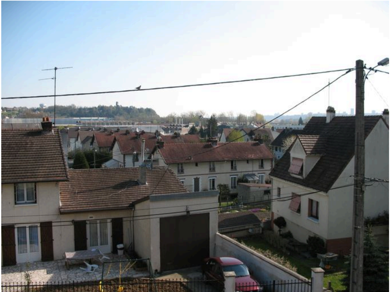
Toits des maisons de la cité Marinoni.