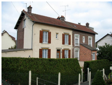
Une maison ouvrière, regroupant 4 logements, construite par les architectes Perret pour la société Marinoni. IVR22_20076005589NUCA