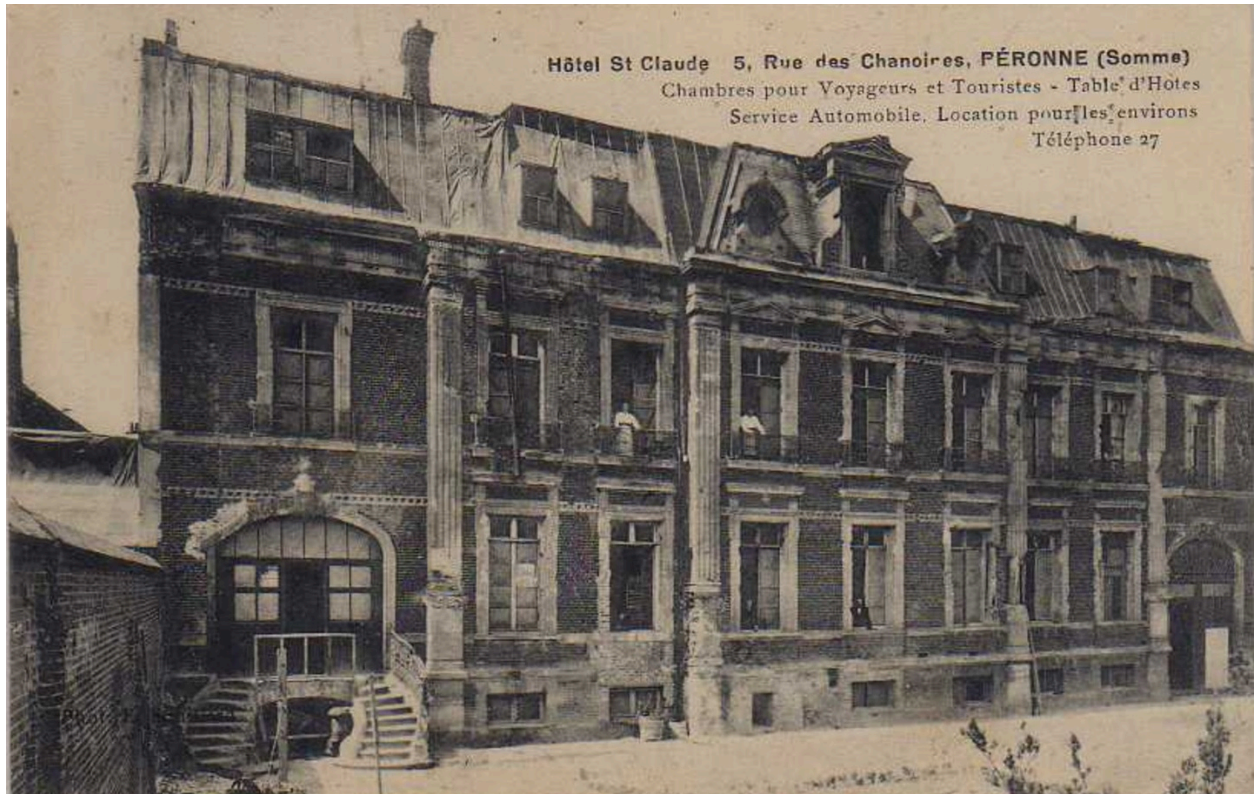
Hôtel Saint-Claude. carte postale (coll. part).