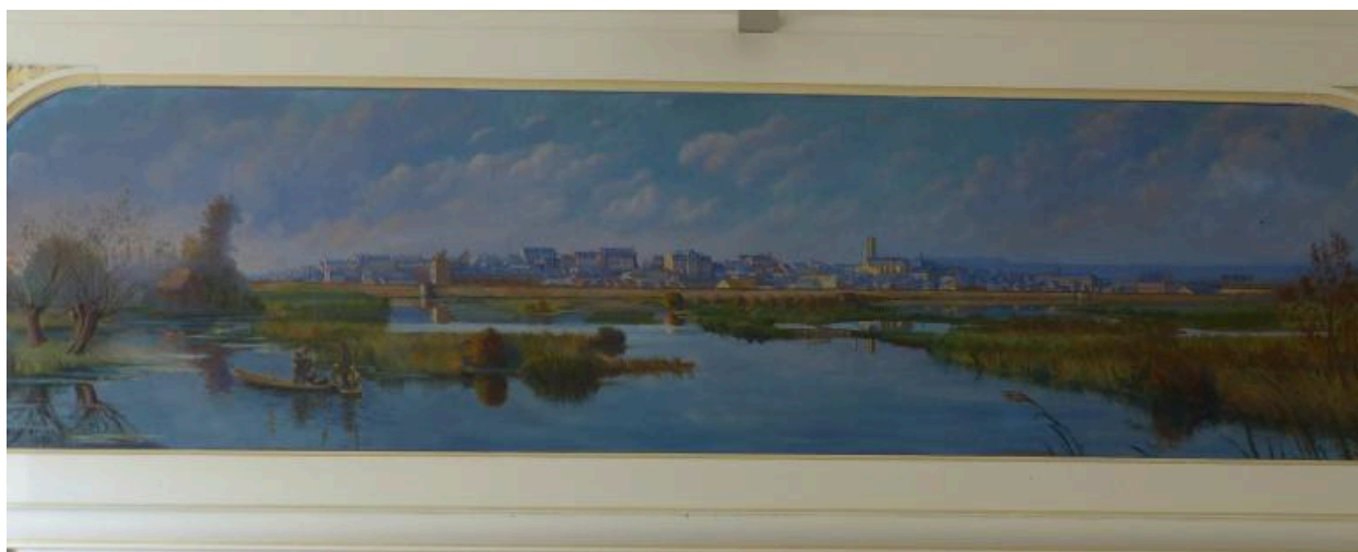
Vue de Péronne à la veille de la première guerre mondiale, peinture d'H. Routier, 1927.