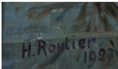
Vue de détail sur la date protée et la signature. IVR32_20188005042NUCA