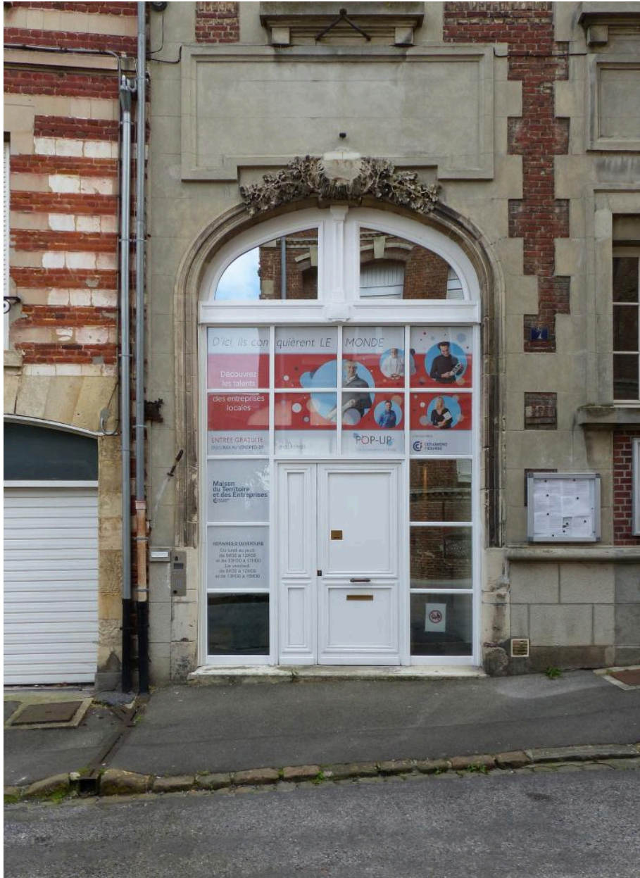
Vue de l'ancienne porte cochère.