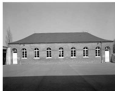
Salle de classe au fond de la cour arrière.