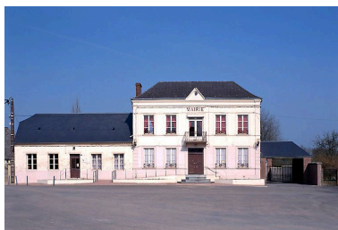
Vue générale depuis le sud-ouest. IVR22_19990201285XA