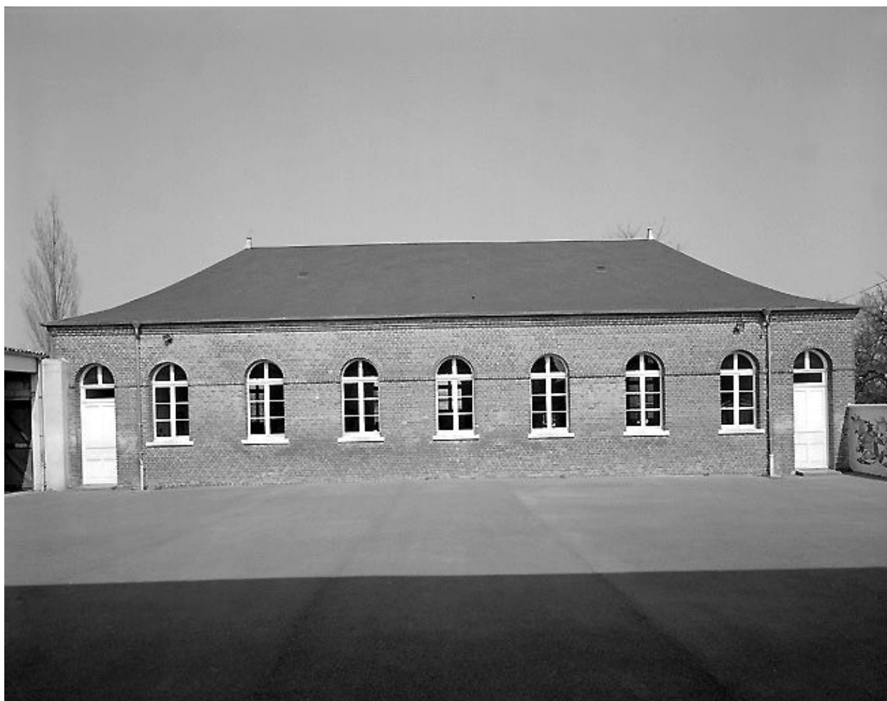
Salle de classe au fond de la cour arrière.