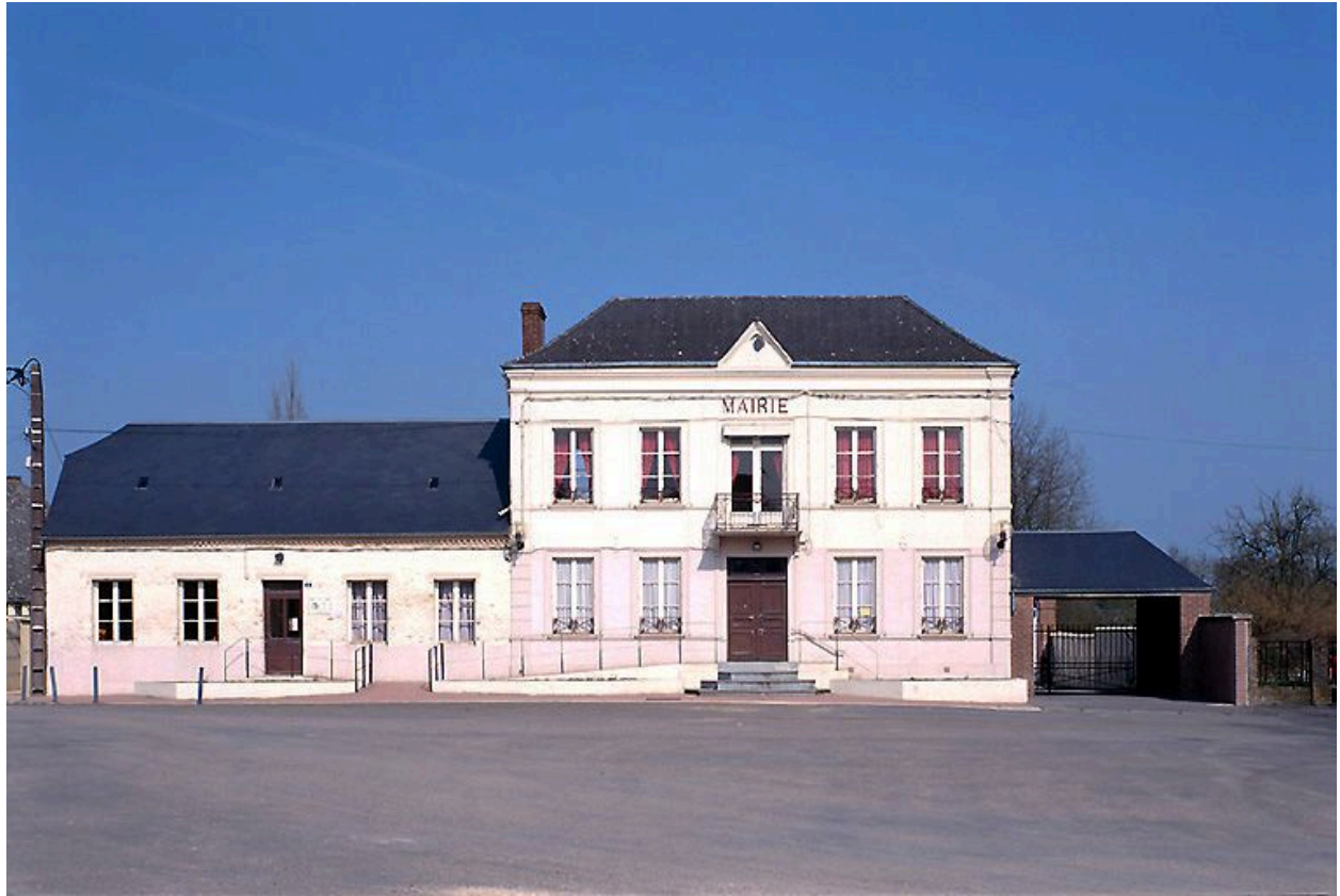
Vue générale depuis le sud-ouest.