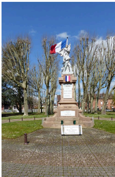
Vue générale. IVR32_20210205028NUCA