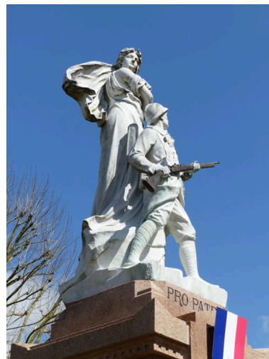
Vue du groupe sculpté, depuis le sud-ouest.