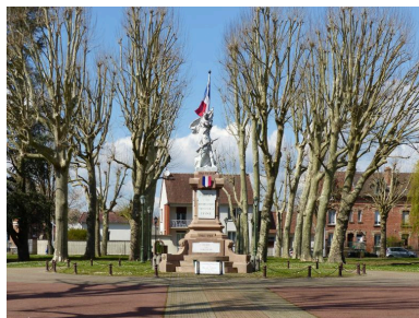
Vue de situation, dans le parc Sellier.