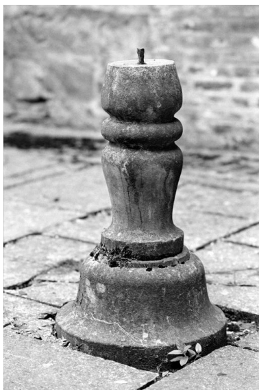
Pied des fonds baptismaux. IVR22_19990201827Z