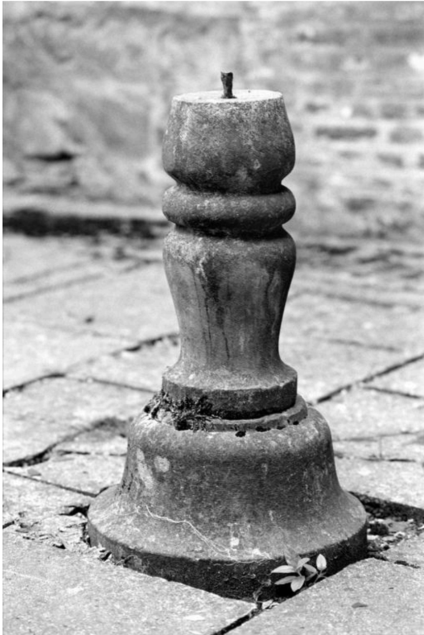
Pied des fonds baptismaux.