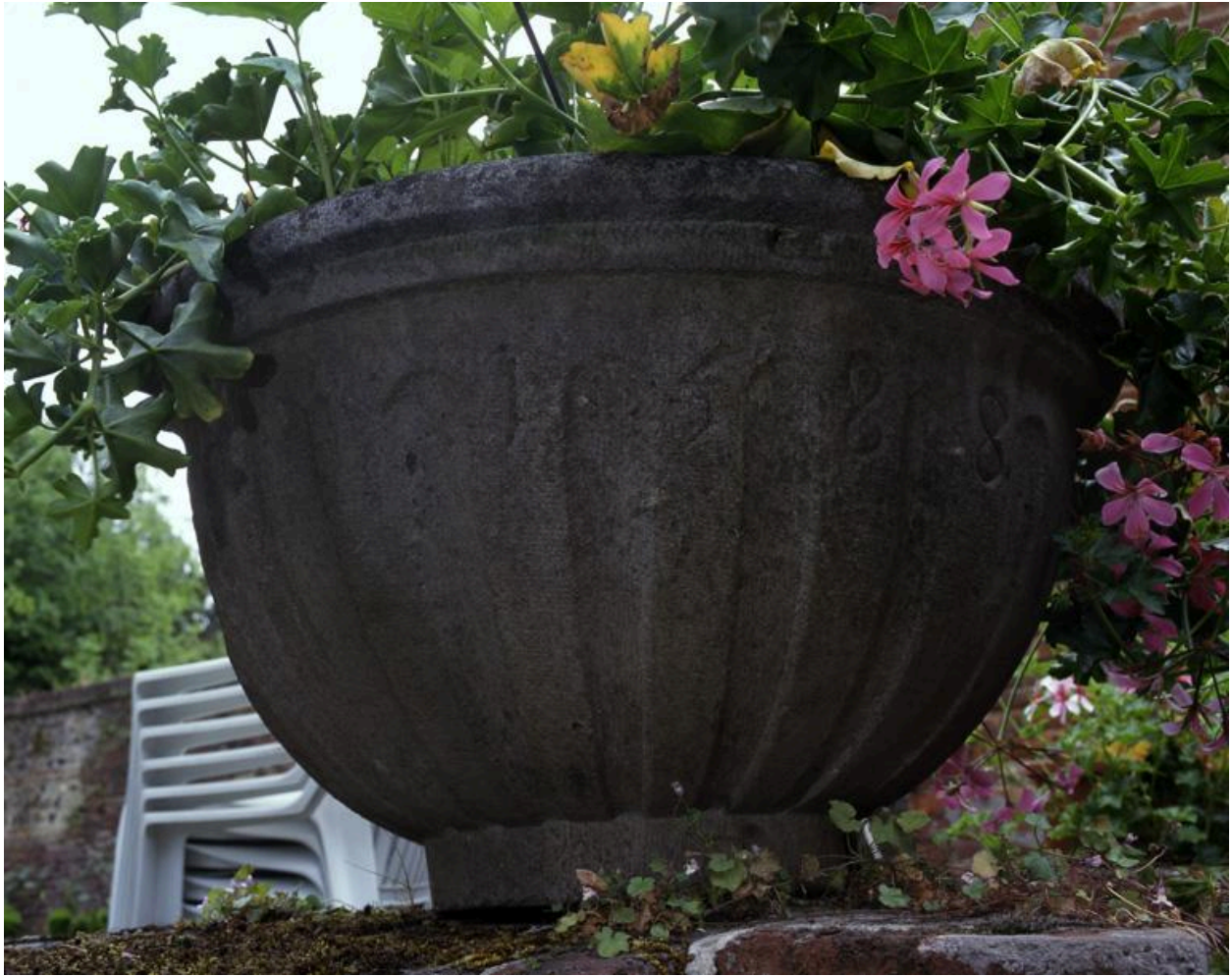
Cuve des précédents fonts baptismaux de l'église.