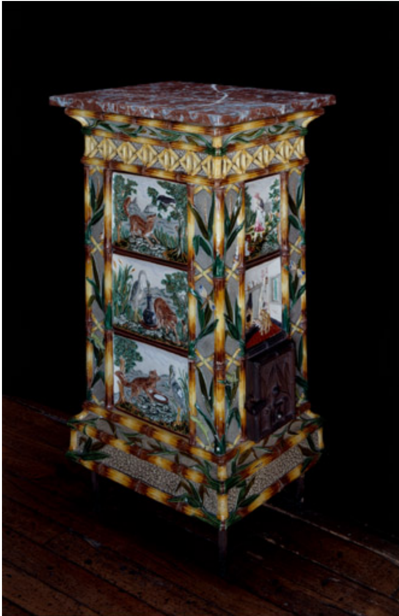
Poêle en fonte de fer et céramique, fin XIXe siècle, déposé au musée Jean de La Fontaine.