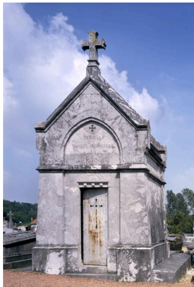
Vue de la chapelle funéraire.