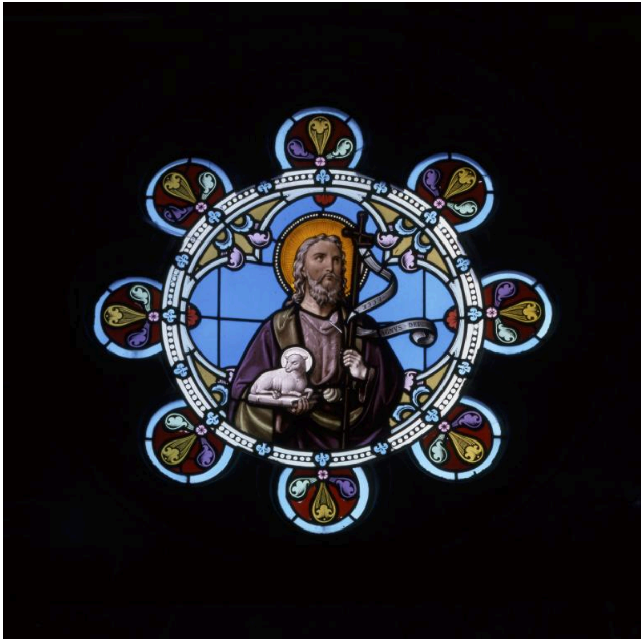
Vue de la verrière axiale représentant "l'Agnus Dei".