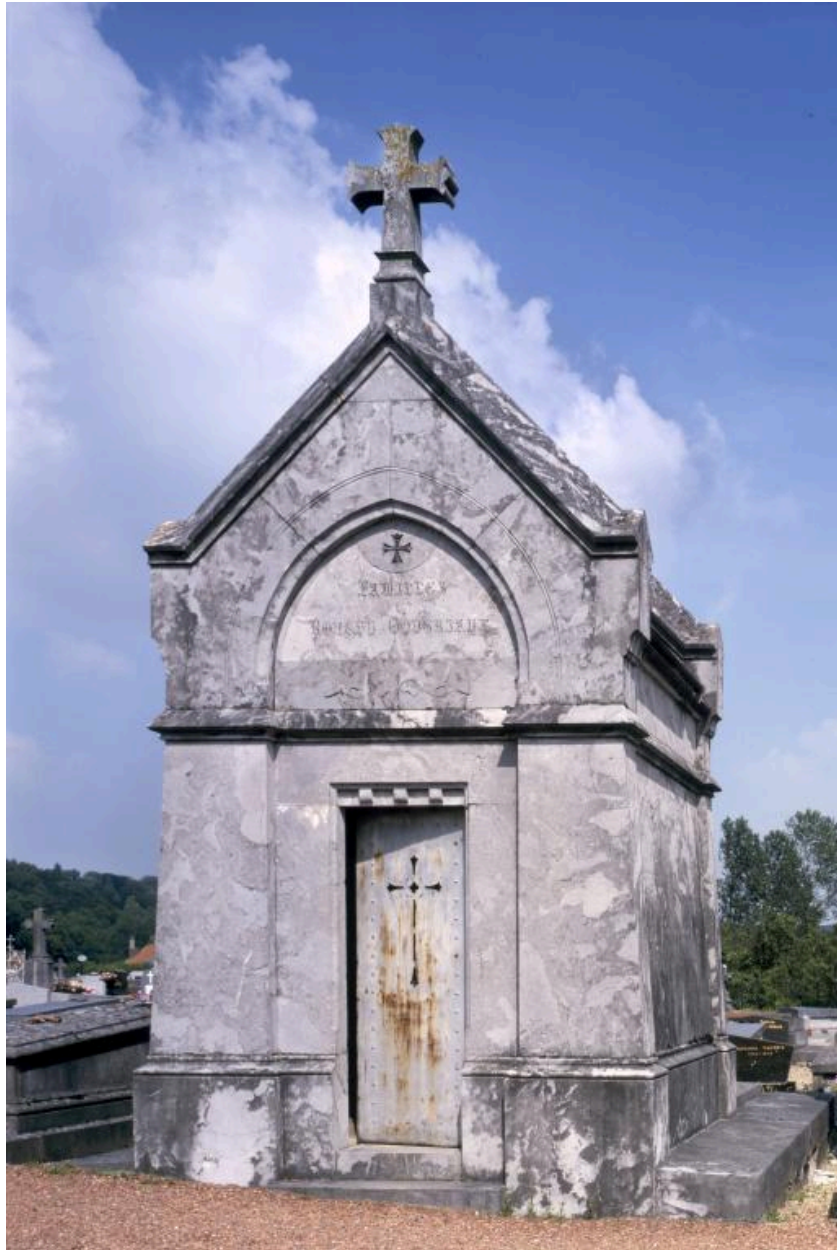
Vue de la chappelle funéraire.