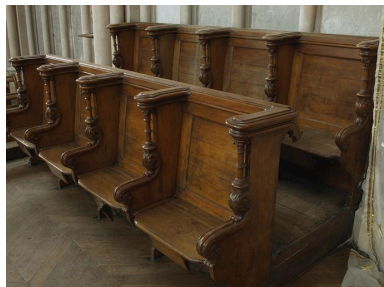
Vue générale d'une série