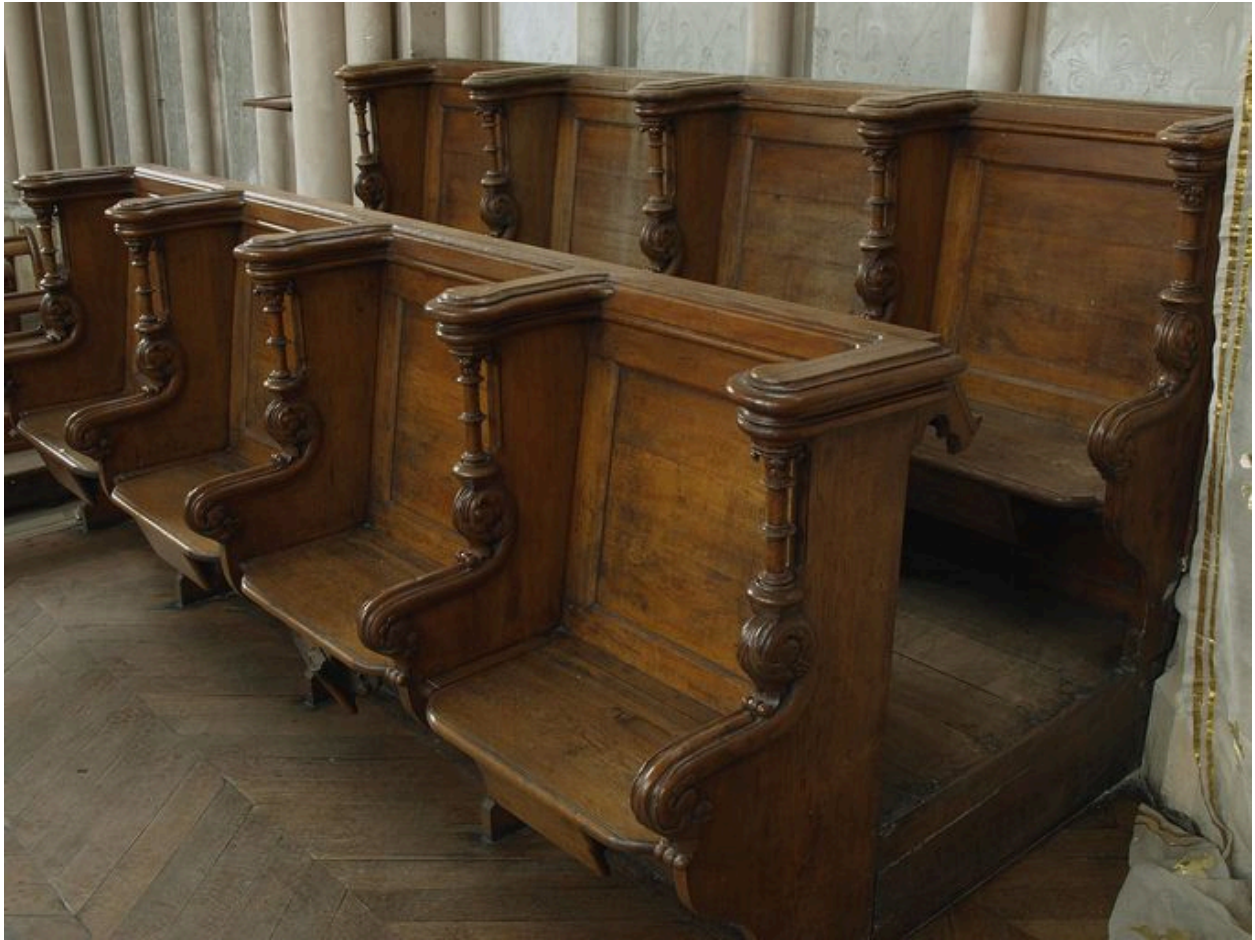
Vue générale d'une série