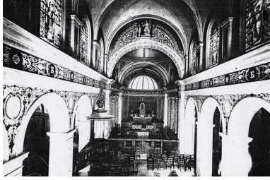
Vue intérieure de l'ancienne église Sainte-Anne, vers 1859 (AP Congrégation). IVR22_20058010515NUCA