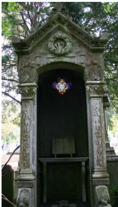
Détail de la façade antérieure du tombeau-chapelle. IVR22_20098001402NUCA