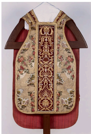
Devant de la chasuble. IVR22_19846000569XA