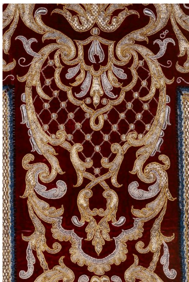
Détail de la chasuble.