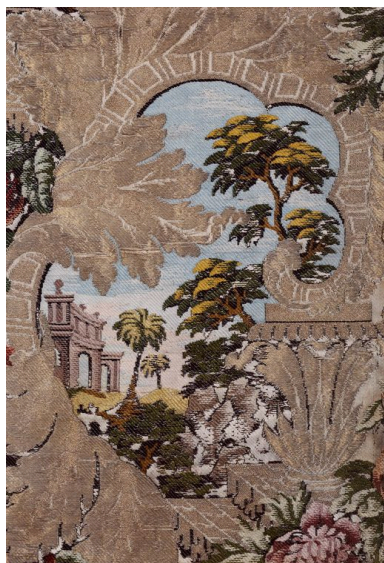
Détail du voile du calice.