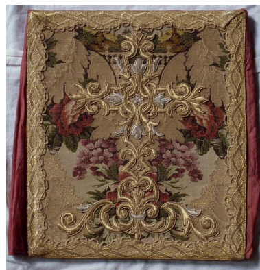
Bourse de corporal. Vue générale. IVR22_19946002035ZA