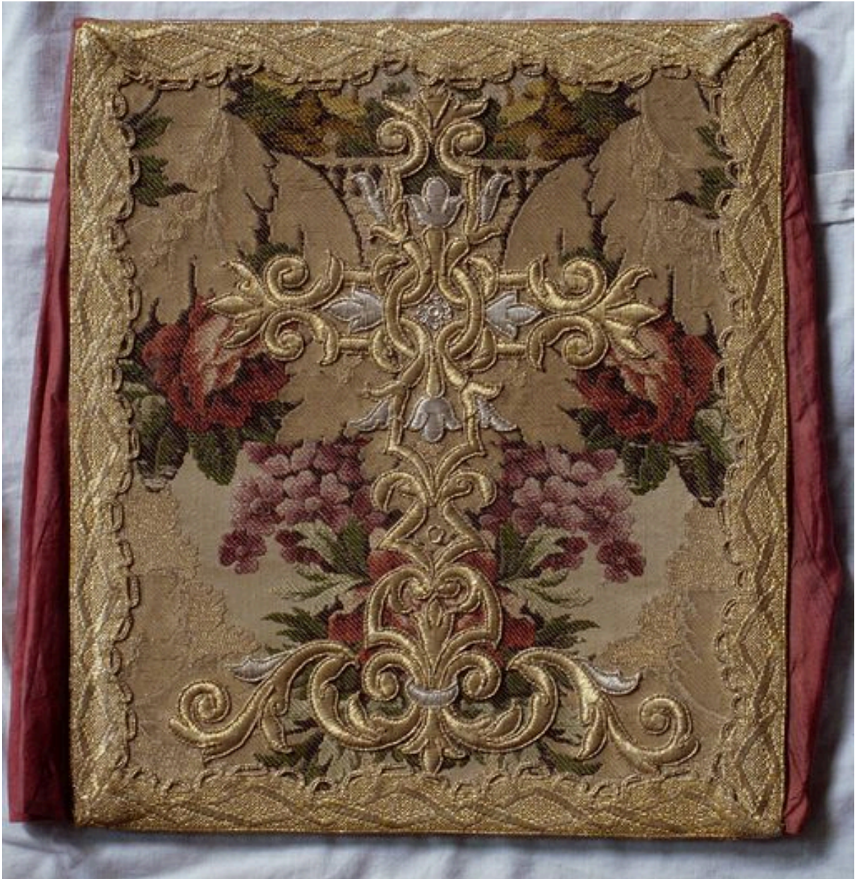
Bourse de corporal. Vue générale.