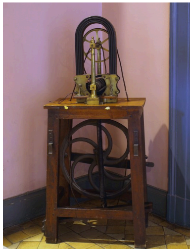
Vue générale IVR31_20106204462NUCA