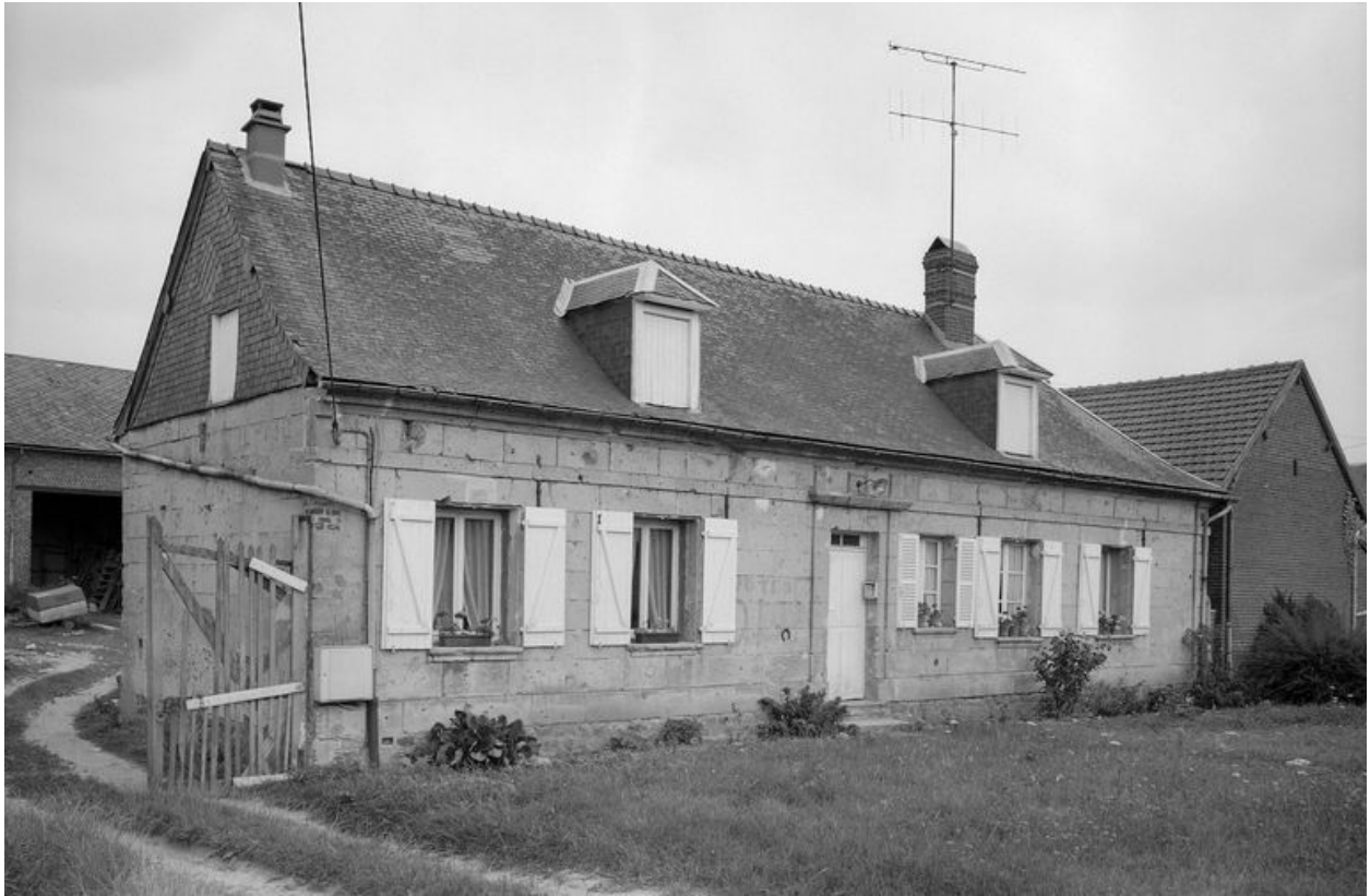
Elévation sur rue.