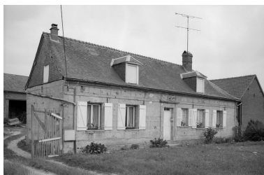
Élévation sur rue. IVR22_19846001067X

Plan de situation. Extrait du plan cadastral de 1978, section AB 62. IVR22_20096000118NUCA