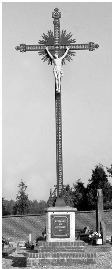
La croix de cimetière.