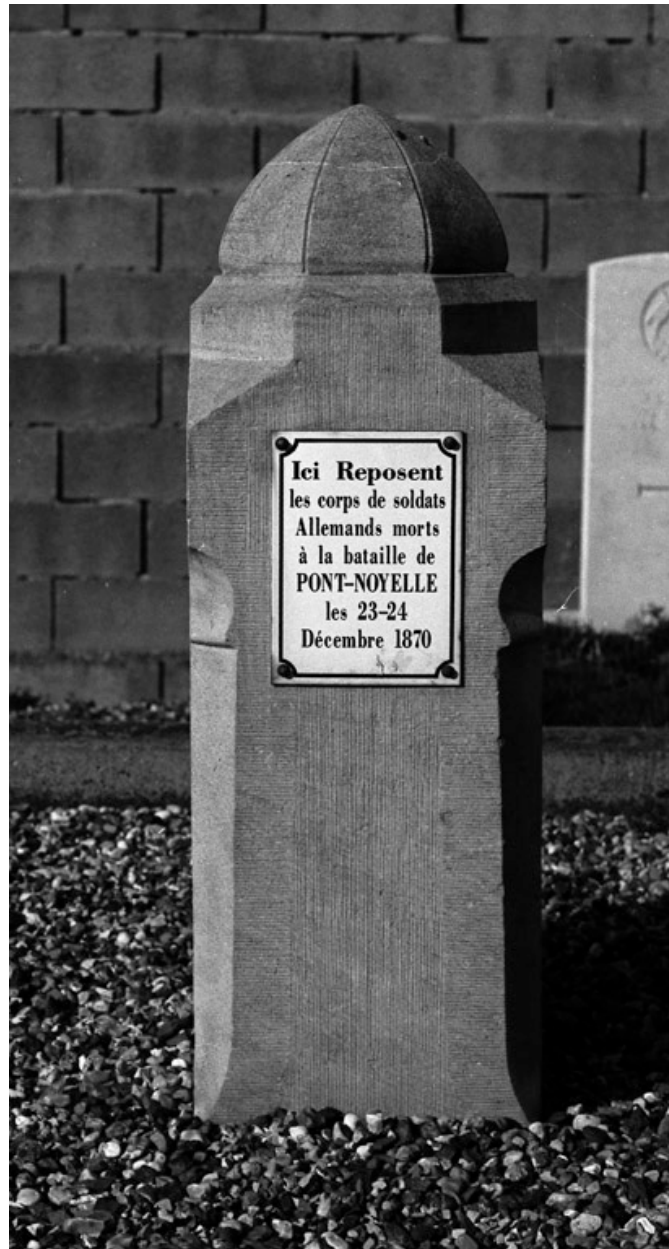
Petite stèle en pierre de Belgique, en souvenir des soldats allemands morts pendant la bataille de l'Hallue, les 23 et 24 décembre 1870 (partie occidentale du cimetière).