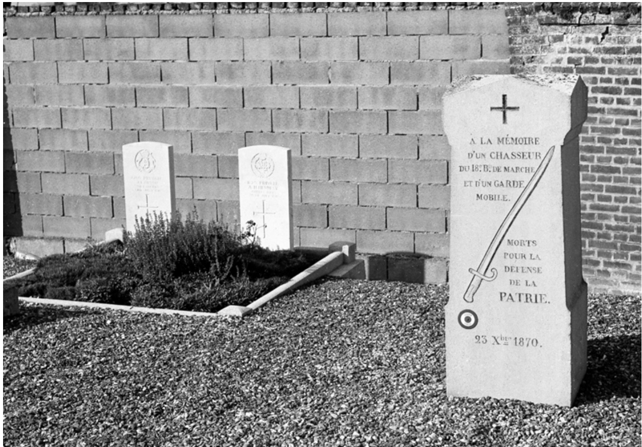
Stèle par le marbrier amiénois Coenen, pour un chasseur et un garde mobile anonymes tués pendant la bataille de l'Hallue, le 23 décembre 1870. Dans le fond, deux stèles militaires britanniques (juillet 1916, bataille de la Somme).