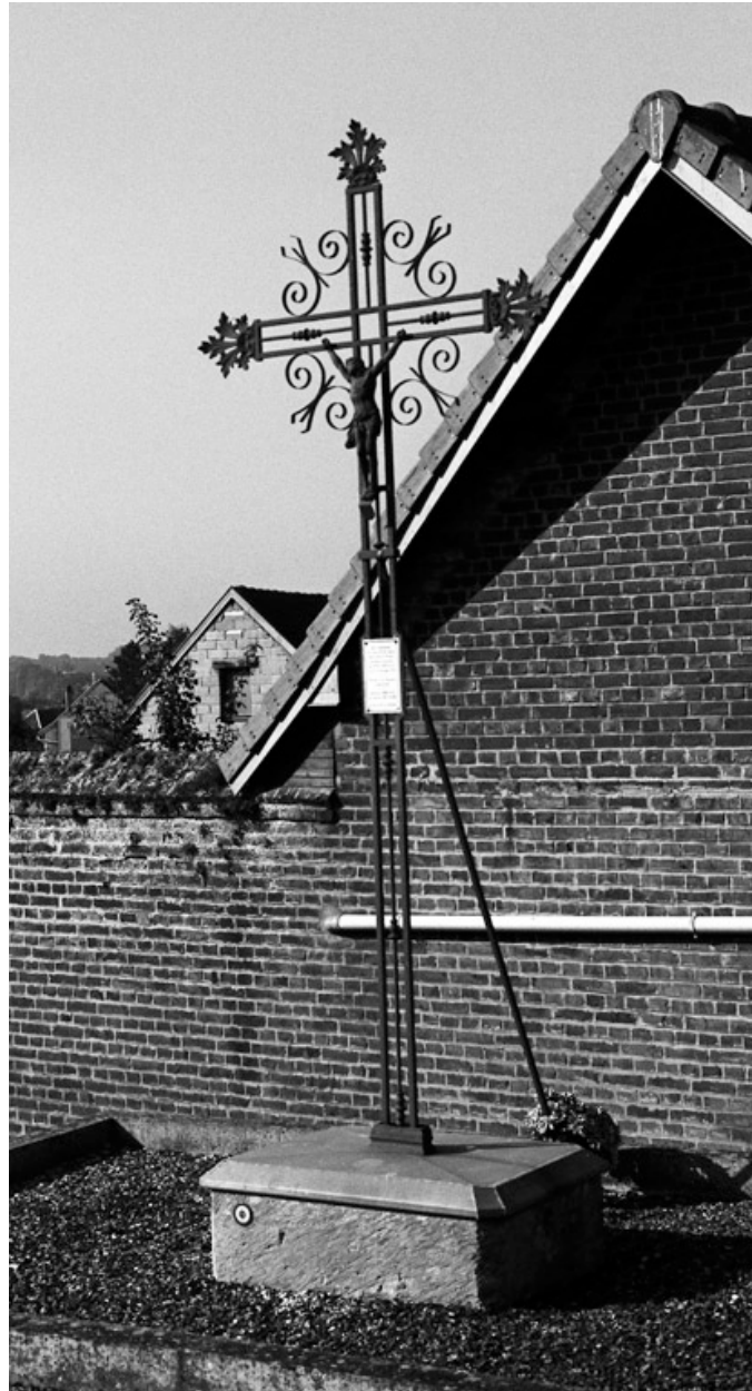
Monument érigé en souvenir des 68 soldats morts pour la France pendant la bataille de l'Hallue, le 23 et 24 décembre 1870.