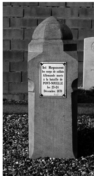
Petite stèle en pierre de Belgique, en souvenir des soldats allemands morts pendant la bataille de l'Hallue, les 23 et 24 décembre 1870 (partie occidentale du cimetière).