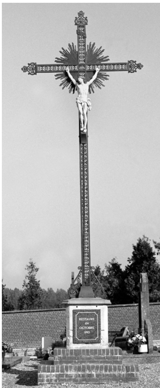
La croix de cimetière.