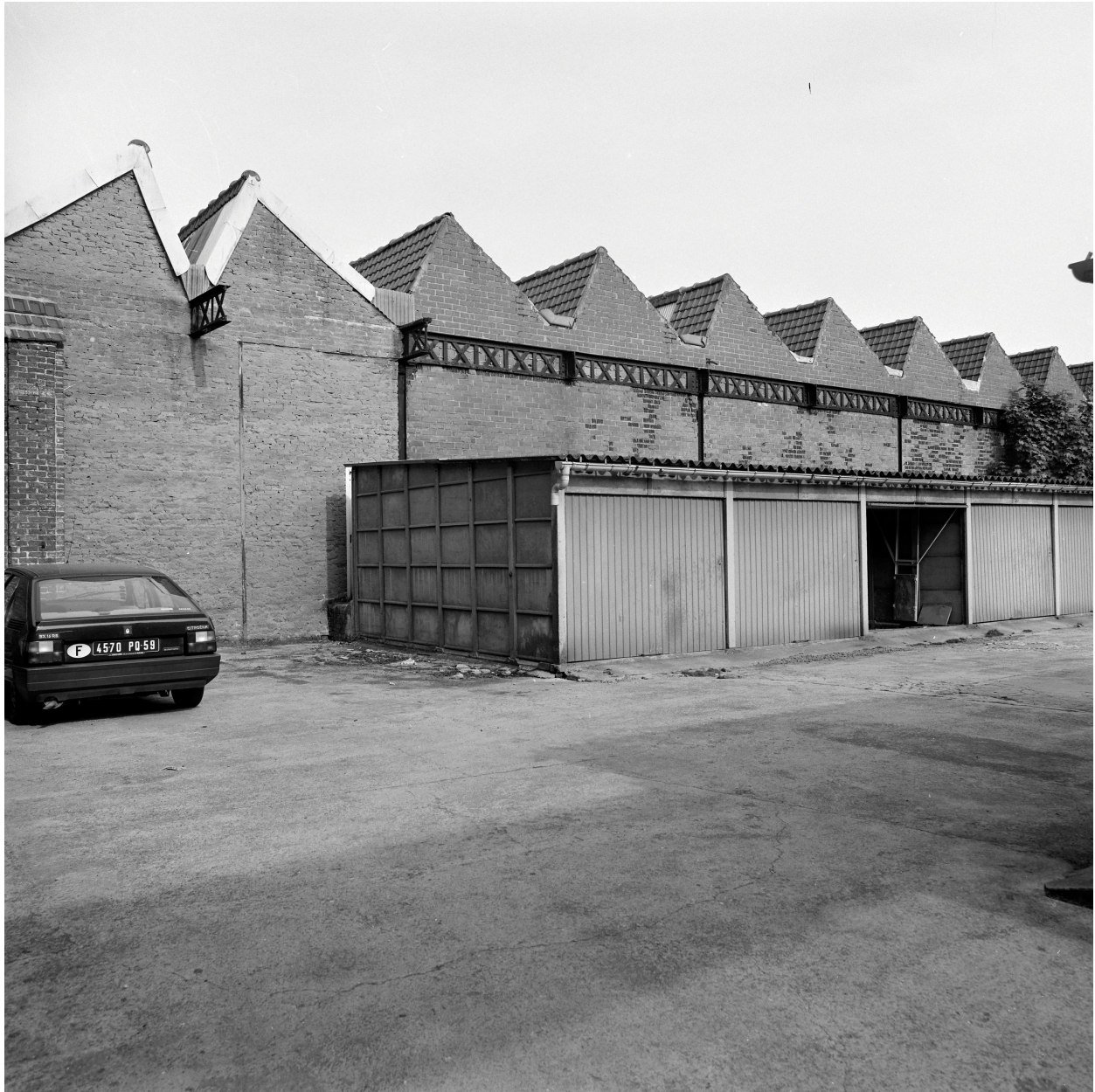
Atelier de fabrication. Vue prise depuis la rue des Quais.