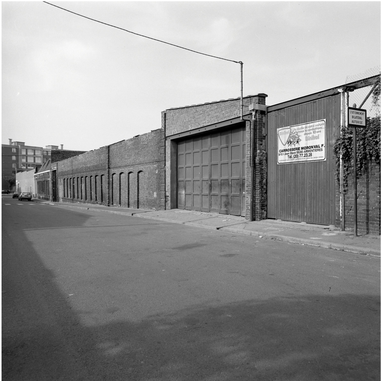
Élévation rue de Metz. Vue prise vers le Nord.