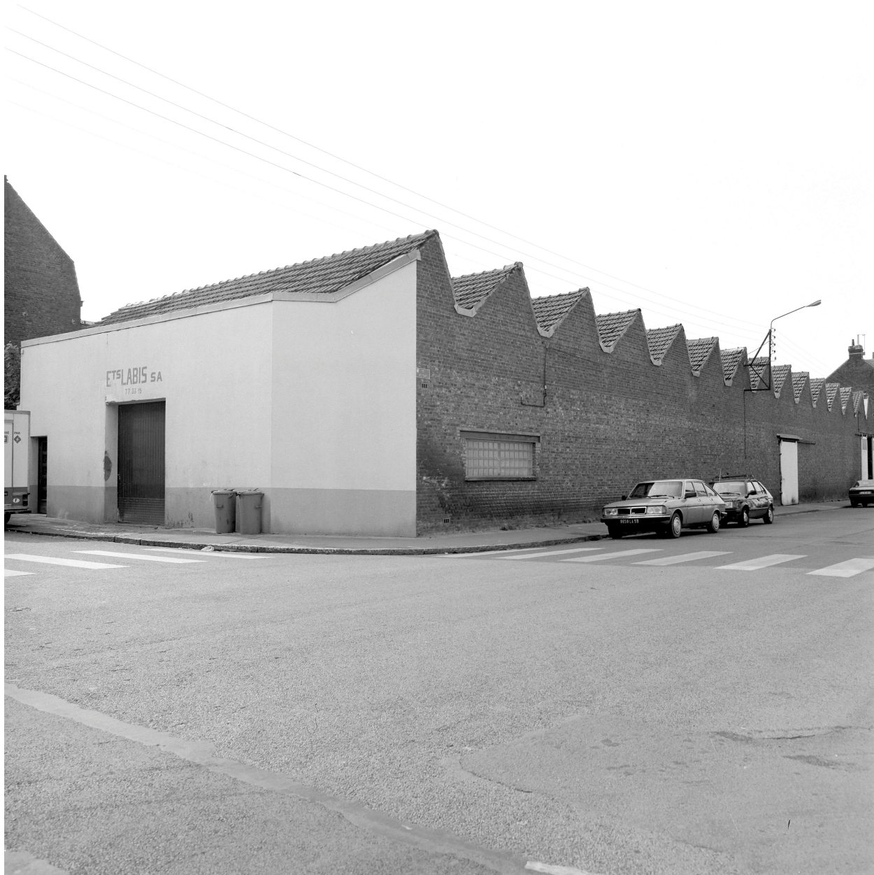
Atelier de fabrication, rue des Quais. Vue prise vers le Nord.