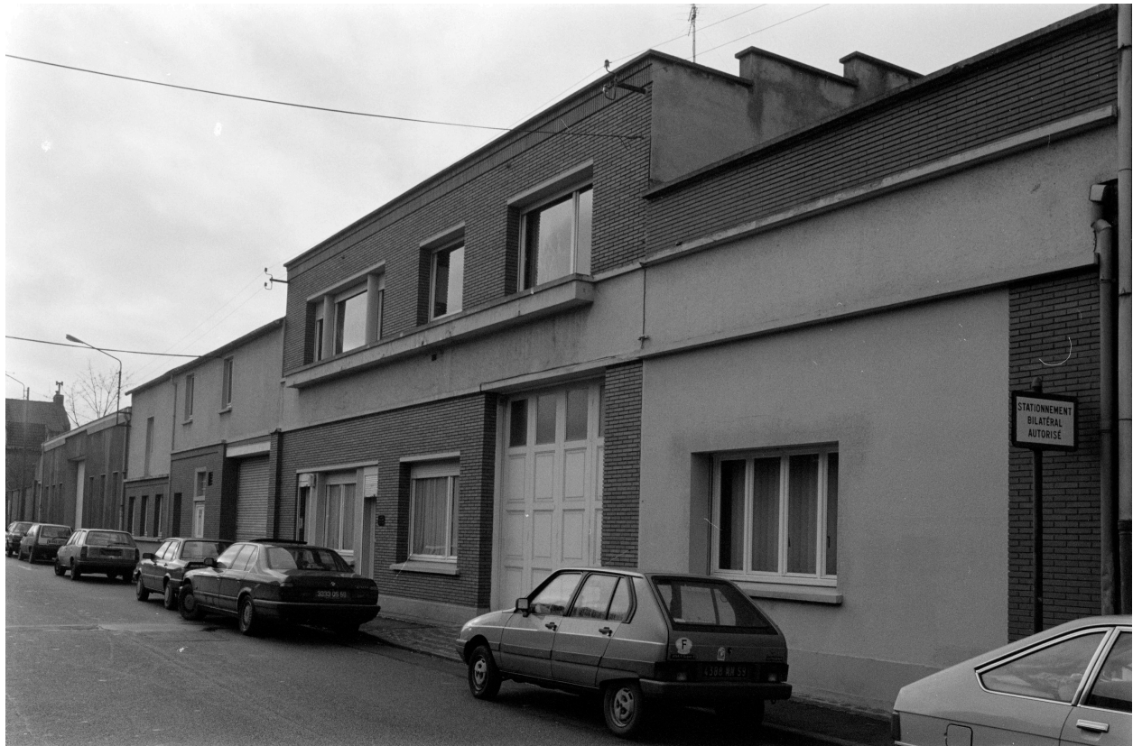
Bureaux rue de Metz.