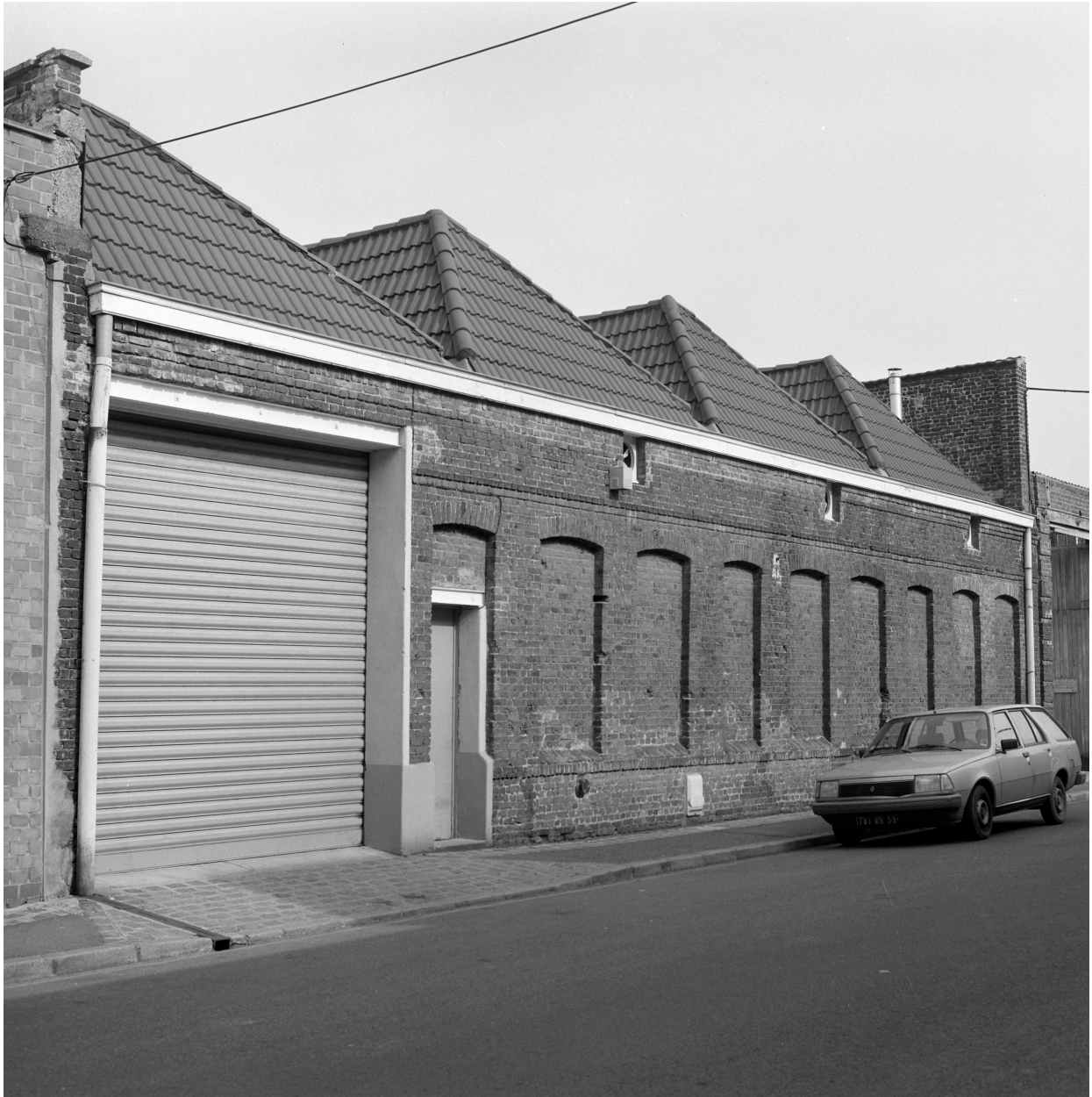
Atelier de fabrication depuis la rue de Metz. Vue prise vers l'est.