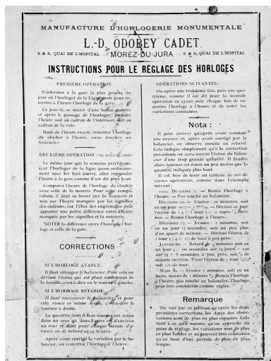
Instructions du fabricant. IVR22_19910201075X