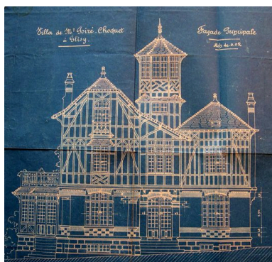
Elévation antérieure (AD Somme ; 10R 566). IVR22_20068010245NUCA