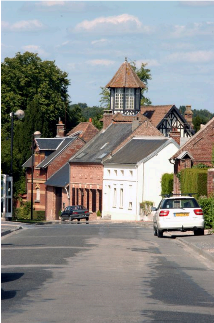
Vue de situation, maison à l'arrière-plan.