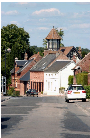
Vue de situation, maison à l'arrière-plan.