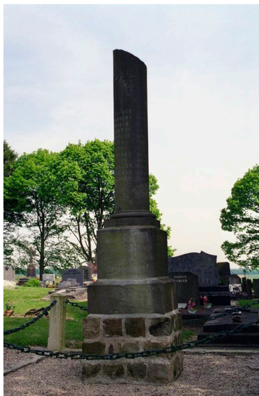
Le monument aux morts. IVR22_20018000120ZE