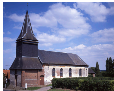
L'église Saint Jean-Baptiste.