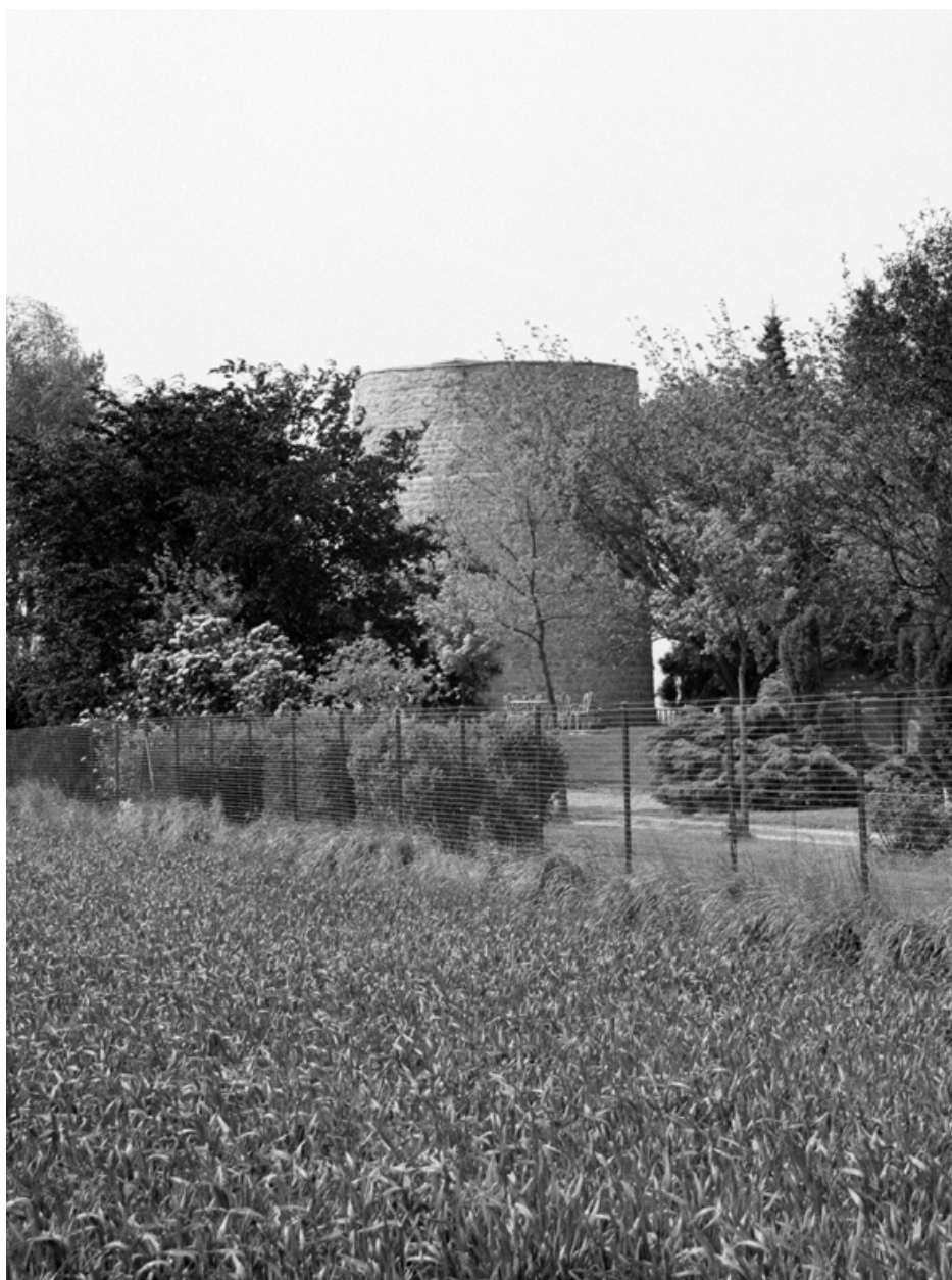
Le moulin Arrachard.