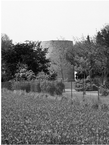
Le moulin Arrachard.