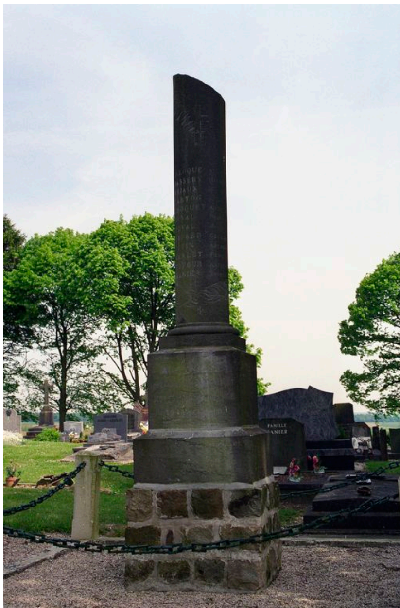
Le monument aux morts.