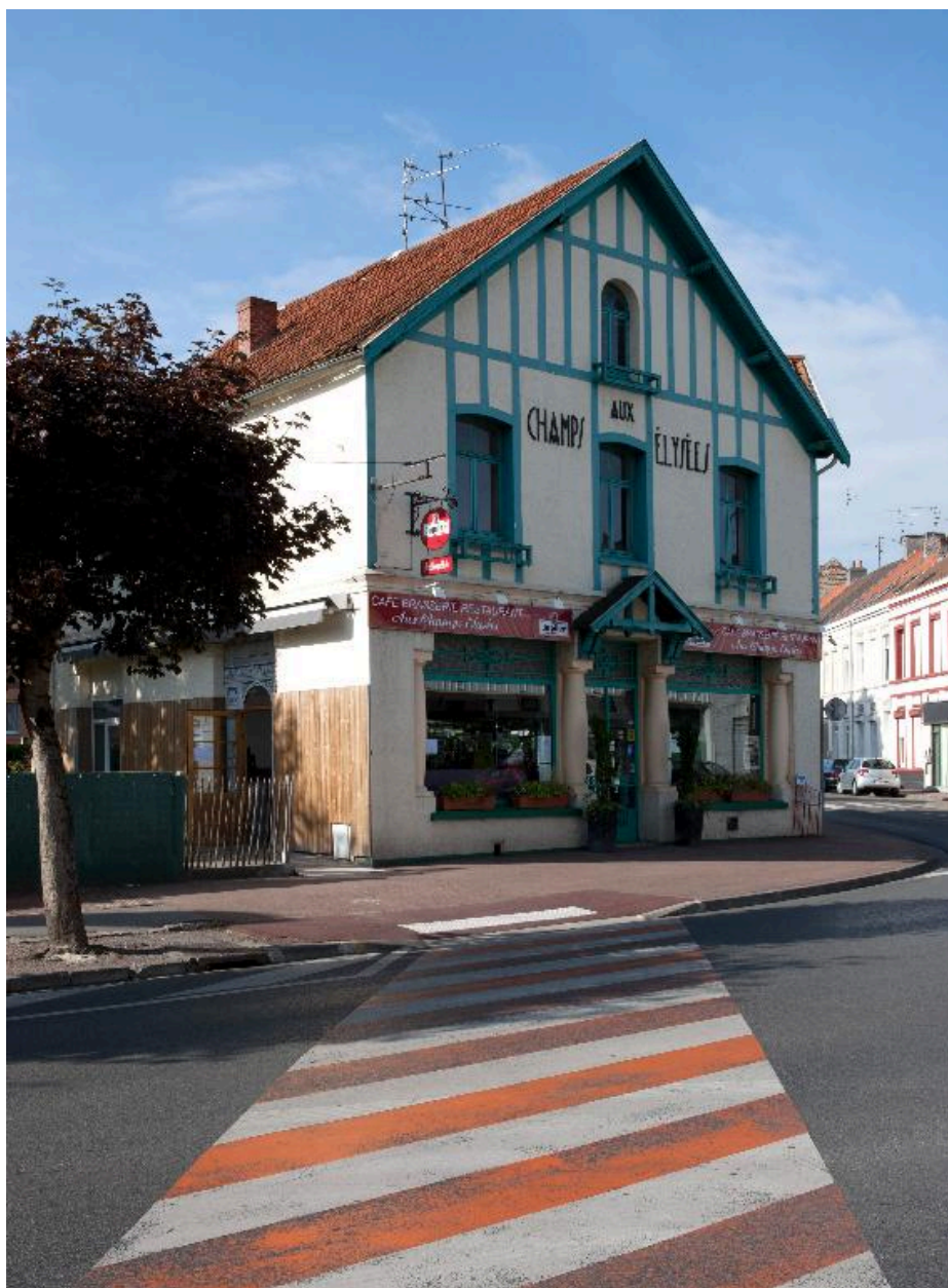
Café Aux Champs Elysées, 40 avenue du Clos, construit dans les années 1920.