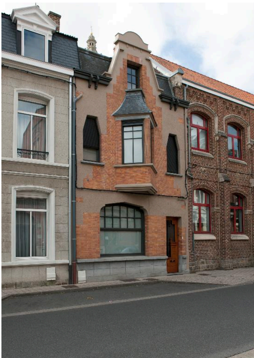
Maison datant des années 1920, 2 rue Mathieu-Dumoulin.