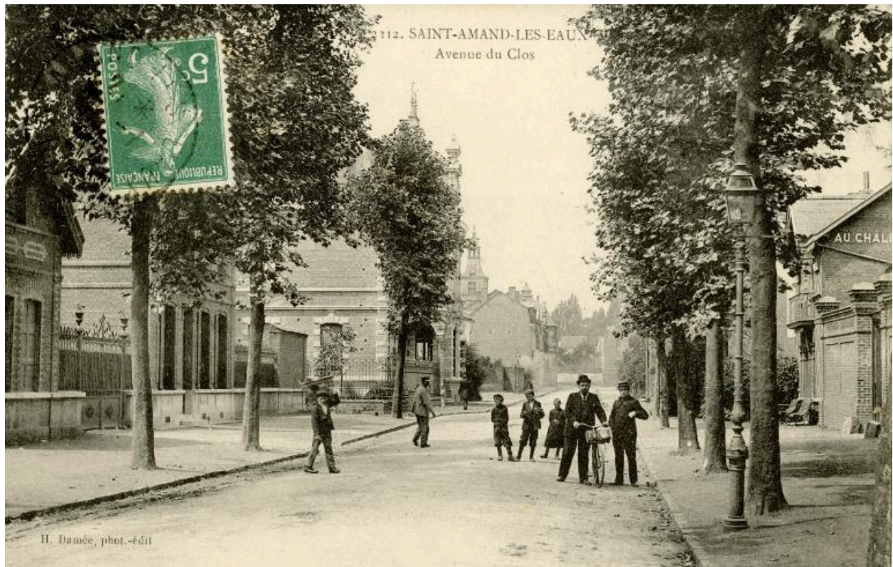
Vue générale de la rue Dumoulin, appelée du Clos, carte postale, 1er quart du 20e siècle.