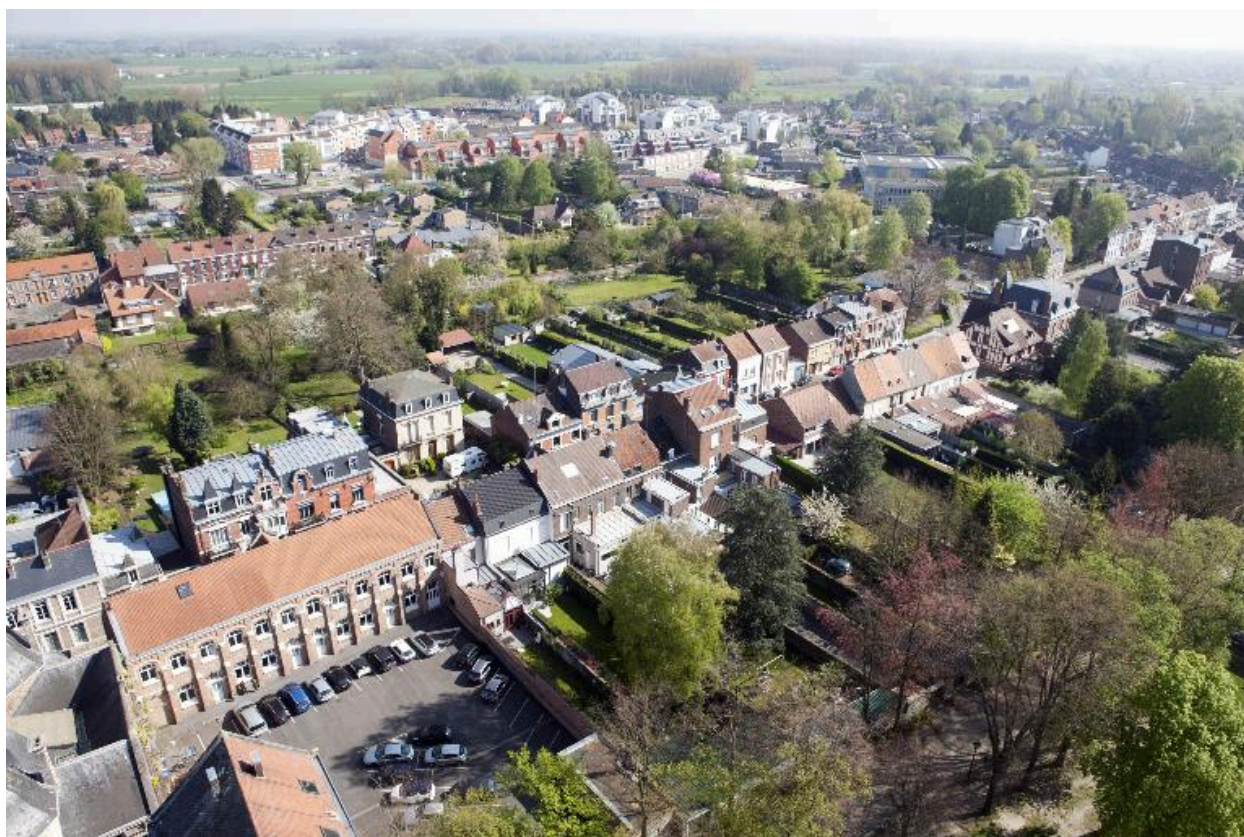
Vue générale de la rue Mathieu-Dumoulin et l'avenue du Clos, depuis la tour abbatiale.