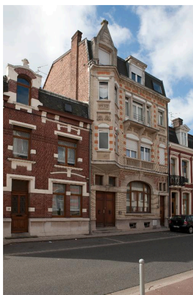
Maison construite dans les années 1920 d'inspiration de style Art-Déco, avenue du Clos.