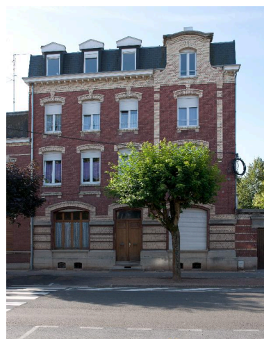
Immeuble, début XXe siècle (?), 6 avenue du Clos. IVR31_20125902167NUCA