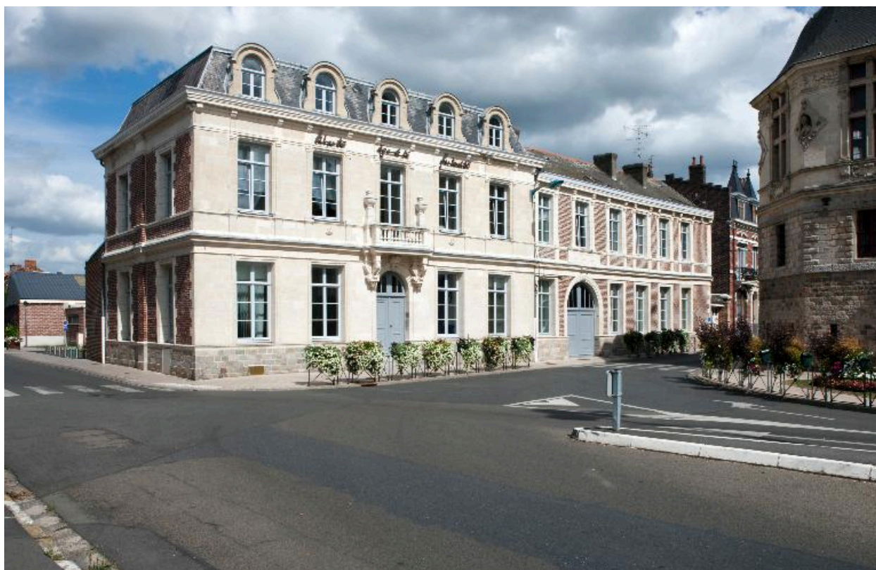
Ancienne maison bourgeoise intégrée dans l'actuel hôtel de ville, à l'angle de la rue Dumoulin et la Grand'Place..