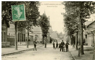
Vue générale de la rue Dumoulin, appelée du Clos, carte postale, 1er quart du 20e siècle. IVR31_20135908105NUCA