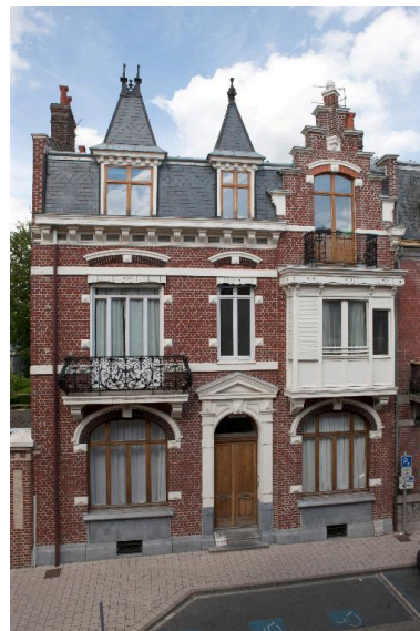
Maison patronale ou bourgeoise, rue Mathieu-Dumoulin.