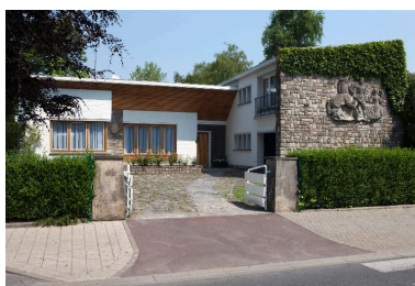
Maison datant des années 1960-70, rue Mathieu-Dumoulin.