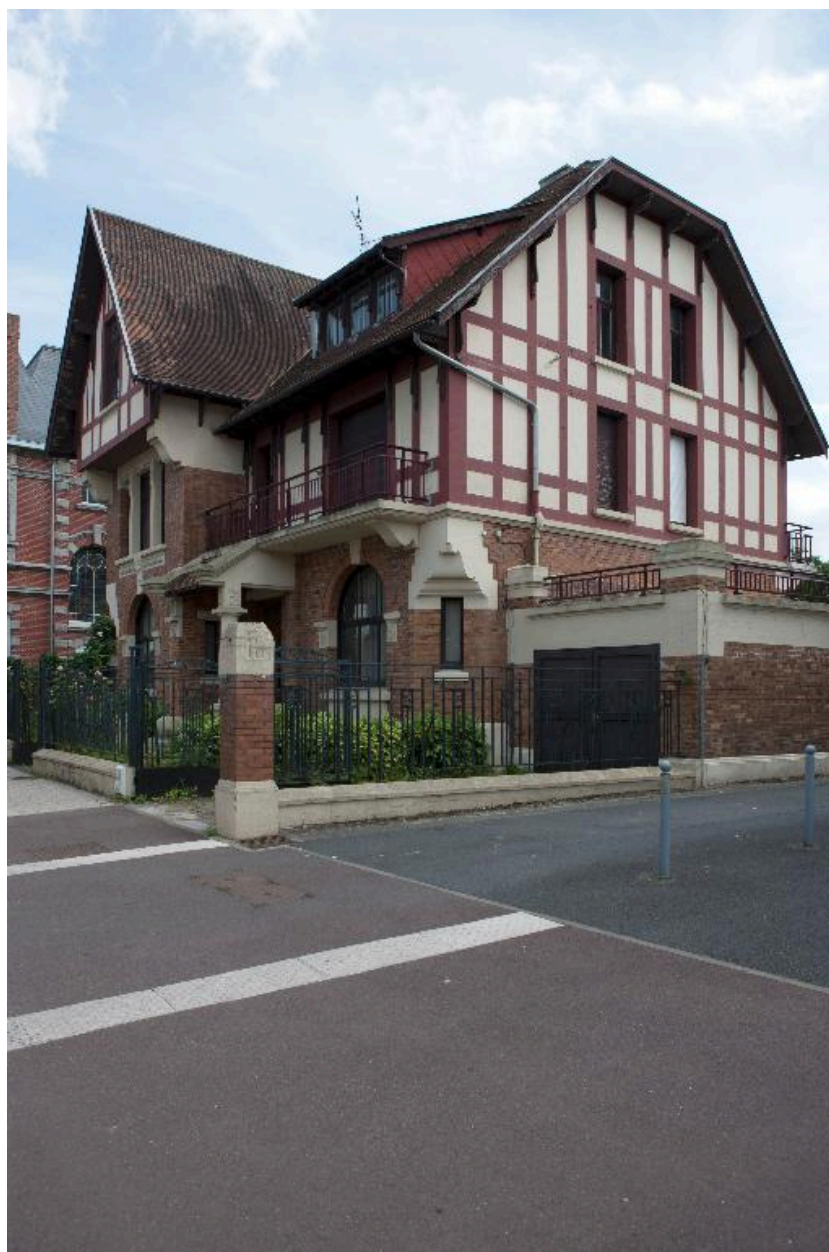
Maison patronale construite dans les années 1920 dans un style néo-normand, rue Mathieu-Dumoulin.