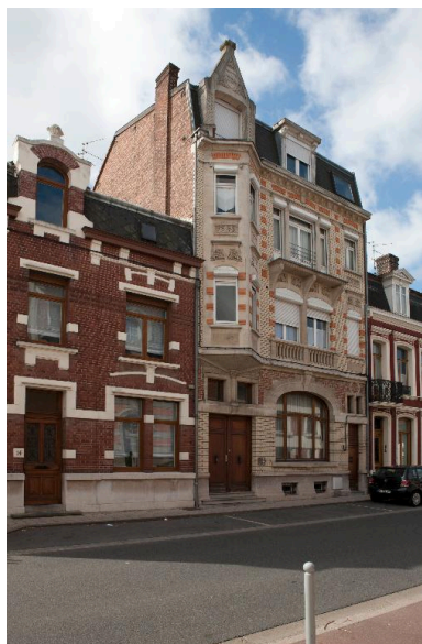
Immeuble construite dans les années 1910 de style éclectique, rue Mathieu-Dumoulin.