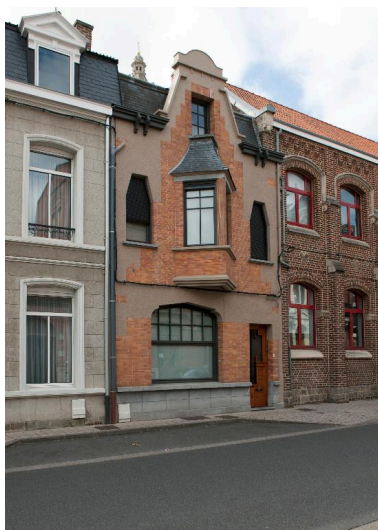
Maison datant des années 1920, 2 rue Mathieu-Dumoulin.