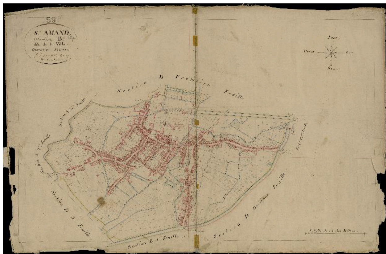
Cadastre de 1817, section B dite de la ville, feuille 2 (AD Nord, P31/627).