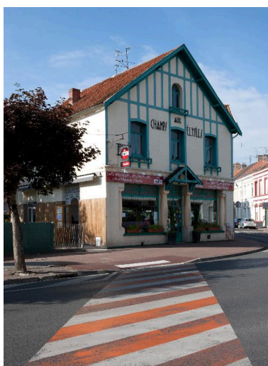
Café Aux Champs Elysées, 40 avenue du Clos, construit dans les années 1920.