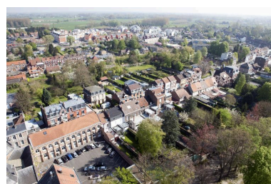
Vue générale de la rue Mathieu-Dumoulin et l'avenue du Clos, depuis la tour abbatiale.