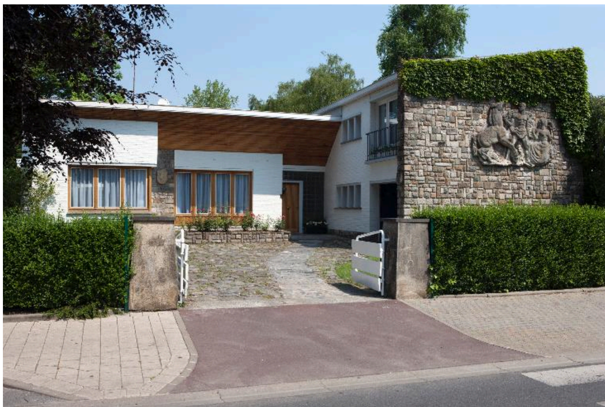
Maison datant des années 1960-70, rue Mathieu-Dumoulin.