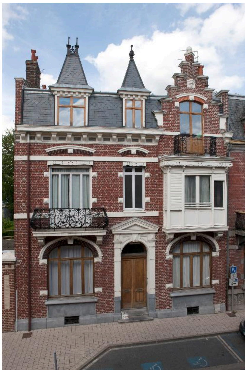
Maison patronale ou bourgeoise, rue Mathieu-Dumoulin.