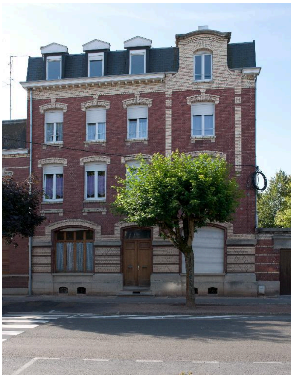
Immeuble, début XXe siècle (?), 6 avenue du Clos.