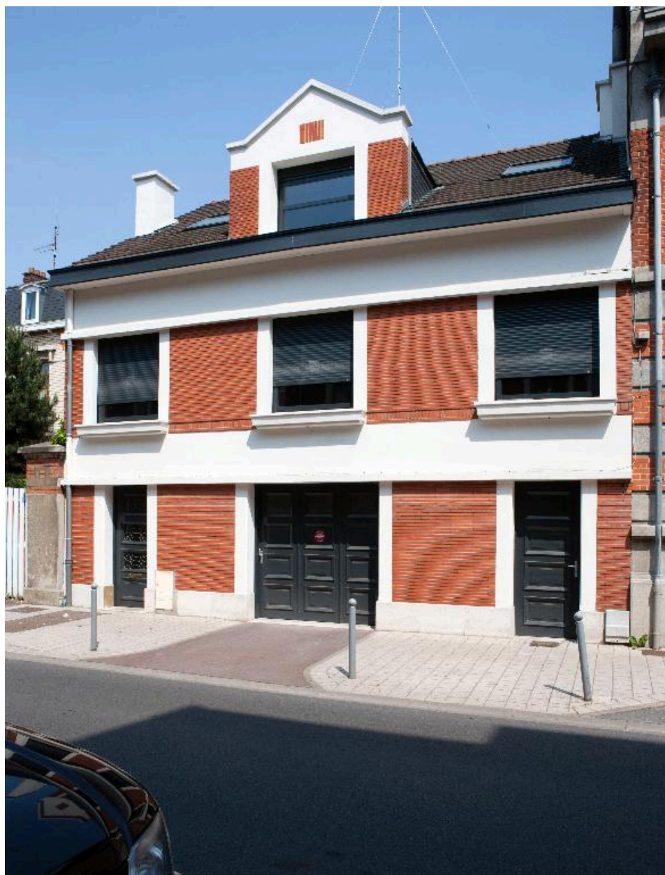
Maison construite dans les années 1940-50, rue Mathieu-Dumoulin.