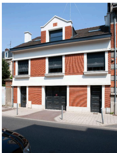
Maison construite dans les années 1940-50, rue Mathieu-Dumoulin.