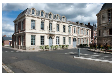
Ancienne maison bourgeoise intégrée dans l'actuel hôtel de ville, à l'angle de la rue Dumoulin et la Grand'Place.. IVR31_20125902062NUCA