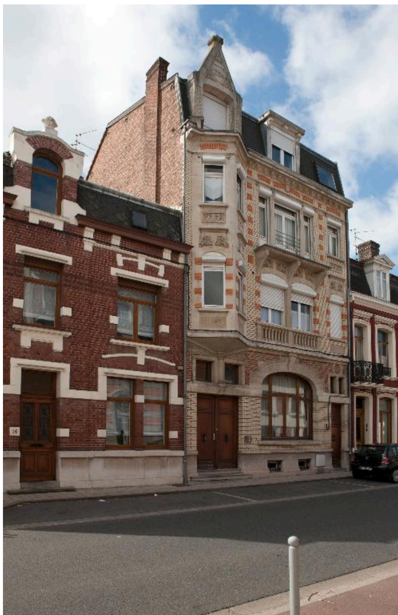
Maison construite dans les années 1920 d'inspiration de style Art-Déco, avenue du Clos.