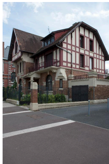
Maison patronale construite dans les années 1920 dans un style néo-normand, rue Mathieu-Dumoulin.