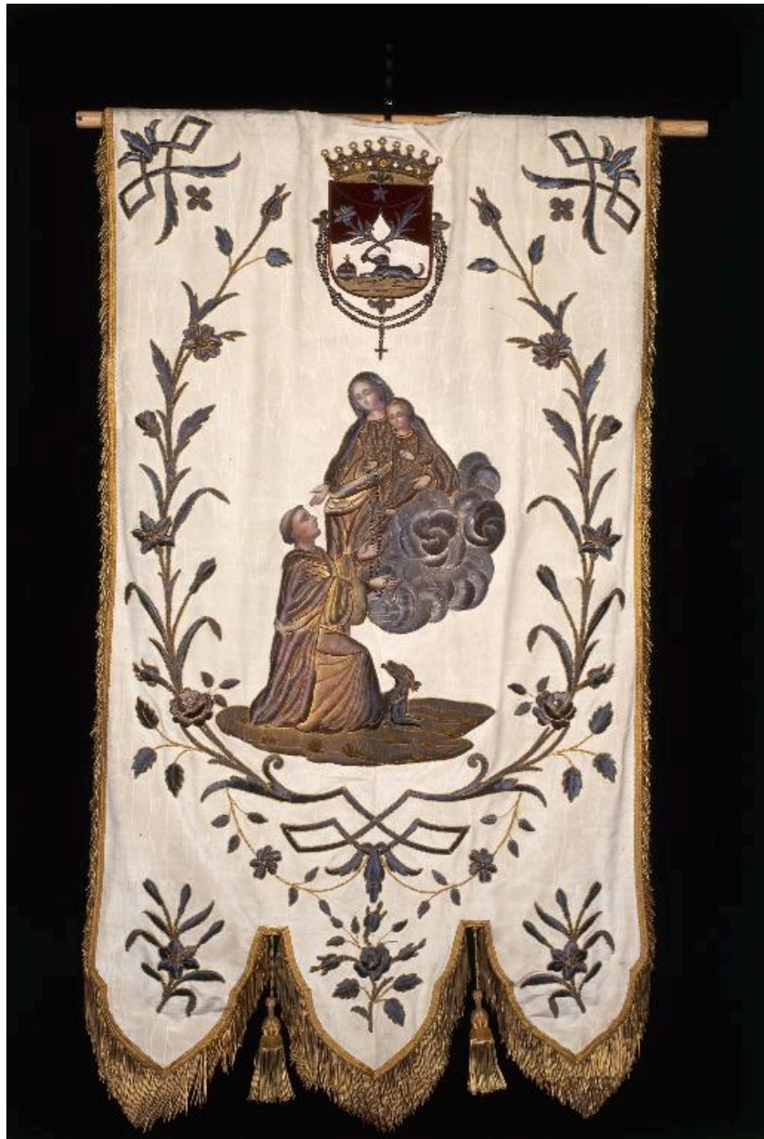
Vue d'ensemble, de face.