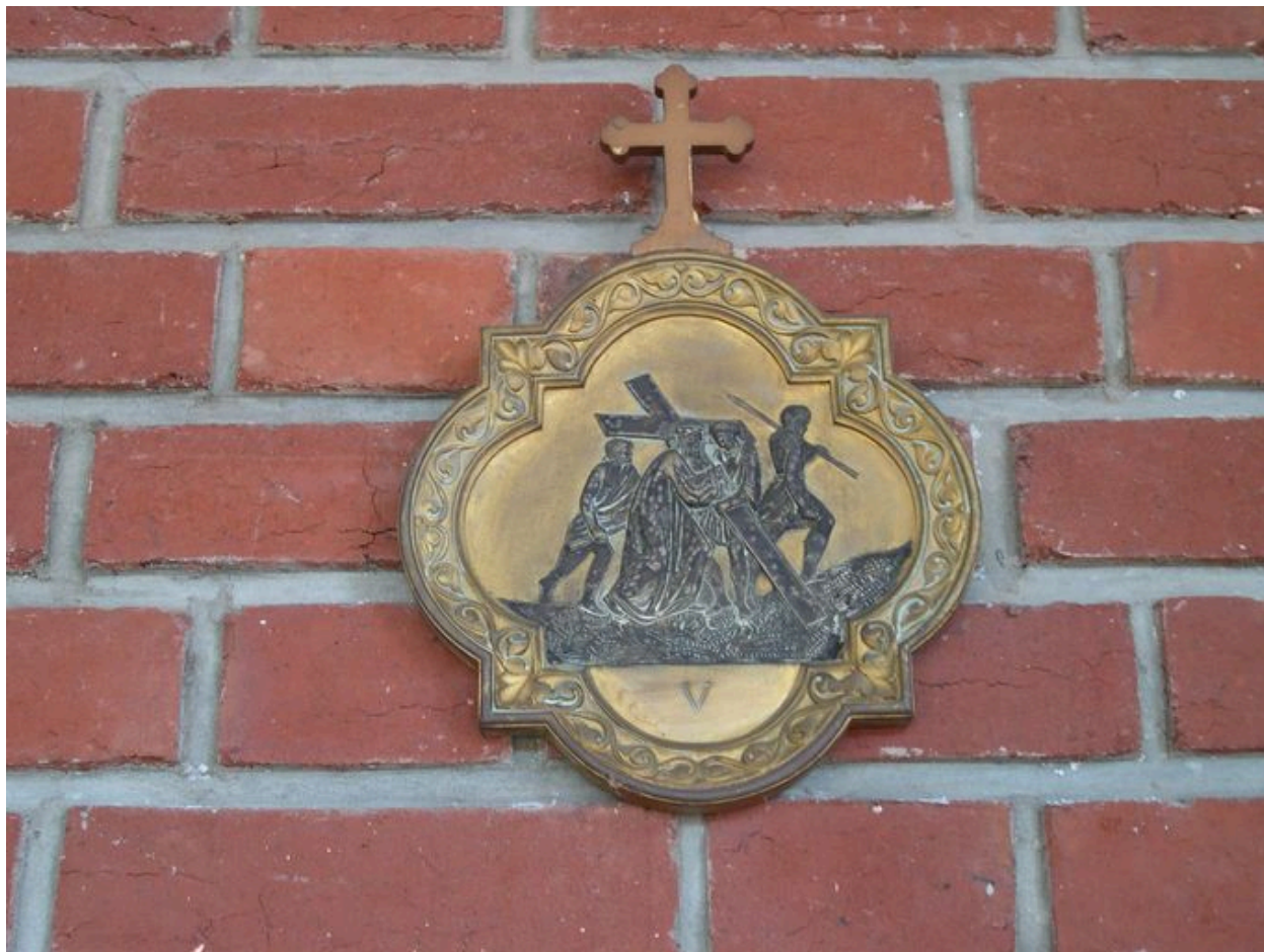
Une des stations du chemin de croix.