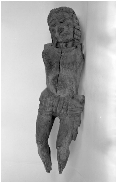
Vue d'ensemble. IVR22_19956000590X