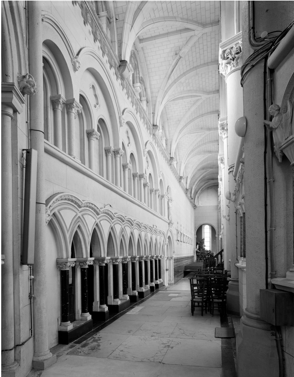
Vue d'ensemble du déambulatoire.