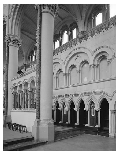
Vue d'ensemble de la nef. IVR22_19956200169V