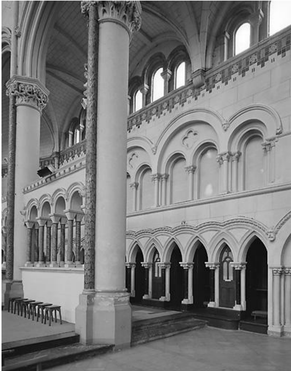
Vue d'ensemble de la nef.