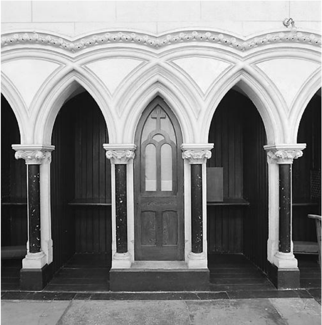
Elévation d'un élément.