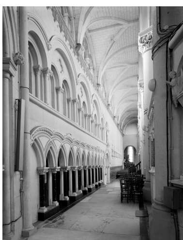
Vue d'ensemble du déambulatoire.