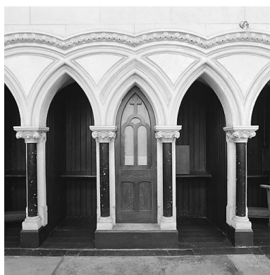
Elévation d'un élément.