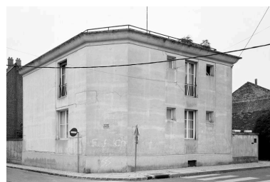
Elévation sur rue. Angle. IVR22_19856001366X