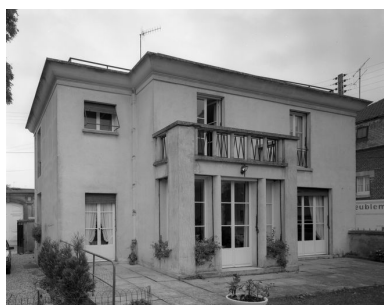
Elévation postérieure. IVR22_19856001432V