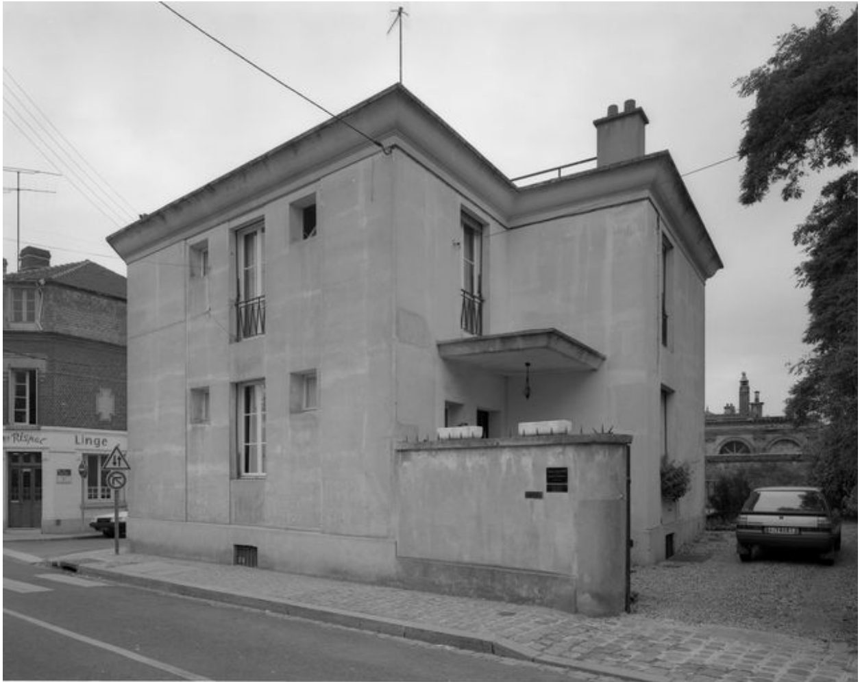
Elévation sur rue.