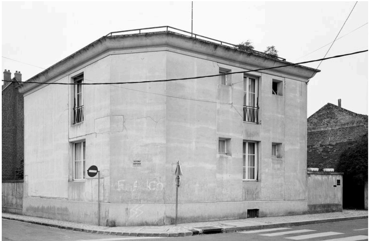
Elévation sur rue. Angle.