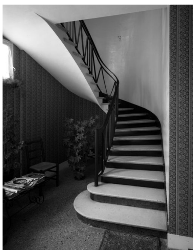
Escalier.