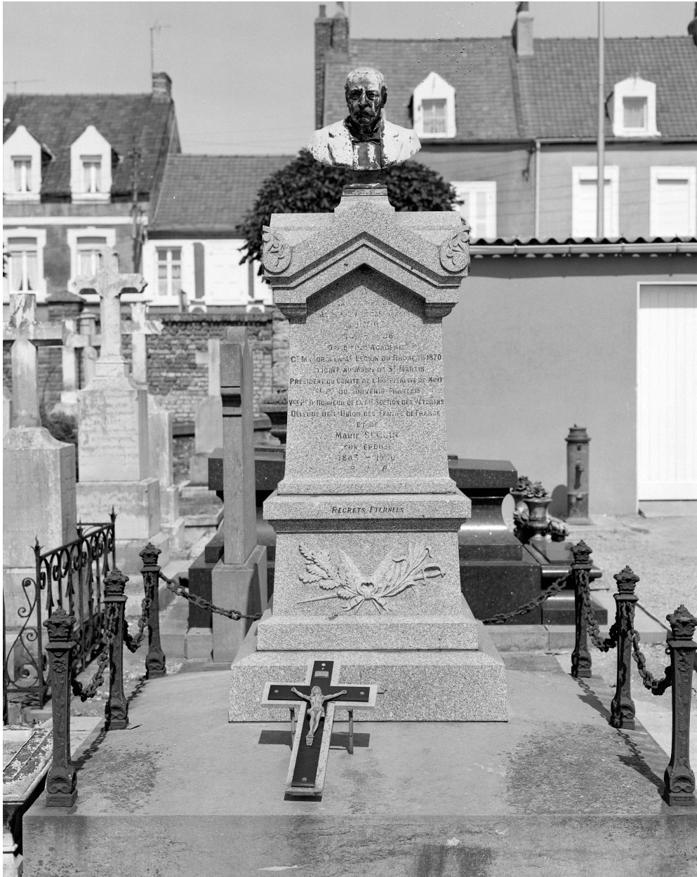
Tombeau d'Adolphe-Amédée-Benoît Gonard. Vue générale.