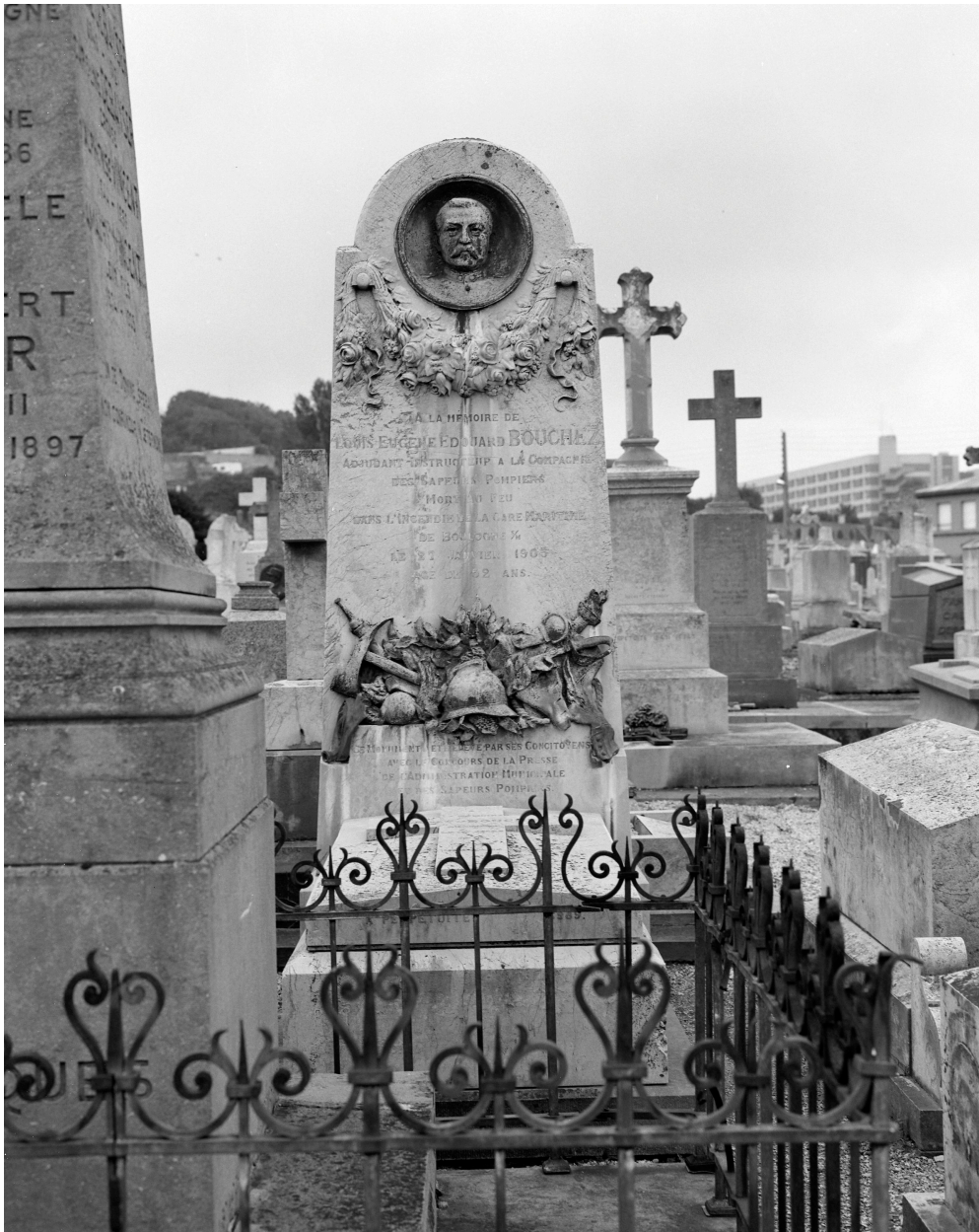
Tombeau de Louis-Eugène-Édouard Bouchez. Vue générale.