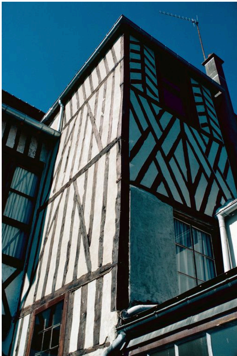
Elévation postérieure : détail de l'escalier hors-oeuvre.