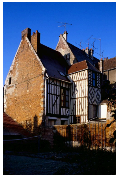
Elévation postérieure.