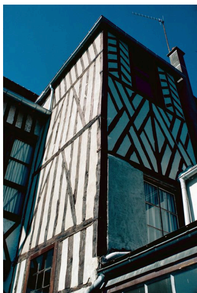
Elévation postérieure : détail de l'escalier hors-oeuvre. IVR22_19856001336ZA