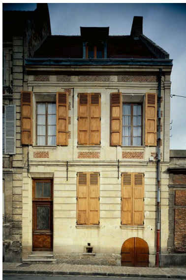
Elévation antérieure.