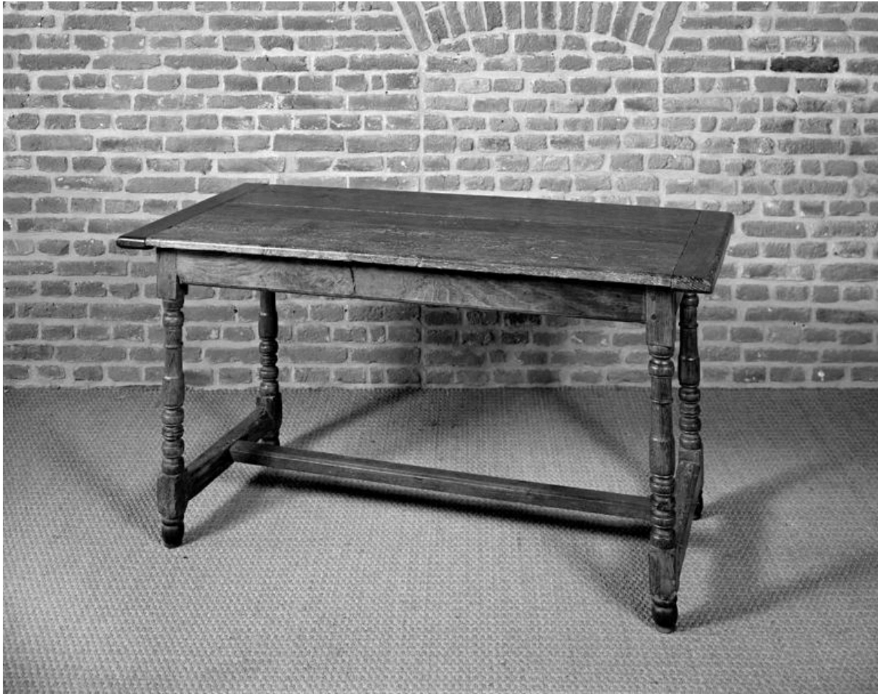
Vue de la table.