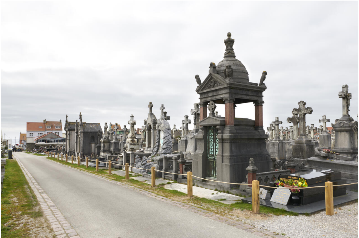
Vue sur la chapelle dite des Hiboux et sur la division 13.