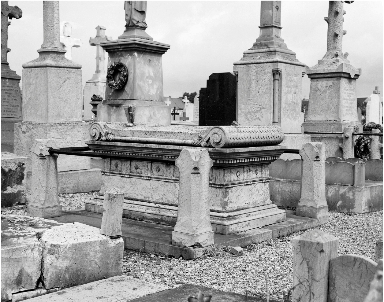
Tombeau de la famille Hesdin-Maréchal.