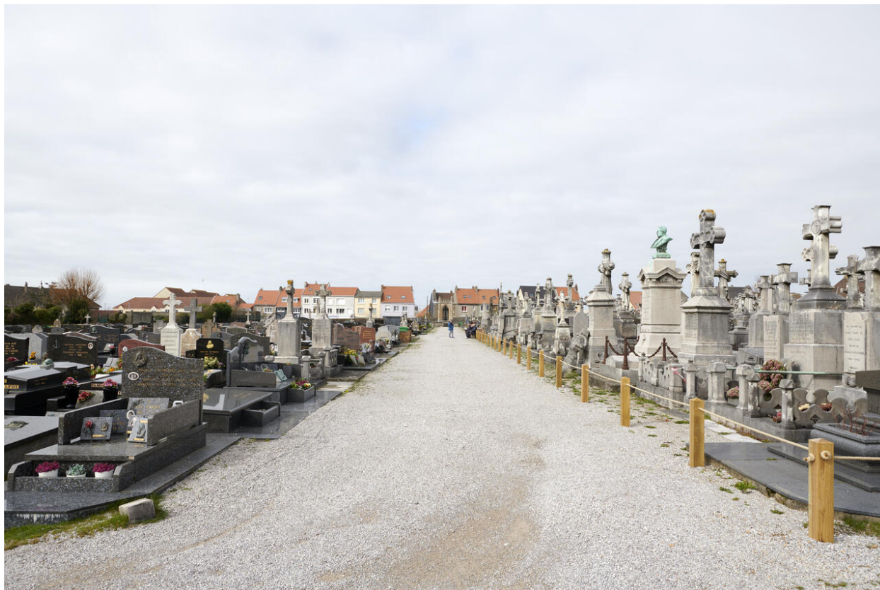
Vue de l'allée vers la chapelle des prêtres.