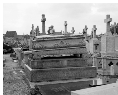
Tombeau de la famille Corbec-Fourny. IVR31_19816203452X