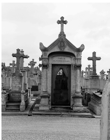
Chapelle funéraire de la famille Delpierre-Duhamel. IVR31_19816203330X