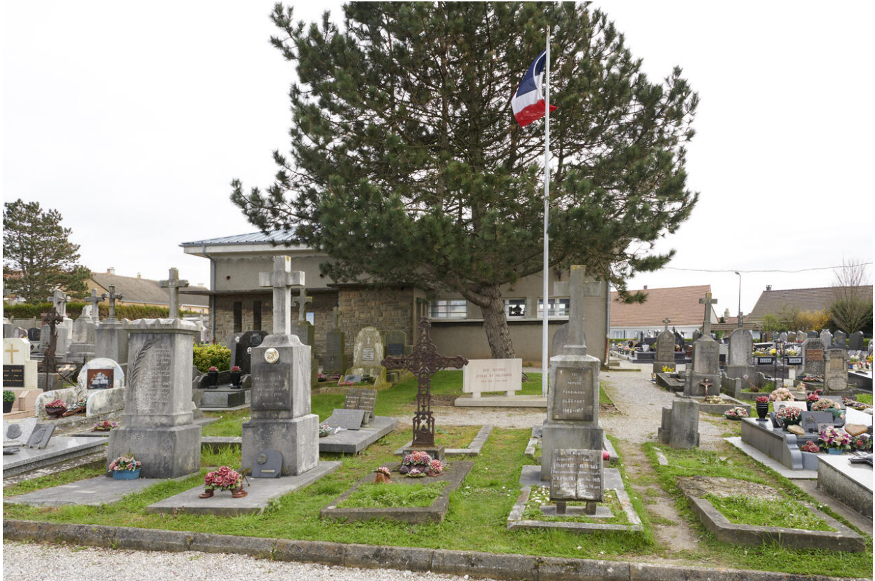
Vue de la division où reposent les victimes civiles et militaires des deux guerres mondiales.