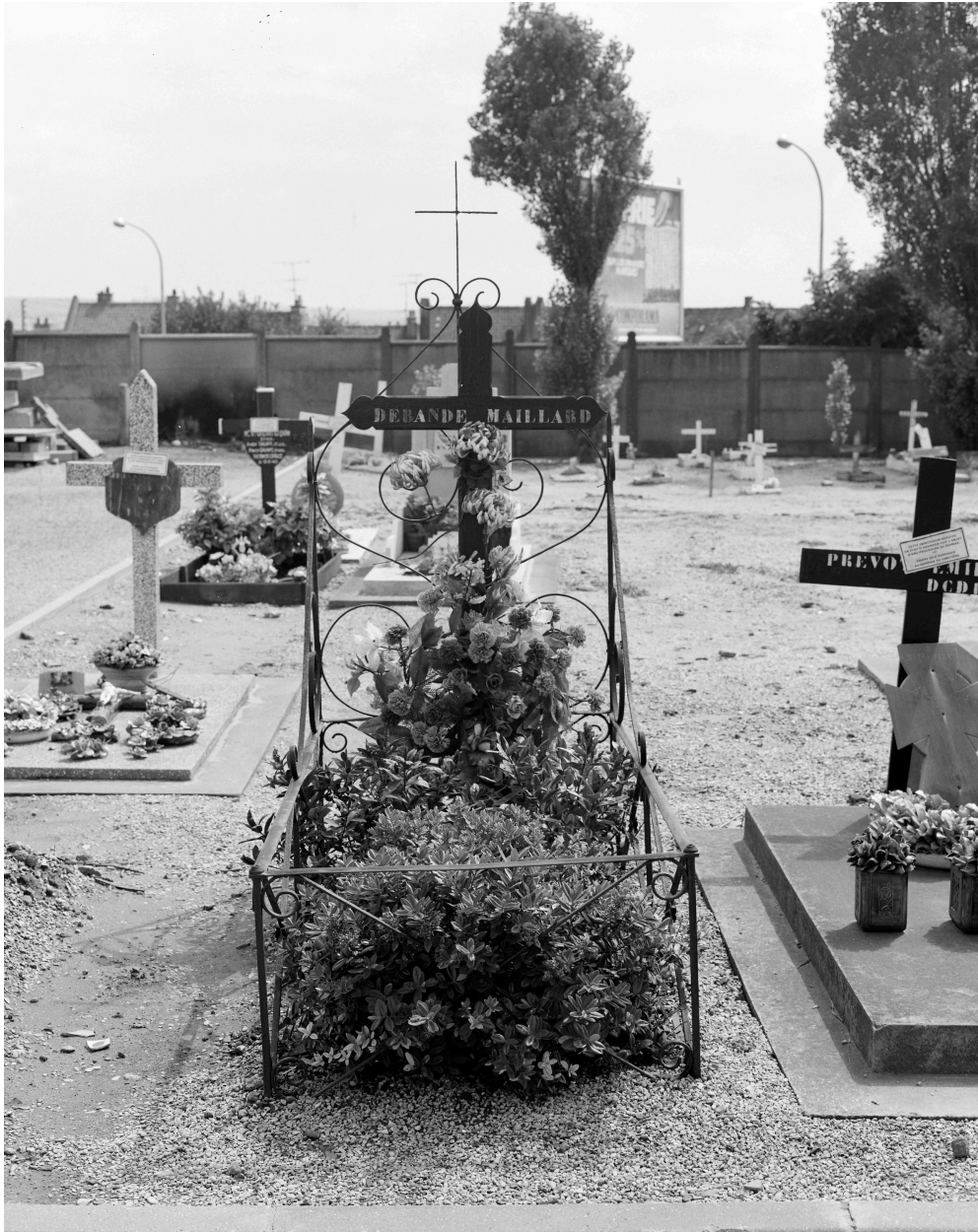
Tombeau de la famille Debande-Maillard. Enclos en fer forgé.