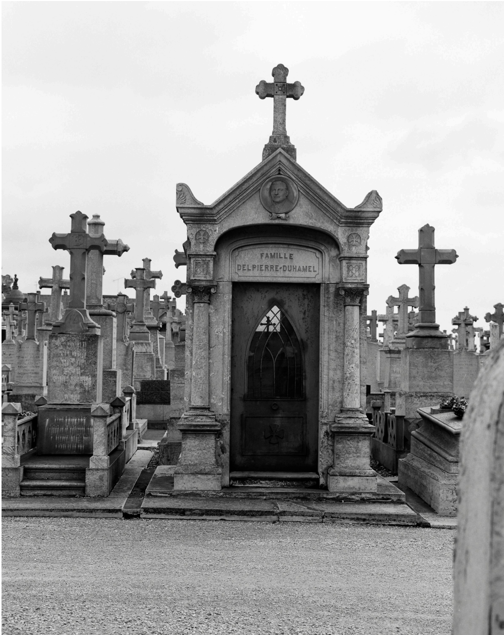
Chapelle funéraire de la famille Delpierre-Duhamel.