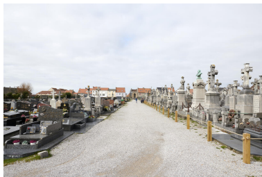
Vue de l'allée vers la chapelle des prêtres. IVR32_20246200076NUCA