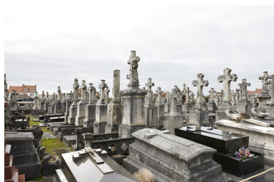
Vue de détail de la division 13. IVR32_20246200082NUCA