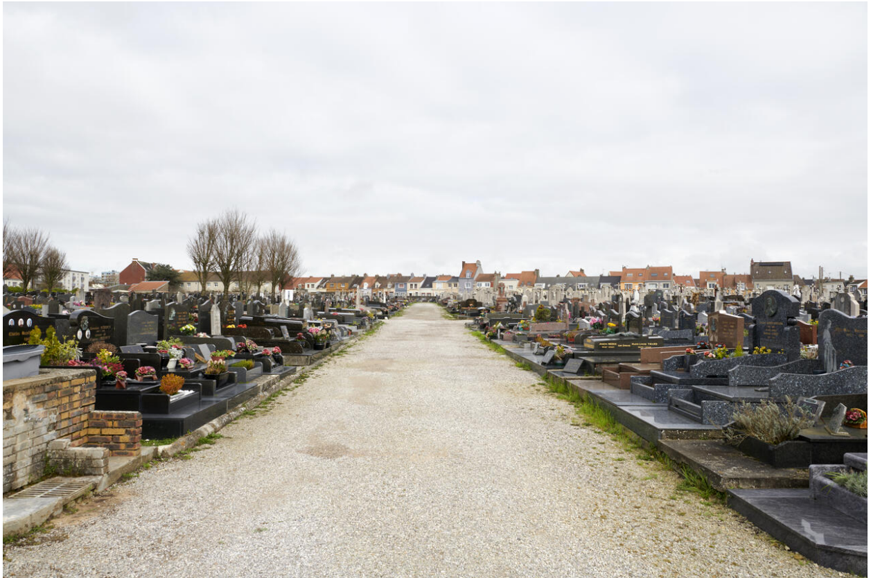
Vue d'une allée depuis l'entrée rue du Chemin vert.