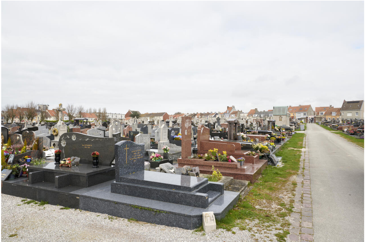
Vue de la division 14.