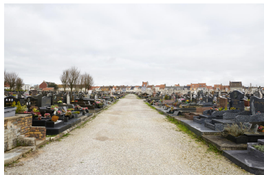
Vue d'une allée depuis l'entrée rue du Chemin vert.