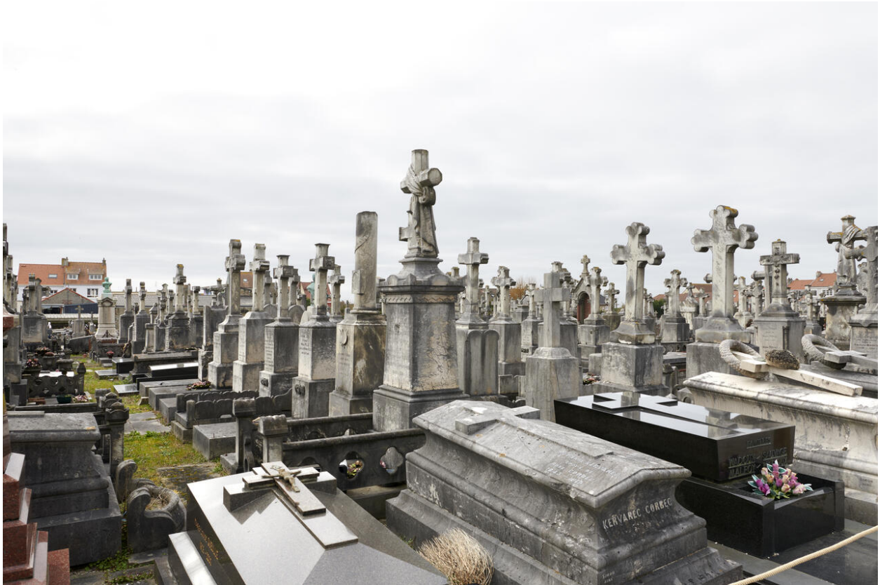
Vue de détail de la division 13.