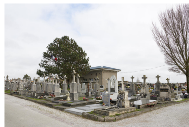
Vue de la division où reposent les victimes civiles et militaires des deux guerres mondiales.