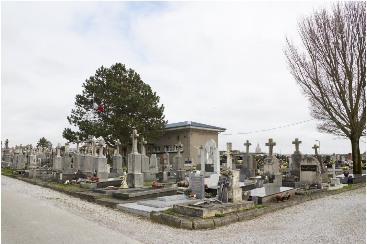
Vue de la division où reposent les victimes civiles et militaires des deux guerres mondiales.