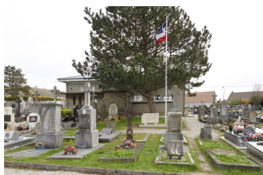
Vue de la division où reposent les victimes civiles et militaires des deux guerres mondiales. IVR32_20246200078NUCA