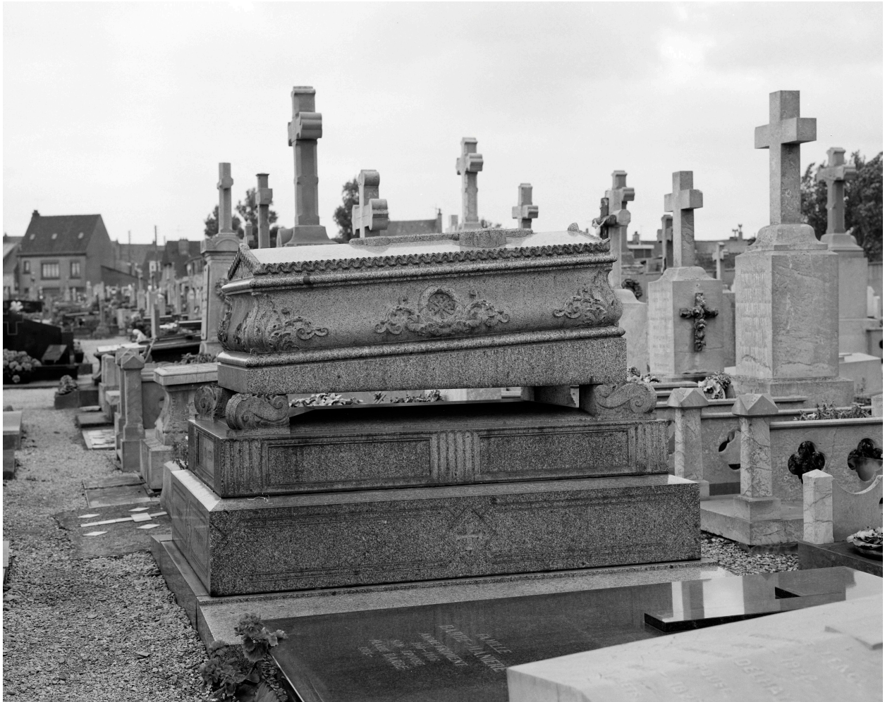
Tombeau de la famille Corbec-Fourny.