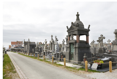
Vue sur la chapelle dite des Hiboux et sur la division 13. IVR32_20246200079NUCA