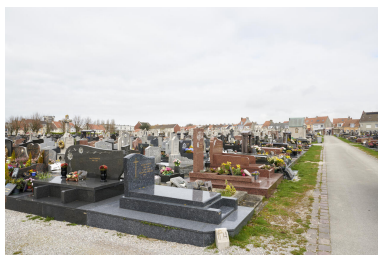
Vue de la division 14.