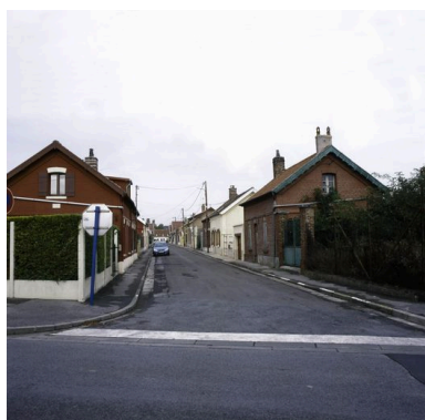
Vue générale. IVR22_20038001080XA