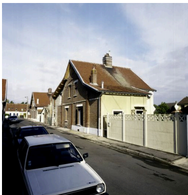
16 et 18 rue Saint-Pierre, maisons construites en 1922 ou 1923.