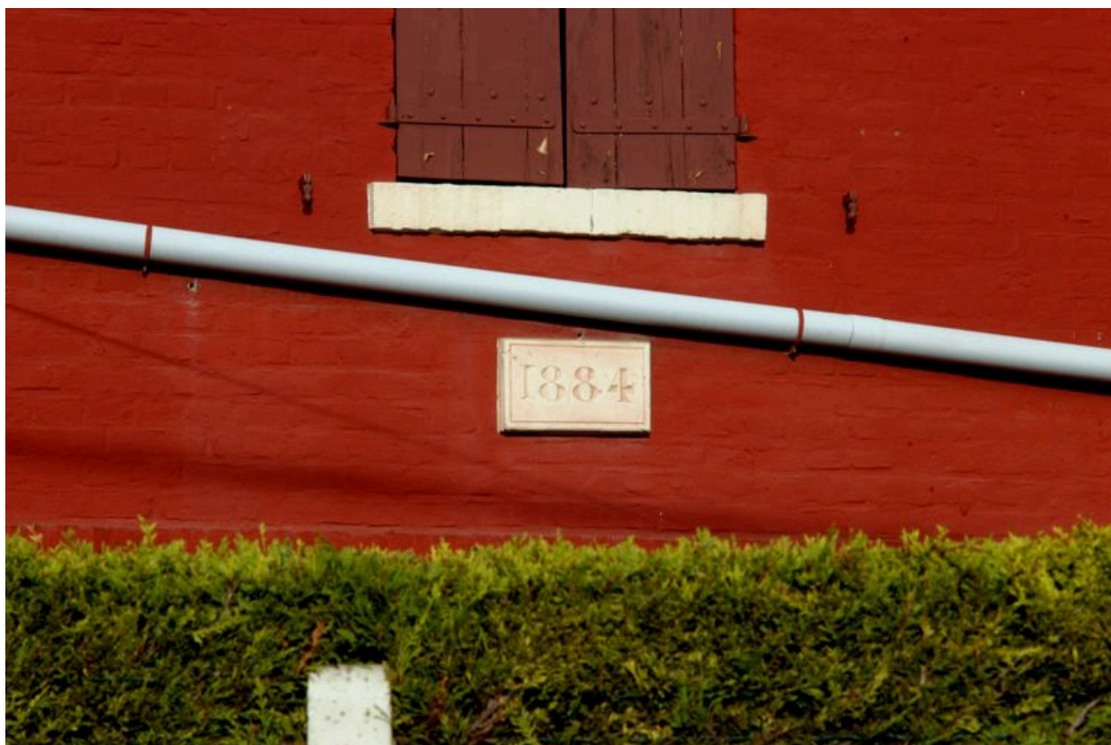
1 rue Saint-Pierre, vue de détail sur la date portée sur la maison.