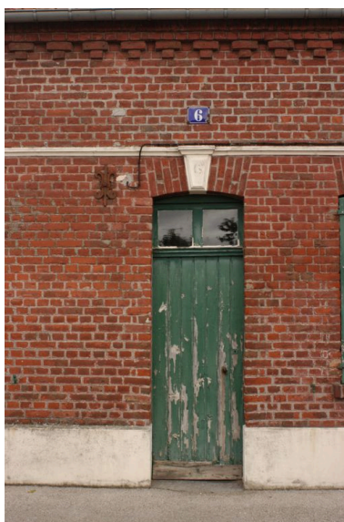
6 rue Saint-Pierre, vue de détail sur la porte du logement. IVR22_20038001012NUCA