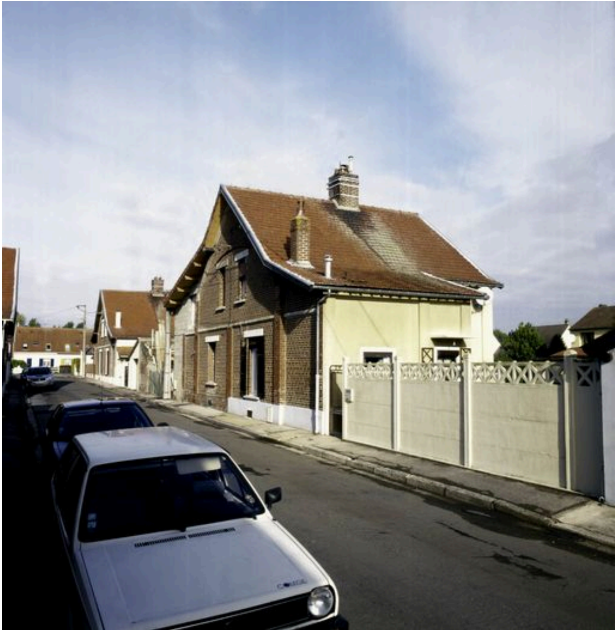
16 et 18 rue Saint-Pierre, maisons construites en 1922 ou 1923.