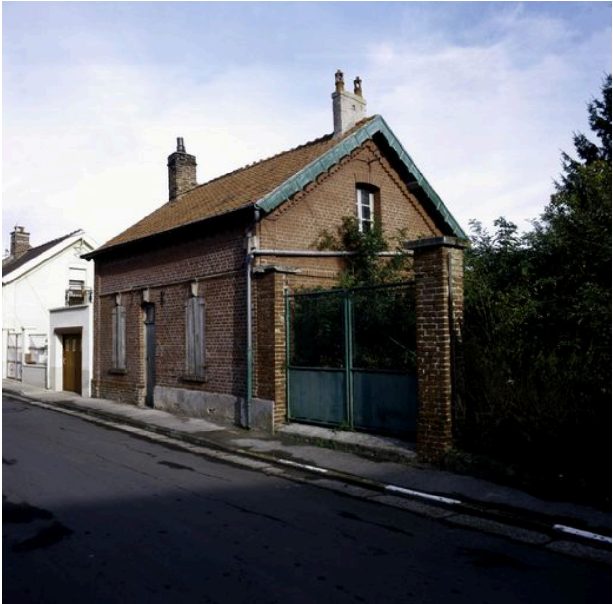
2 rue Saint-Pierre, maison construite en 1884.