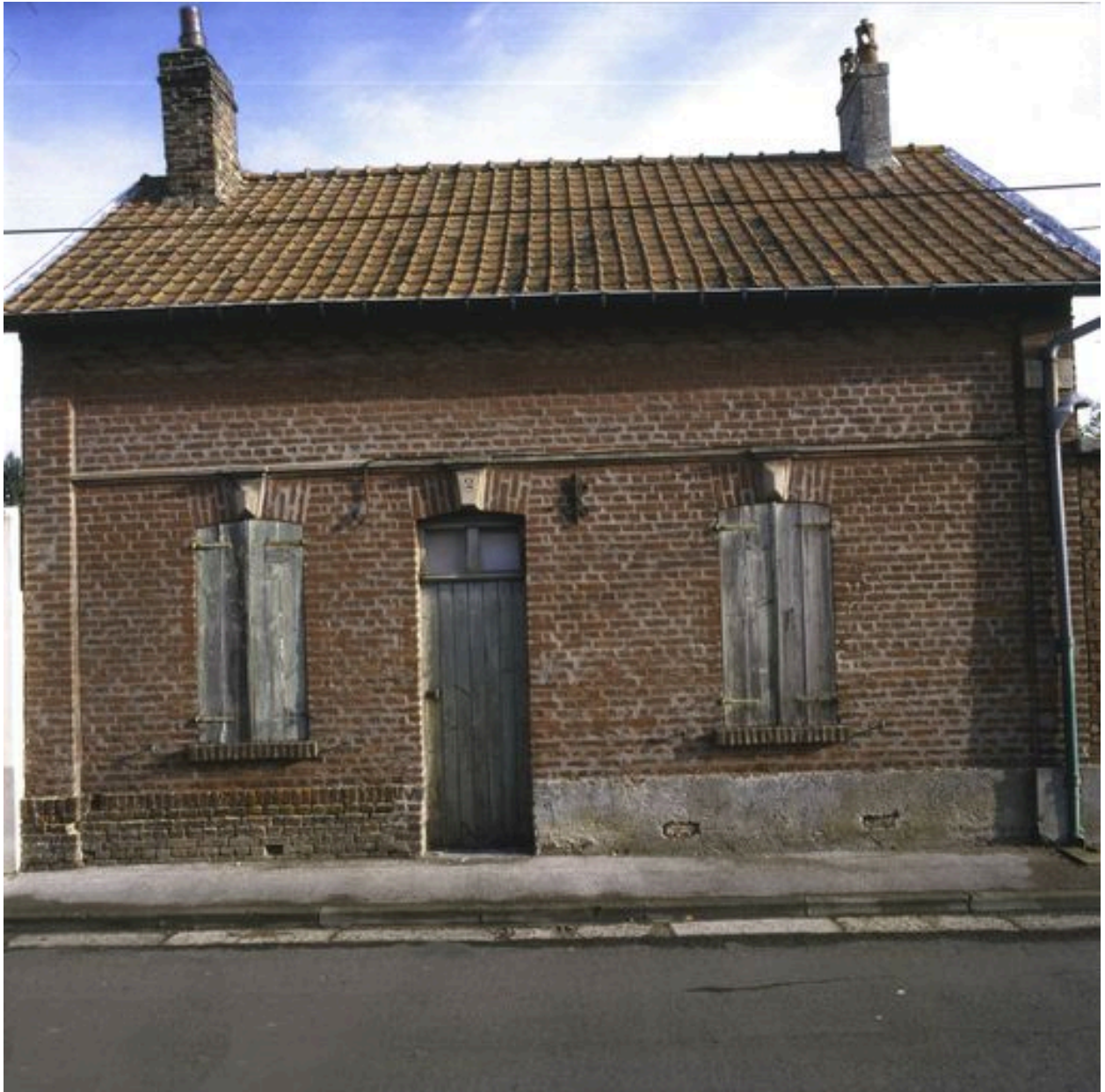
2 rue Saint-Pierre, vue de la façade antérieure du logement.