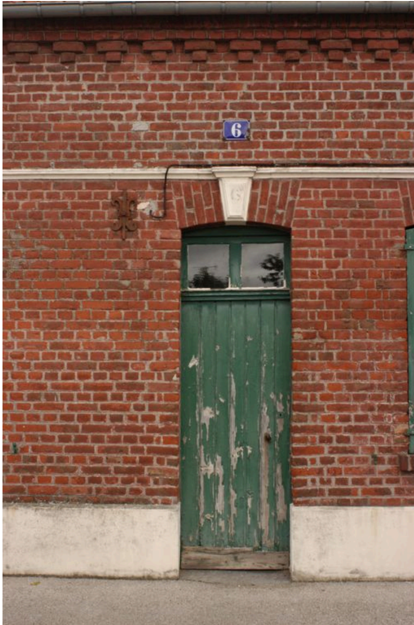
6 rue Saint-Pierre, vue de détail sur la porte du logement.