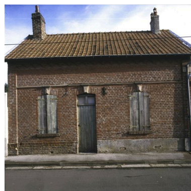
2 rue Saint-Pierre, vue de la façade antérieure du logement.