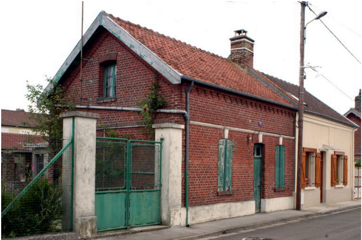
4 et 6 rue Saint-Pierre, maisons construites en 1884.