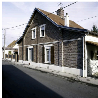
20 et 22 rue Saint-Pierre, maisons construites en 1922 ou 1923.