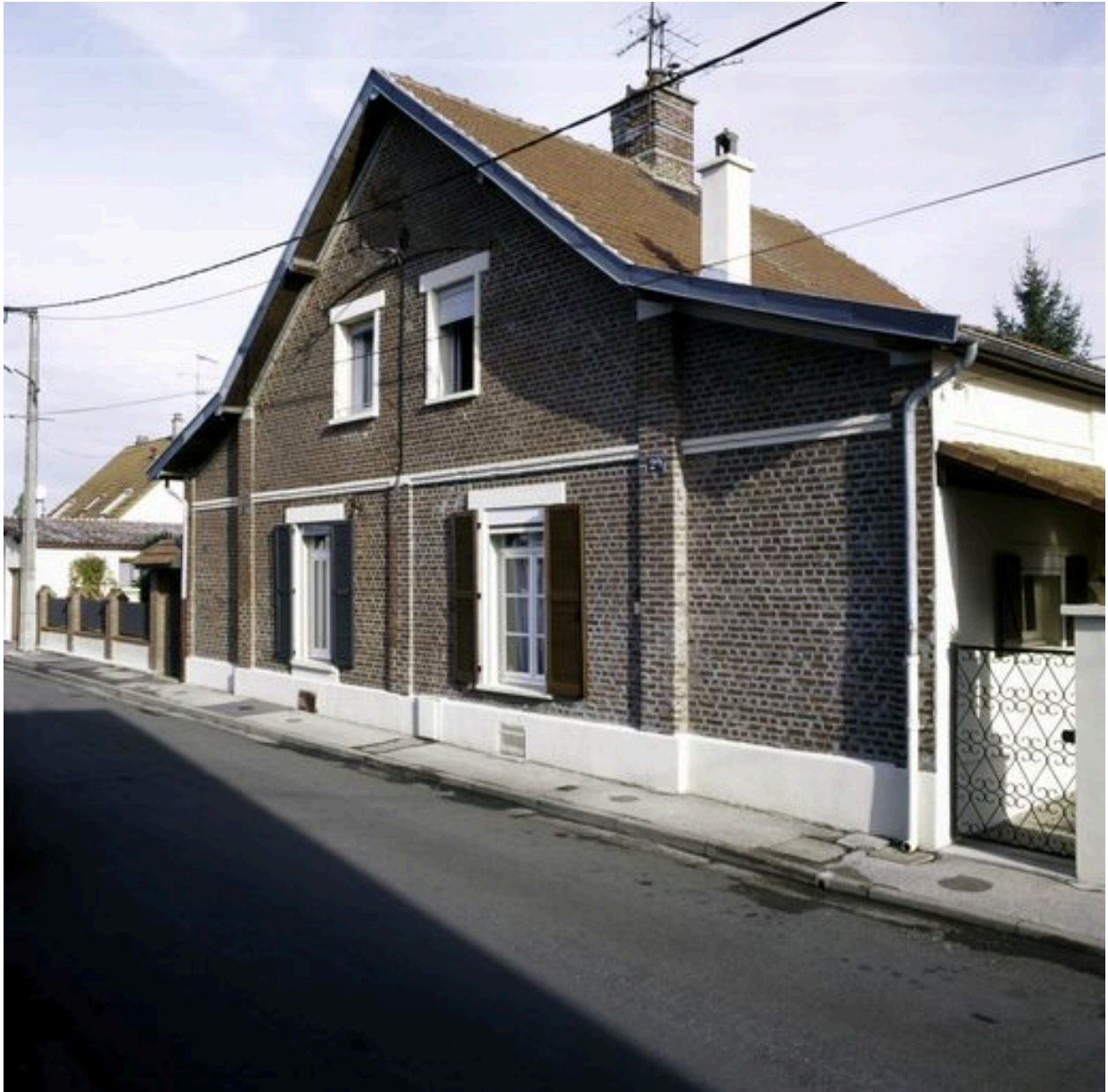
20 et 22 rue Saint-Pierre, maisons construites en 1922 ou 1923.