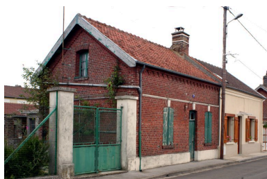
4 et 6 rue Saint-Pierre, maisons construites en 1884. IVR22_20038001011NUCA