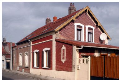
12 et 14 rue Saint-Pierre, maison construite vers 1918.