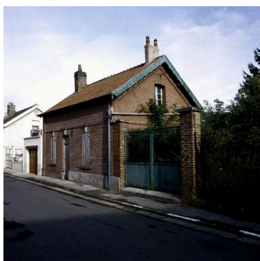
2 rue Saint-Pierre, maison construite en 1884.