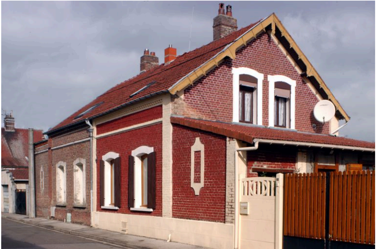
12 et 14 rue Saint-Pierre, maison construite vers 1918.