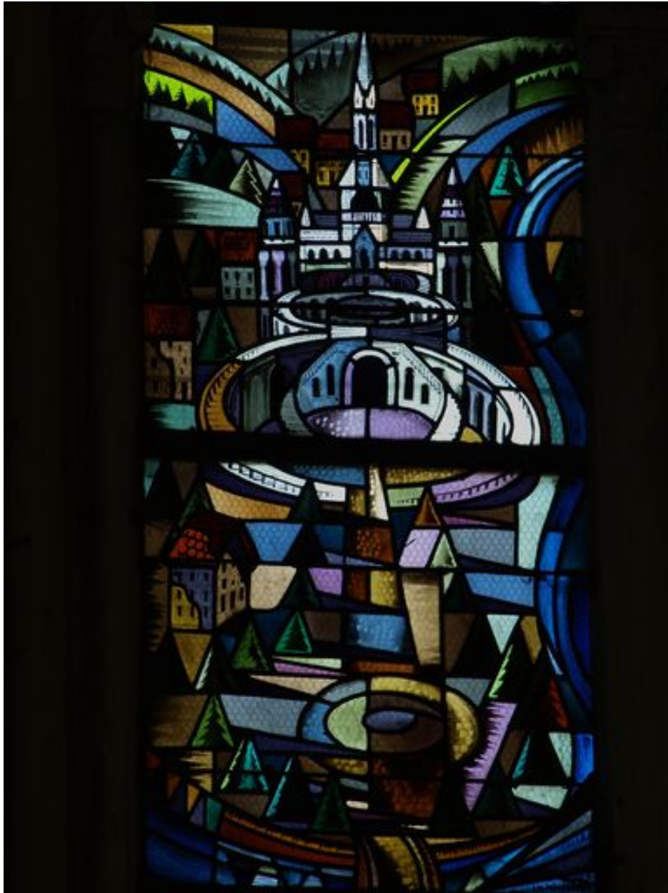
Détail de la lancette dextre : Jérusalem ?