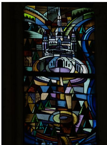
Détail de la lancette dextre : Jérusalem ?