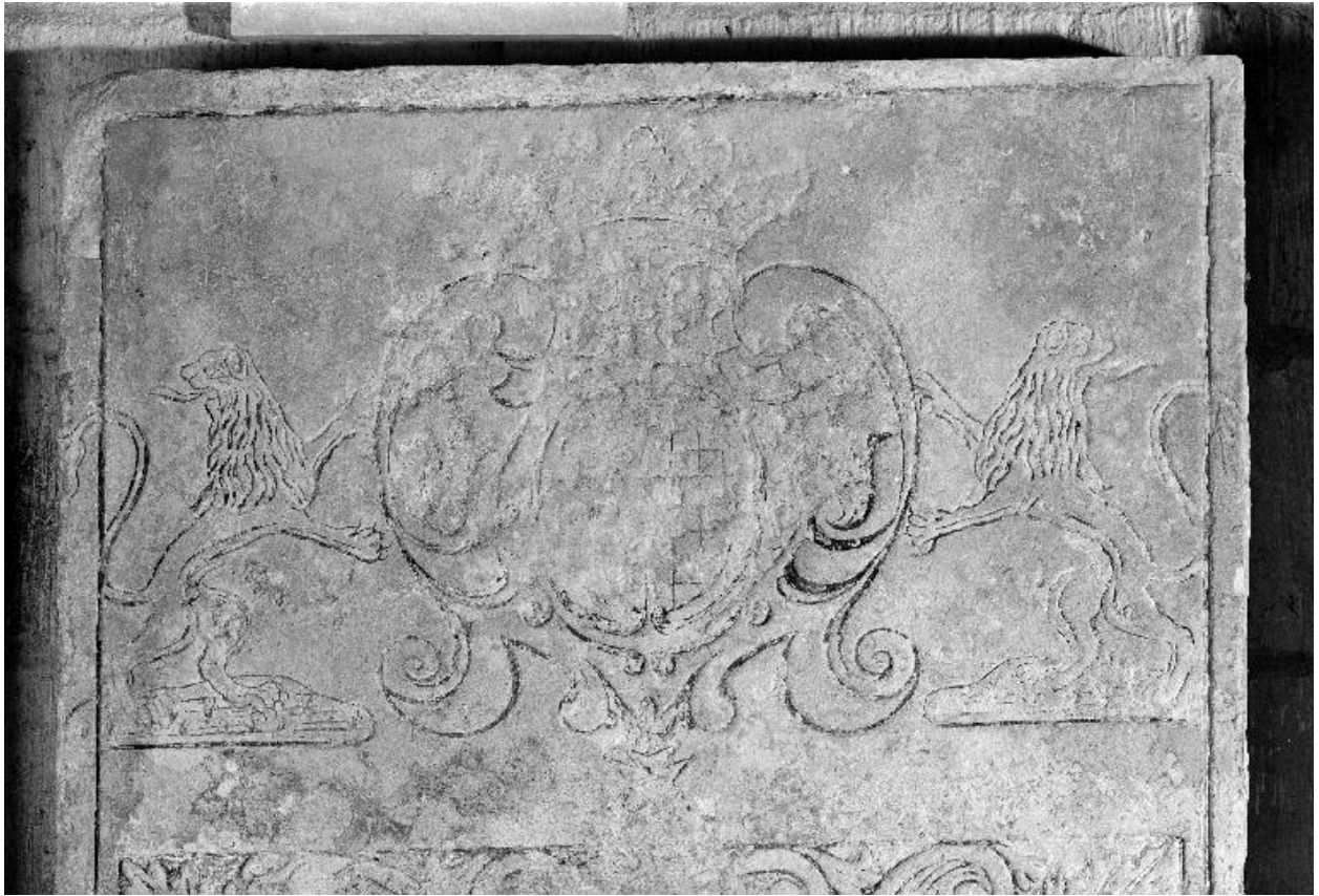
Détail de la partie supérieure : armoiries de Louis Le Prévost du Barail.