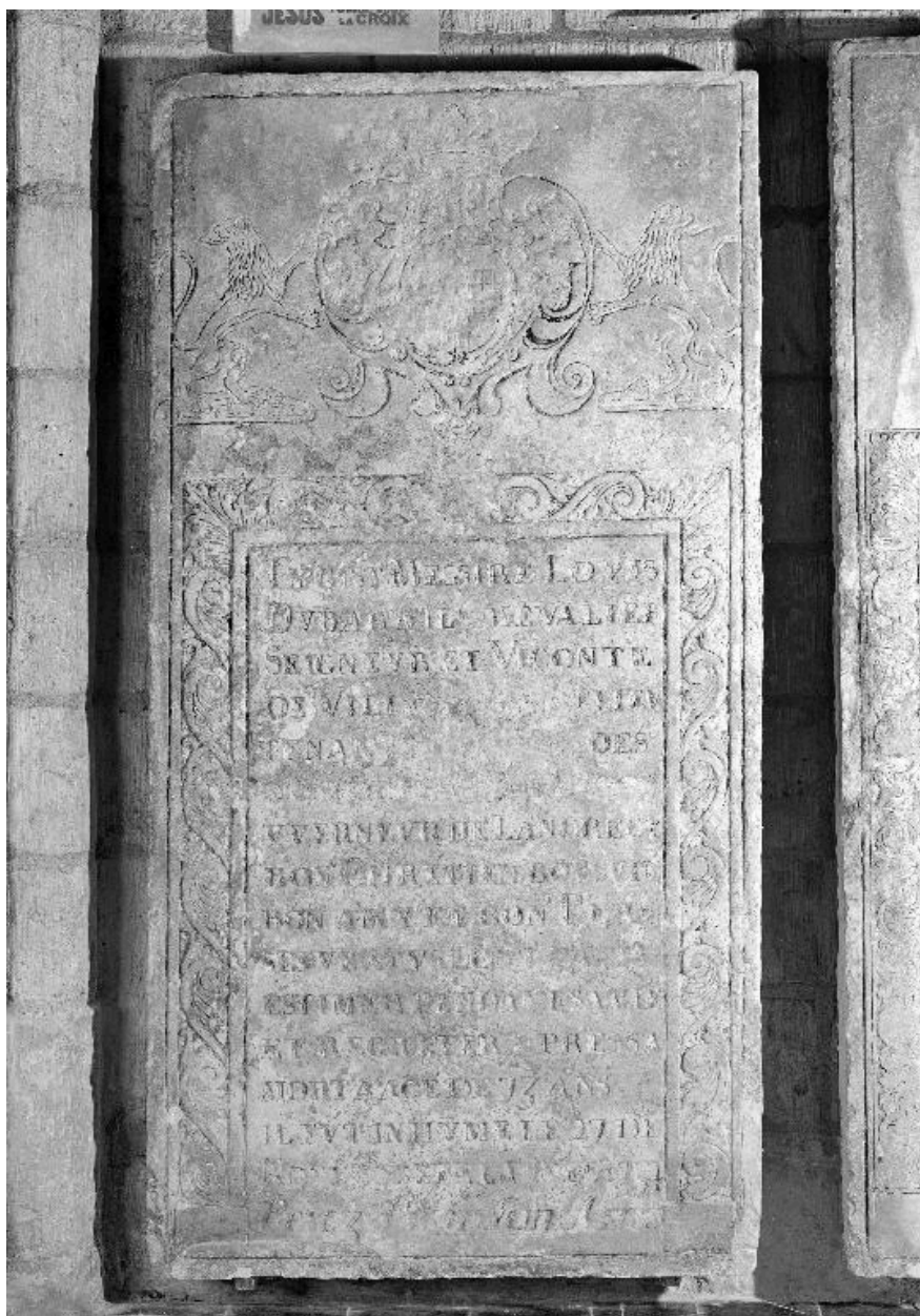
Vue générale de la dalle.