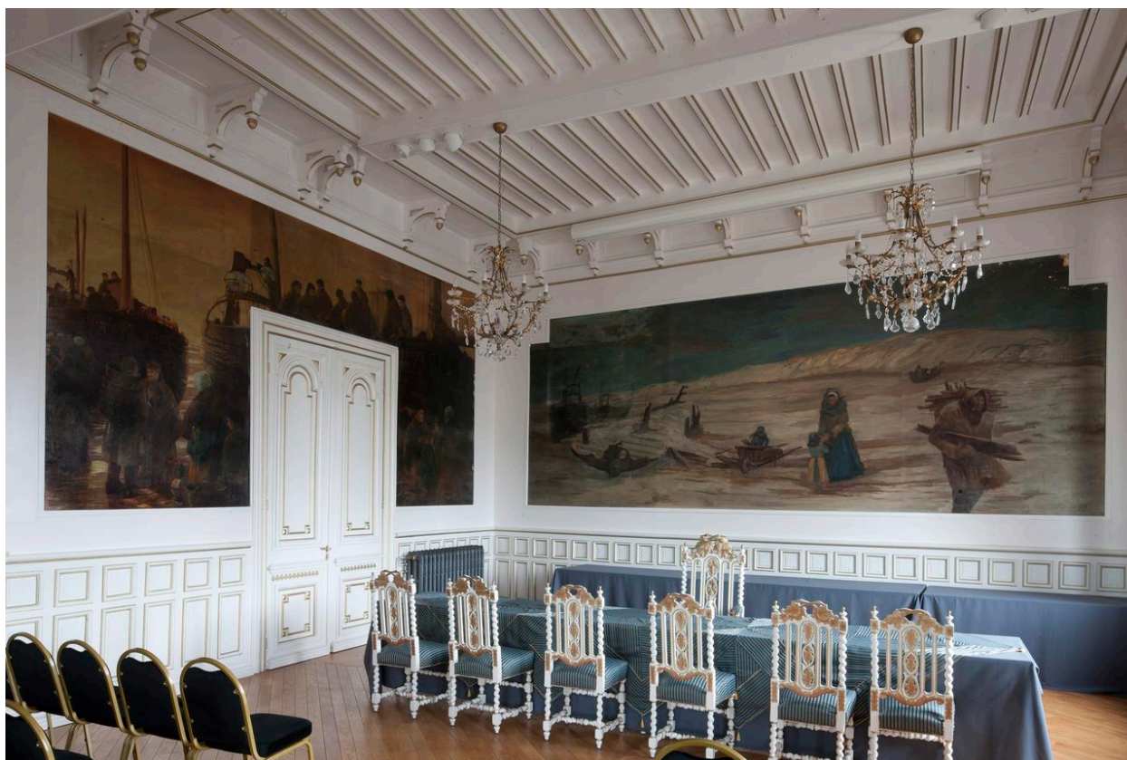
Les toiles "Les ramasseurs d'épaves" et "Le départ pour la pêche".