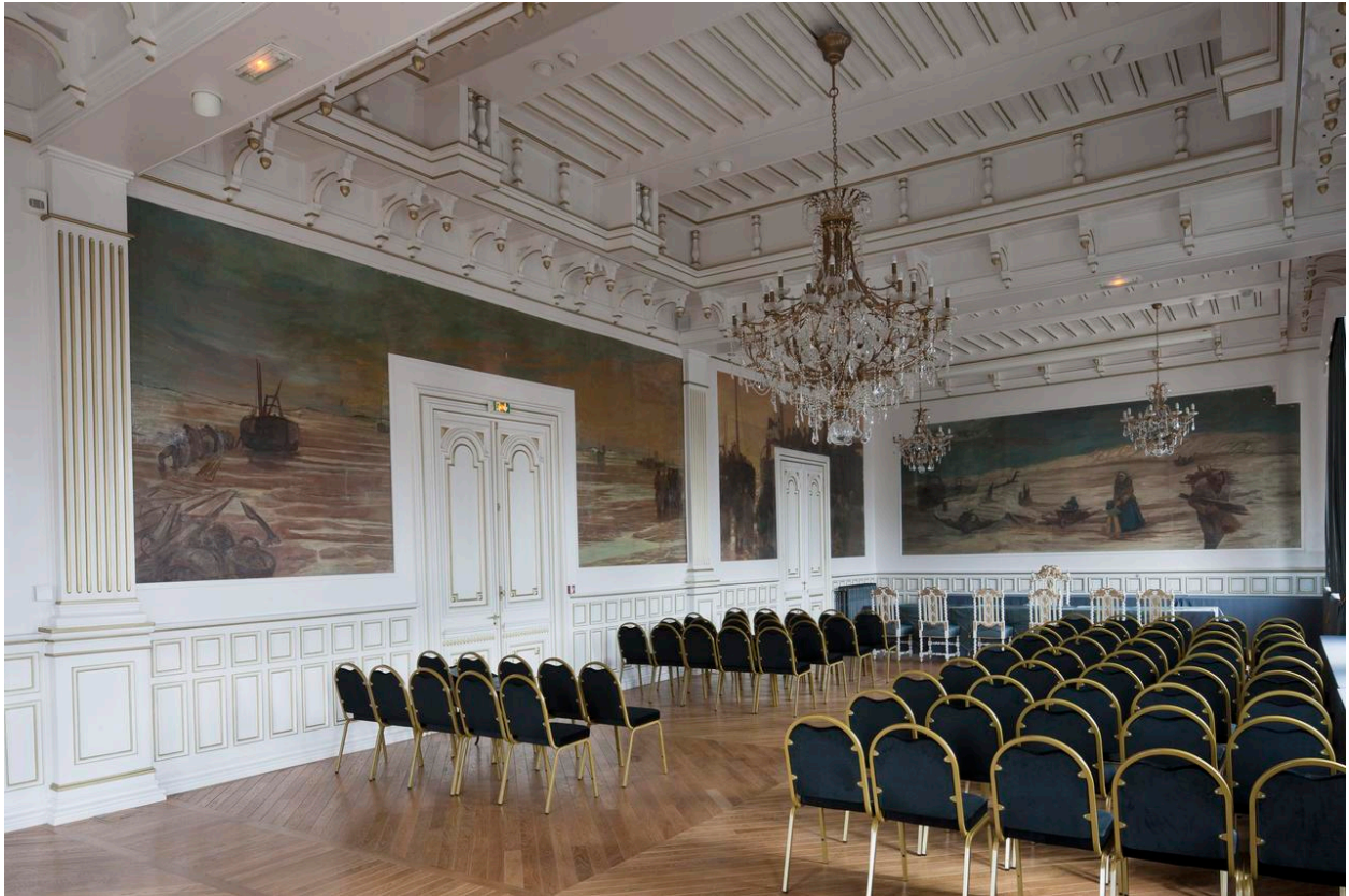
Vue générale du salon d'honneur.