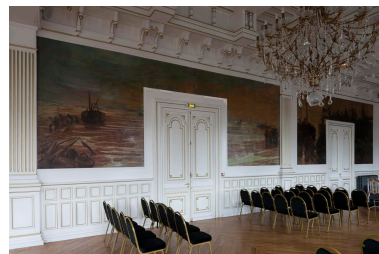
La toile "Pêcheurs sur la plage et mise à l'eau d'un bateau".