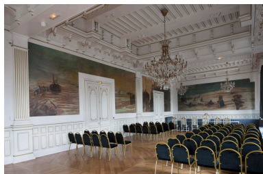
Vue générale du salon d'honneur.