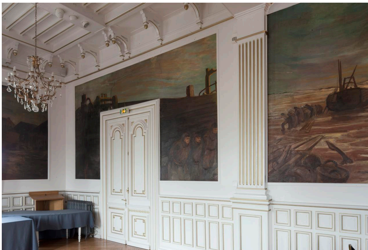
La toile "Chantier de construction d'un bateau".