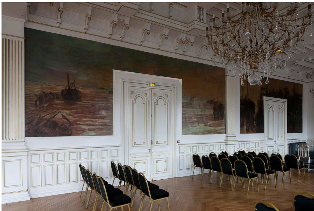
La toile "Pêcheurs sur la plage et mise à l'eau d'un bateau".