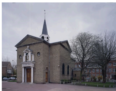
Vue générale. IVR31_19945901017VA