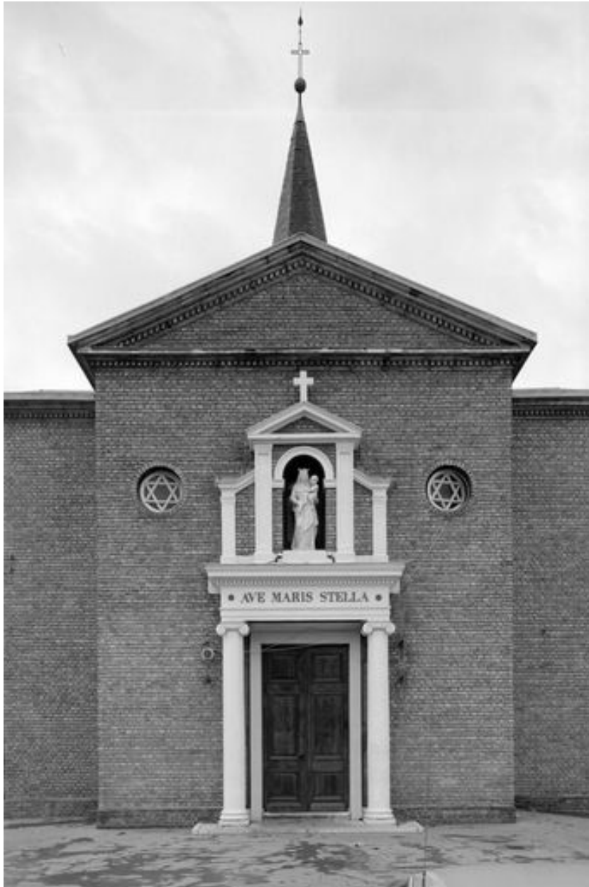
Vue générale de la façade nord.