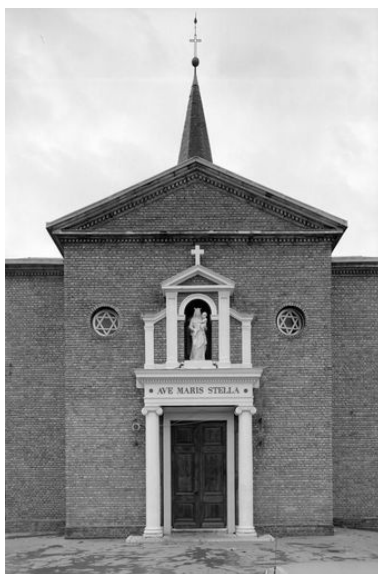
Vue générale de la façade nord.