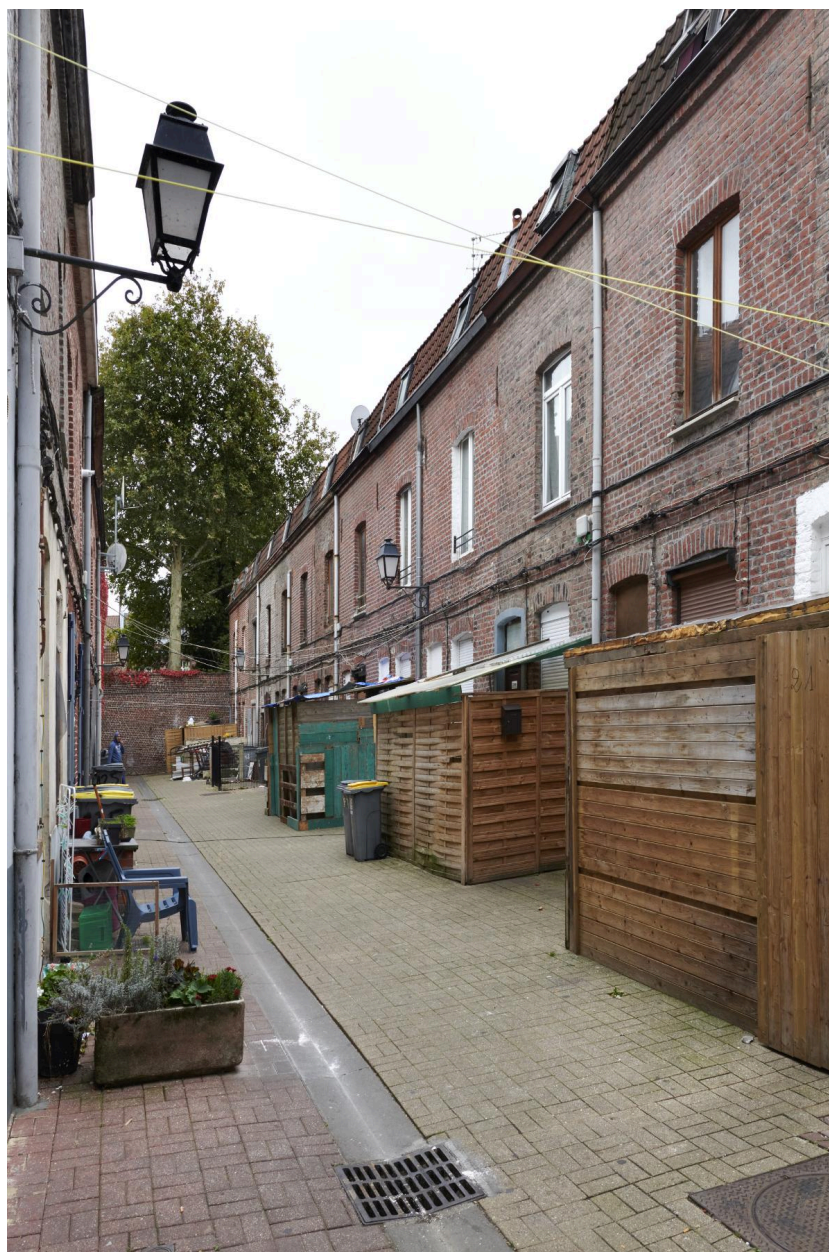
Rang de maisons côté nord, vue de côté.