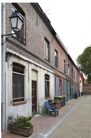
Rang de maisons côté sud, vue de côté.