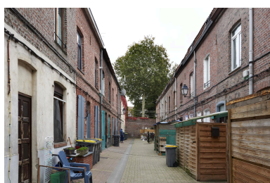
Vue générale de la courée. IVR32_20265900138NUCA