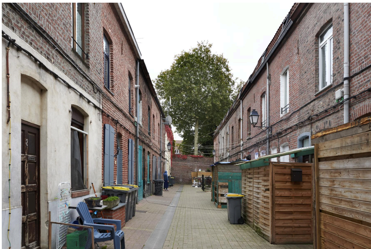
Vue générale de la courée.