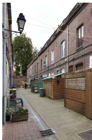
Rang de maisons côté nord, vue de côté.