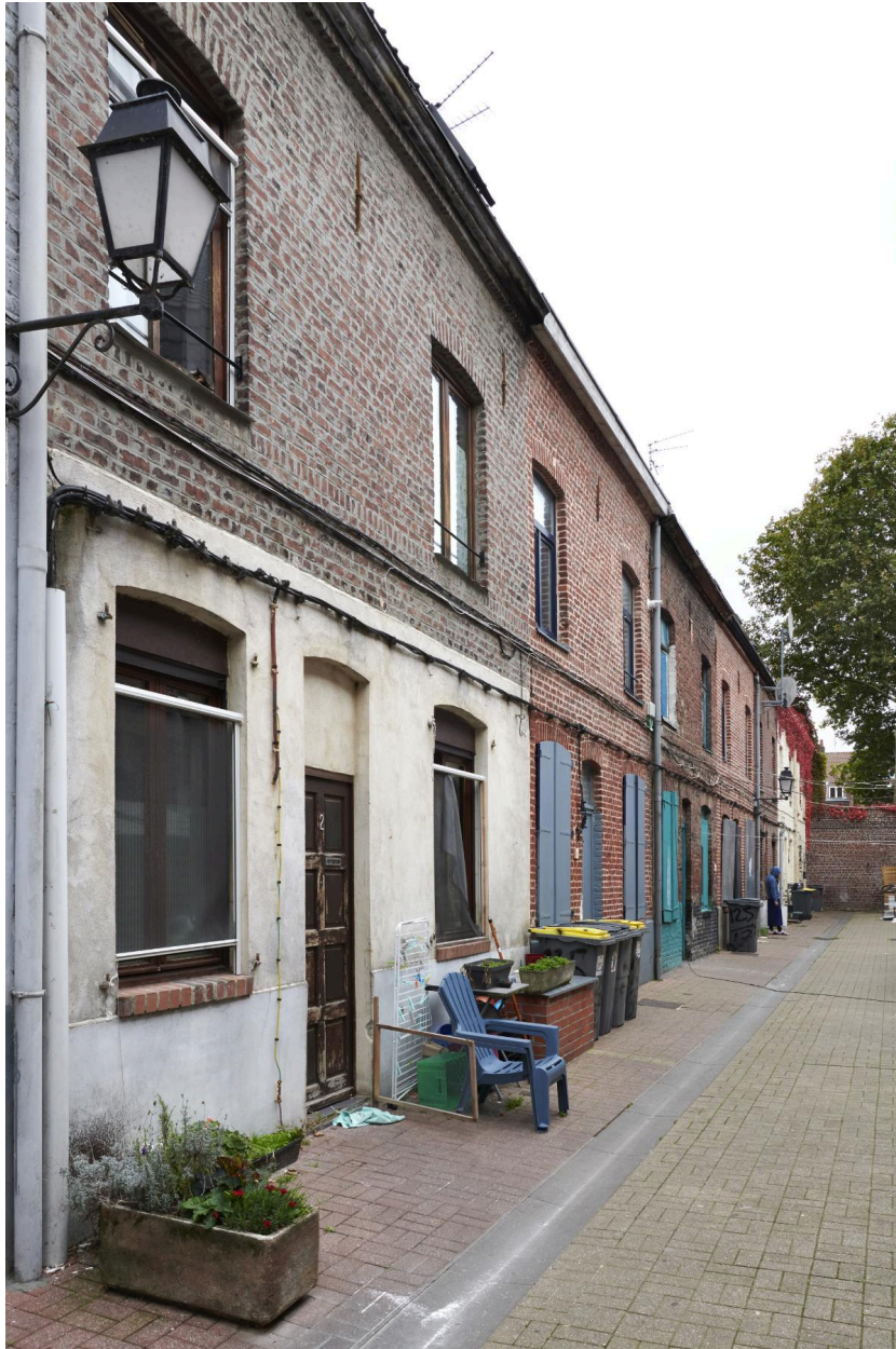
Rang de maisons côté sud, vue de côté.