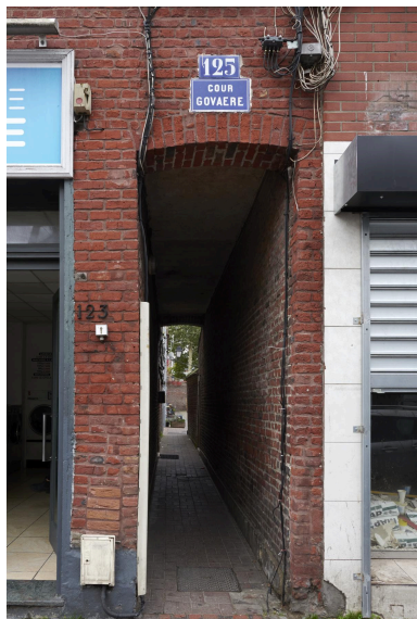
Cour Govaere, entrée.