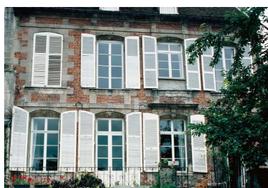
Elévation postérieure, vue partielle. IVR22_19856001315ZA