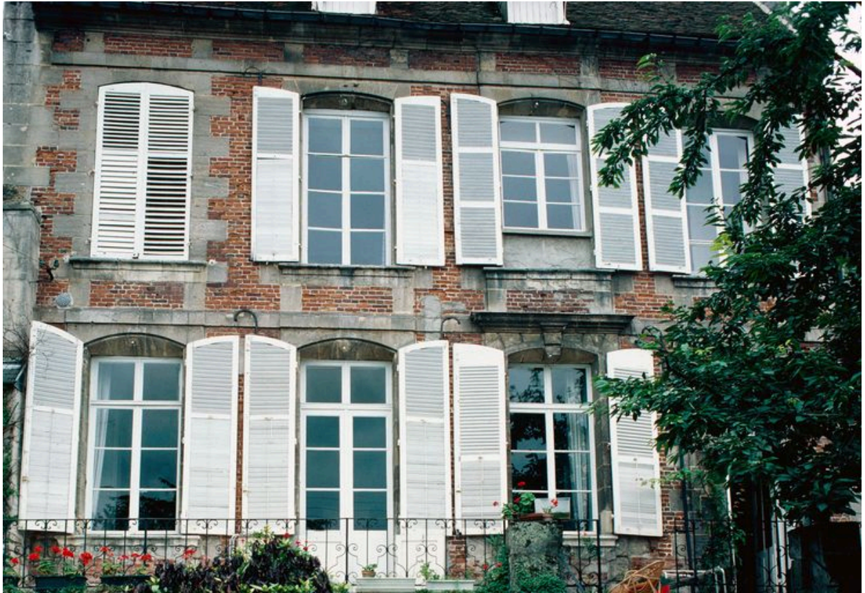
Elévation postérieure, vue partielle.