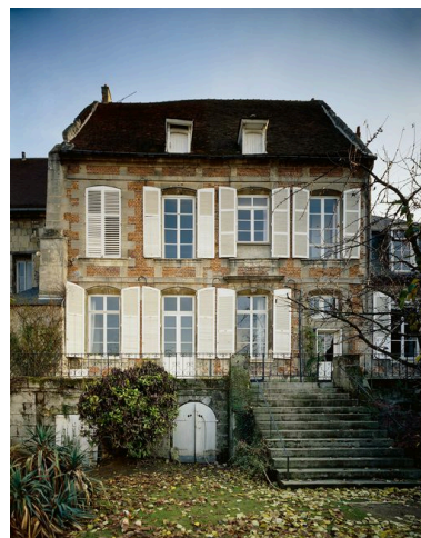
Elévation postérieure. IVR22_19856001568VA