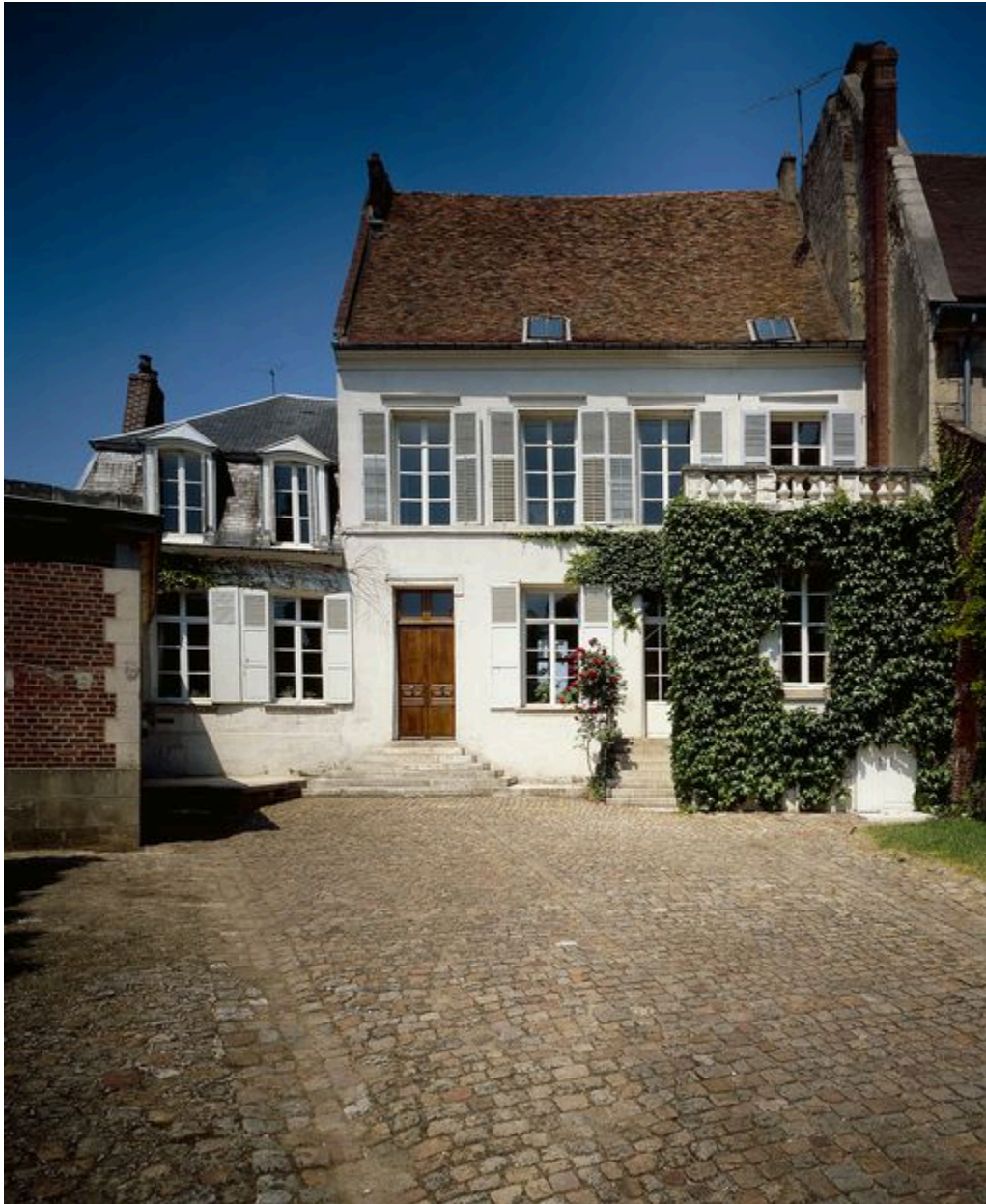
Elévation antérieure sur cour.