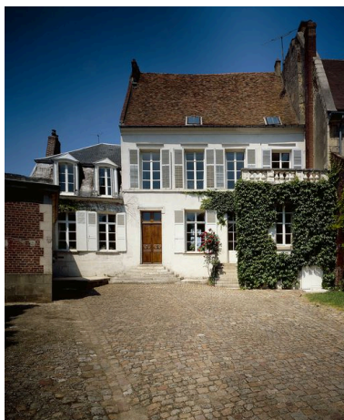
Elévation antérieure sur cour. IVR22_19866000107VA