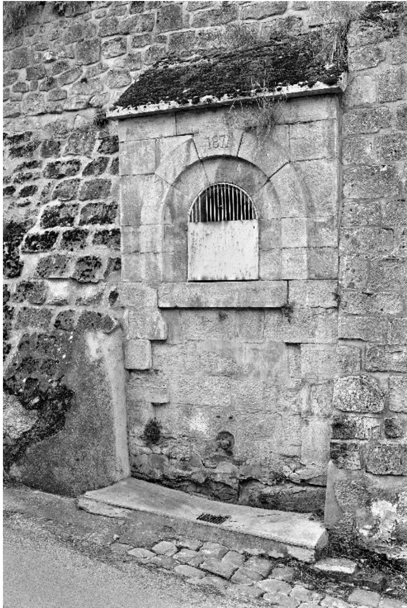
Vue générale du puits.