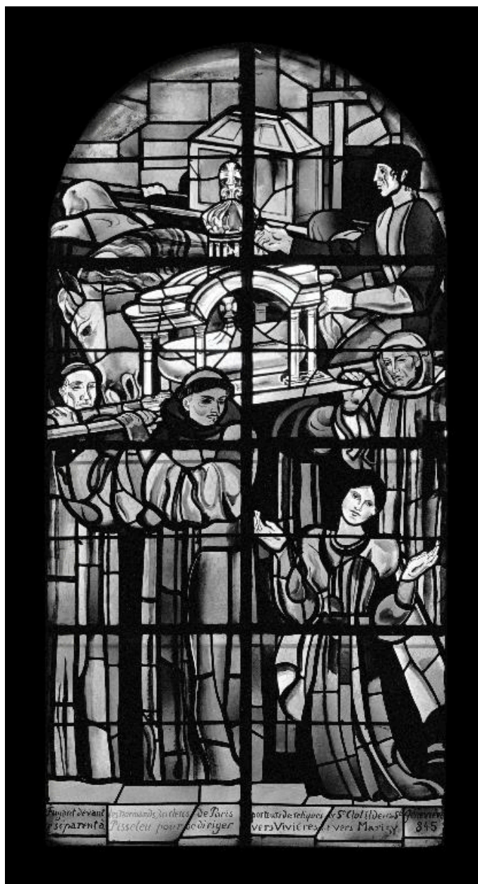
Vue générale de la verrière de la baie 10 : Séparation des reliques de sainte Clotilde et de sainte Geneviève à Pisseleux.