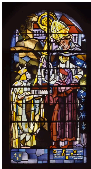
Vue générale de la verrière de la baie 12 : Charles et Philippe VI de Valois consacrent à saint Louis de Toulouse l'église de la chartreuse de Bourfontaine. IVR22_19940200233XA