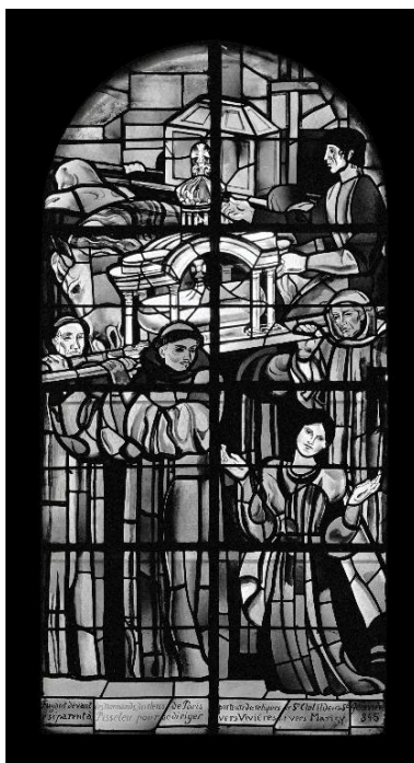
Vue générale de la verrière de la baie 10 : Séparation des reliques de sainte Clotilde et de sainte Geneviève à Pisseleux.