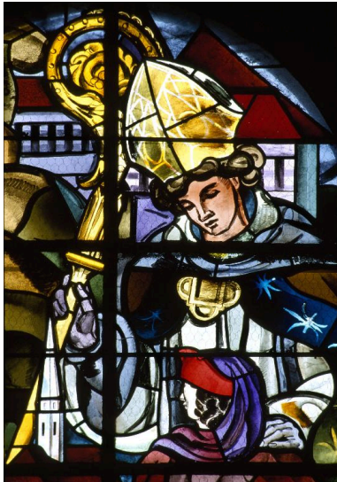
Détail de la verrière de la baie 12 : saint Louis de Toulouse.