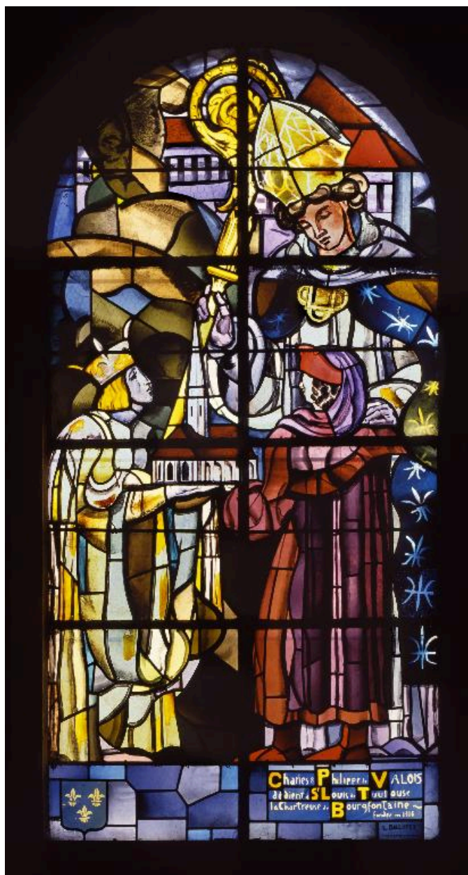
Vue générale de la verrière de la baie 12 : Charles et Philippe VI de Valois consacrent à saint Louis de Toulouse l'église de la chartreuse de Bourgfontaine.