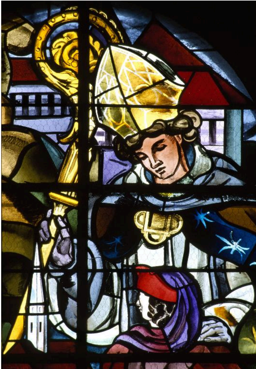
Détail de la verrière de la baie 12 : saint Louis de Toulouse.