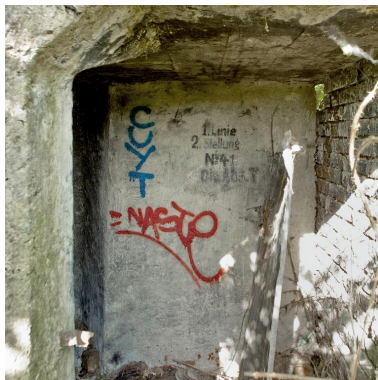
Entrée