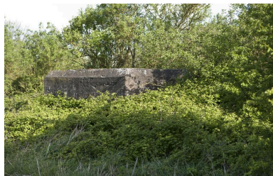
Vue de trois quarts vers le sud-ouest IVR31_20145905606NUCA