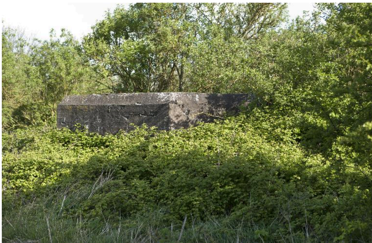
Vue de trois quarts vers le sud-ouest