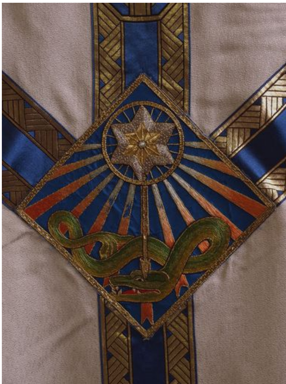
Détail de la chasuble blanche