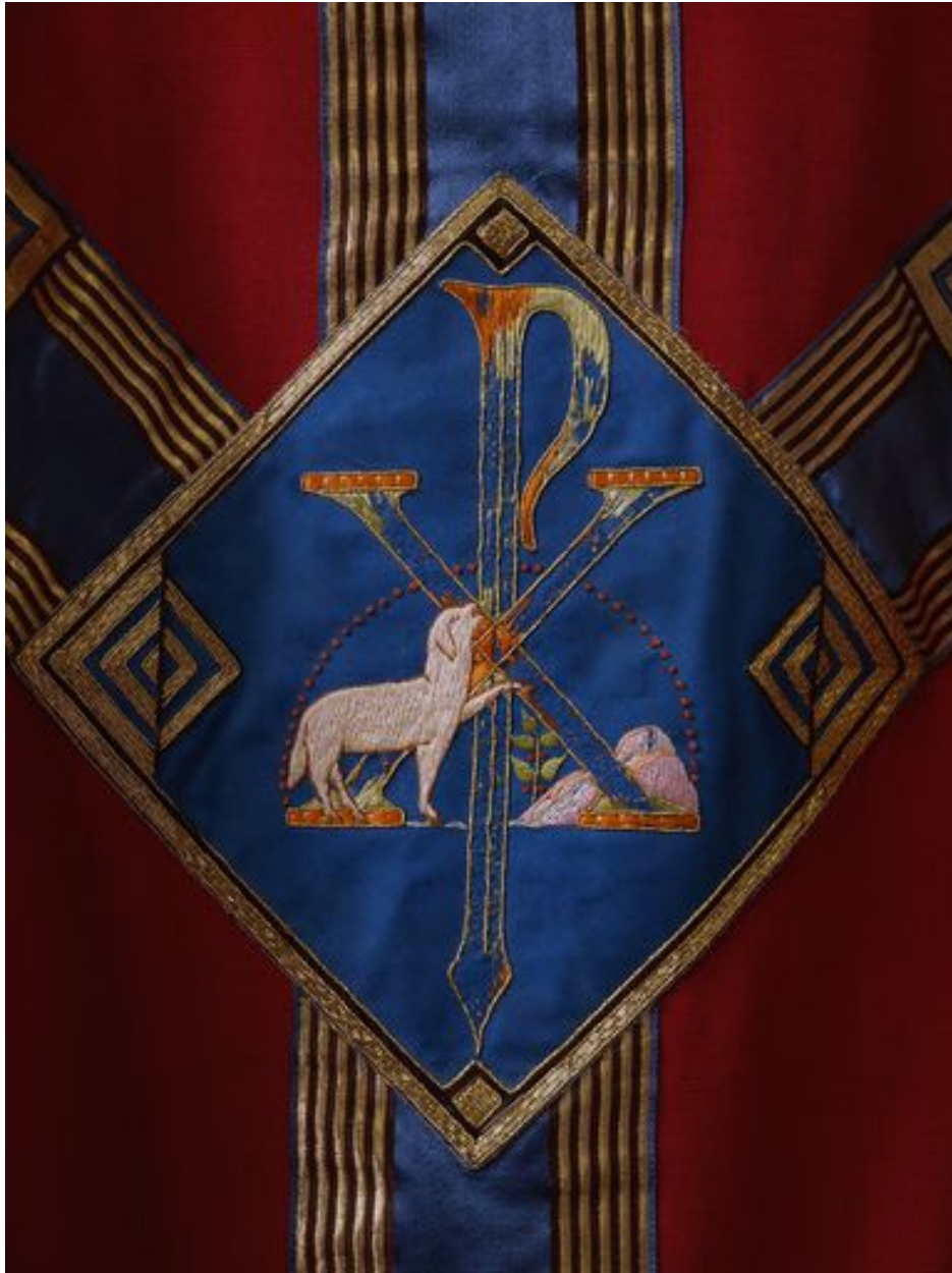
Détail de la chasuble rouge 1