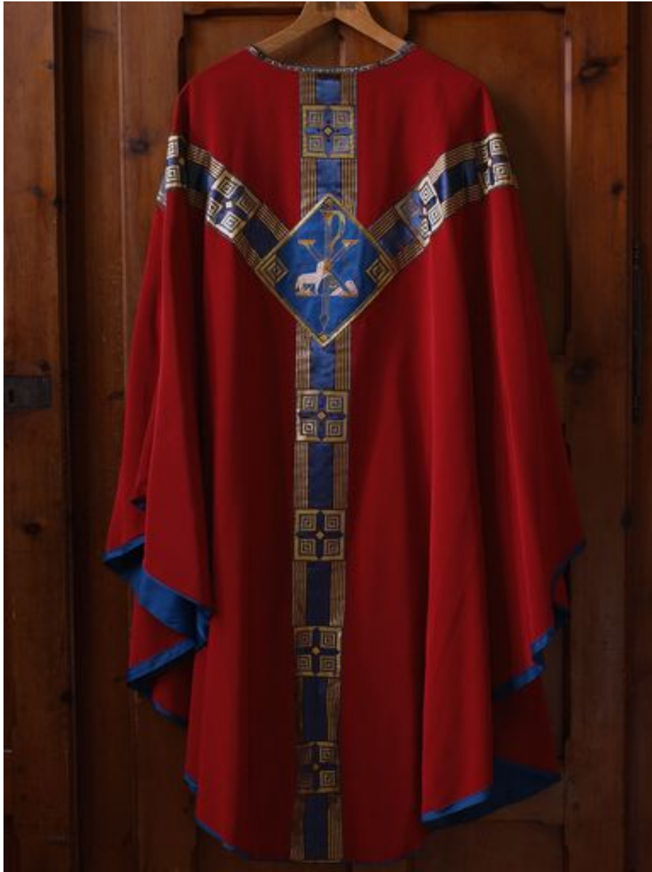
Vue générale de la chasuble rouge 1