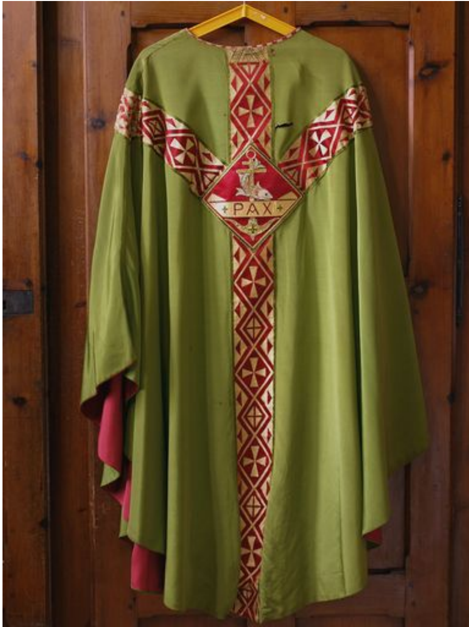
Vue générale de la chasuble verte