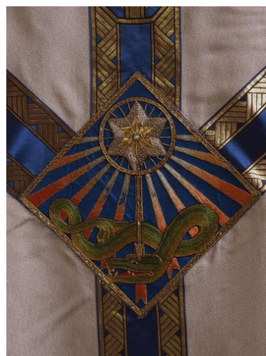
Détail de la chasuble blanche IVR31_20106202843NUCA