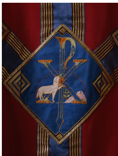
Détail de la chasuble rouge 1