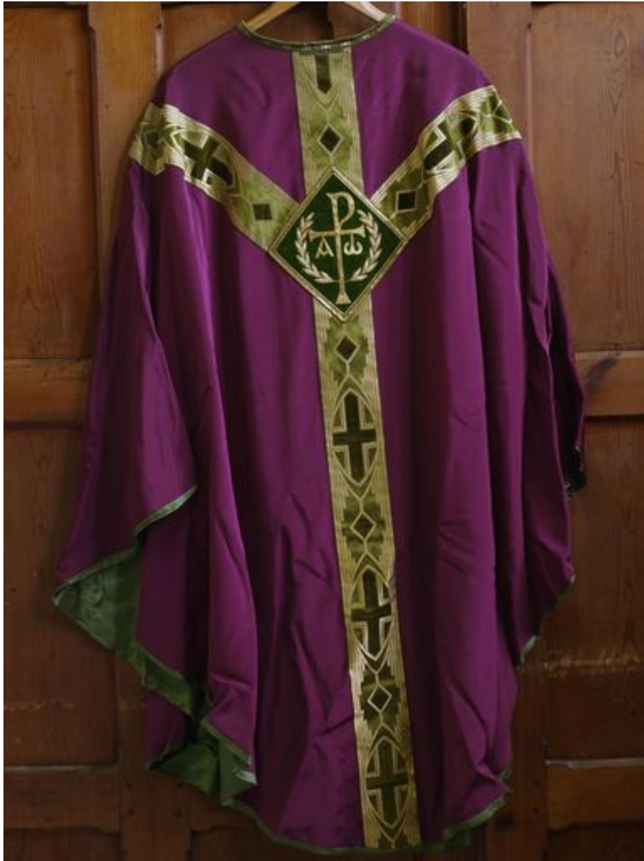
Vue générale de la chasuble rouge 2