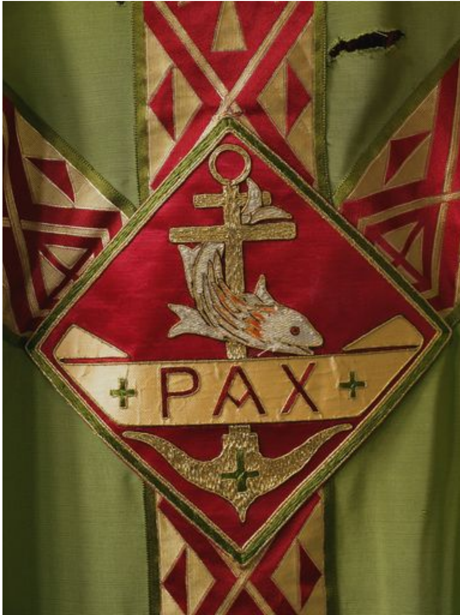
Détail de la chasuble verte