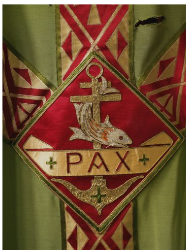
Détail de la chasuble verte IVR31_20106202839NUCA