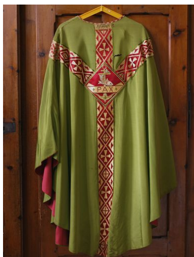
Vue générale de la chasuble verte