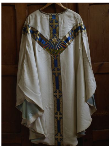
Vue générale de la chasuble blanche IVR31_20106202842NUCA