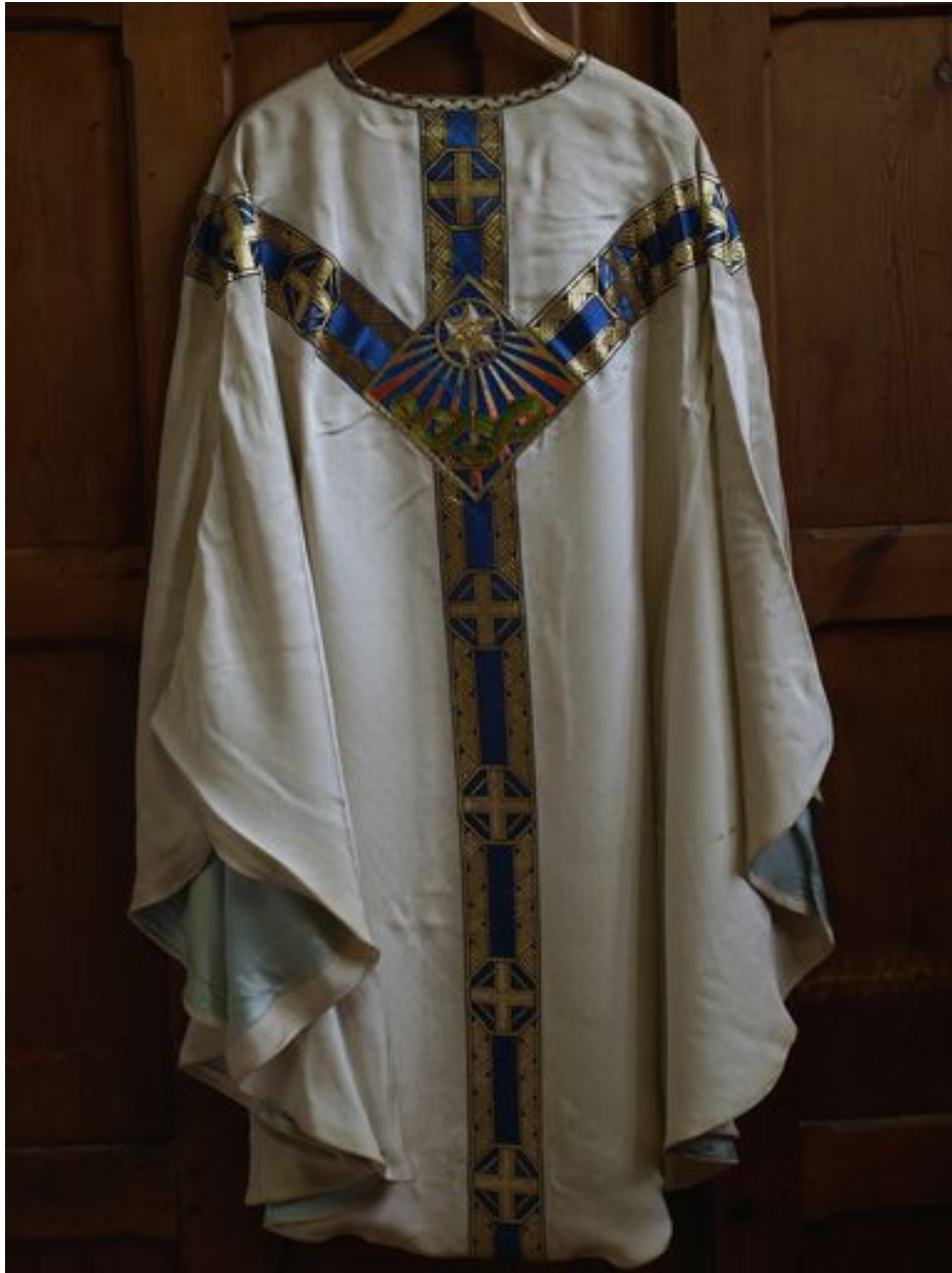
Vue générale de la chasuble blanche