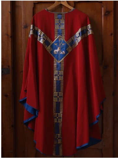
Vue générale de la chasuble rouge 1 IVR31_20106202840NUCA