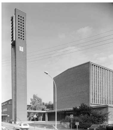
Vue générale. IVR22_19968000294V