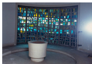
Chapelle des Fonts.