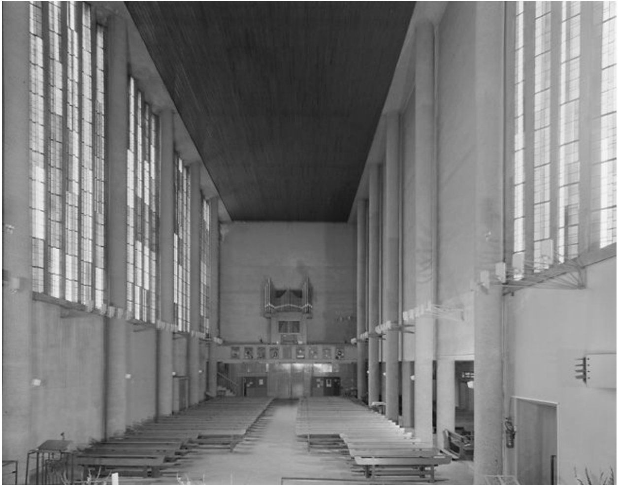
Vue intérieure vers l'entrée.