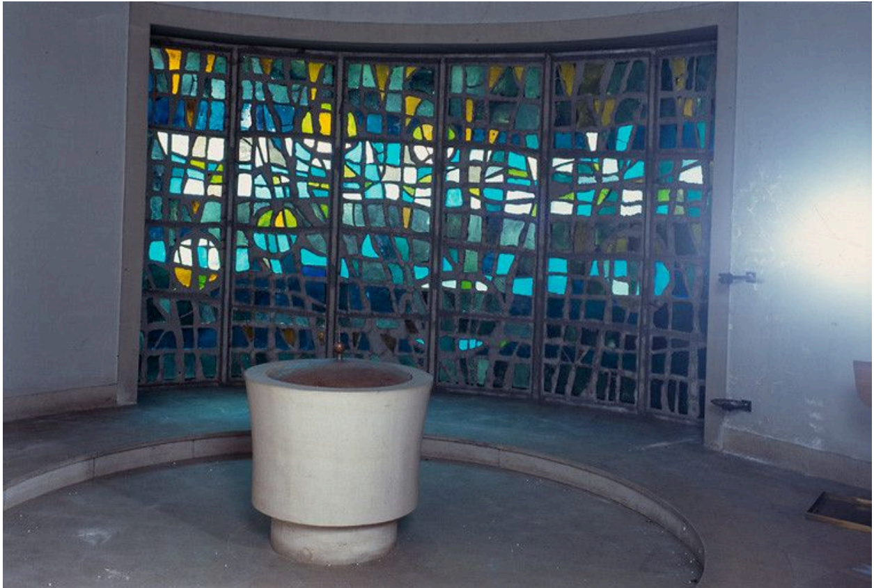
Chapelle des Fonts.