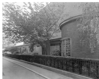
Façade nord. IVR22_19968000295V