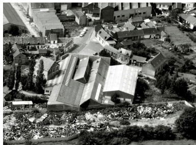
Vue aérienne de la fonderie Couillet-Legay en 1988.