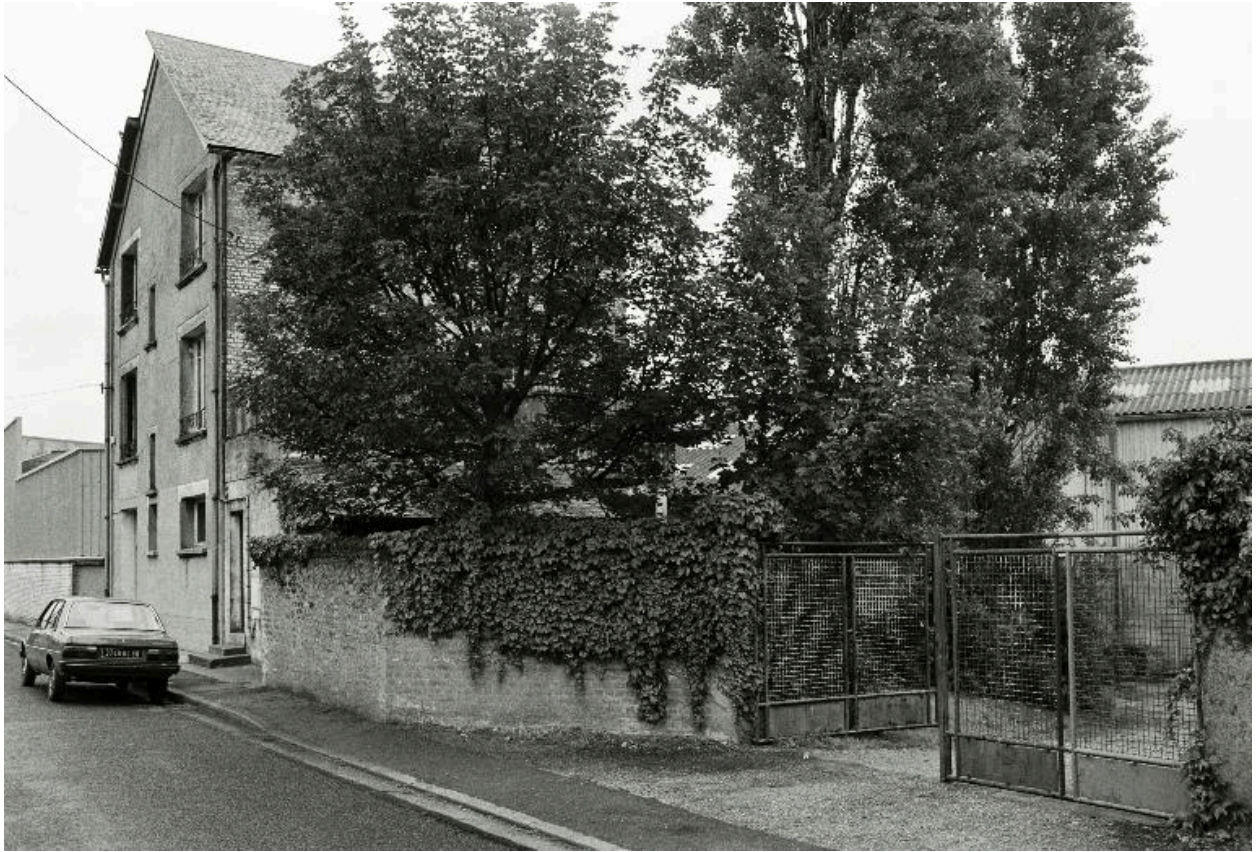
Vue depuis la rue Jean-Baptiste-Clément, en 1990.