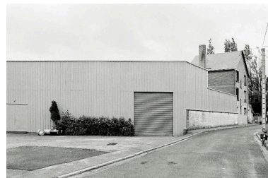
Vue depuis la rue Jean- Baptiste-Clément, en 1990. IVR22_19908000051Z