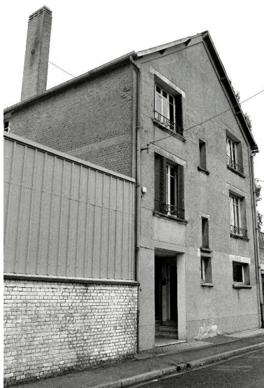
Vue du logement et des bureaux de la fonderie, en 1990. IVR22_19908000050Z