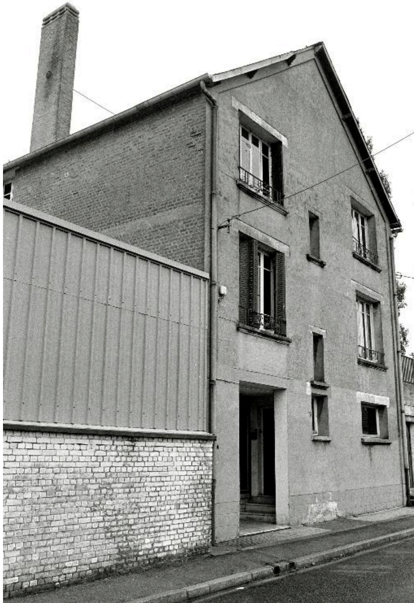
Vue du logement et des bureaux de la fonderie, en 1990.