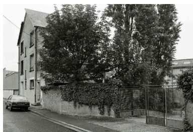
Vue depuis la rue Jean- Baptiste-Clément, en 1990.