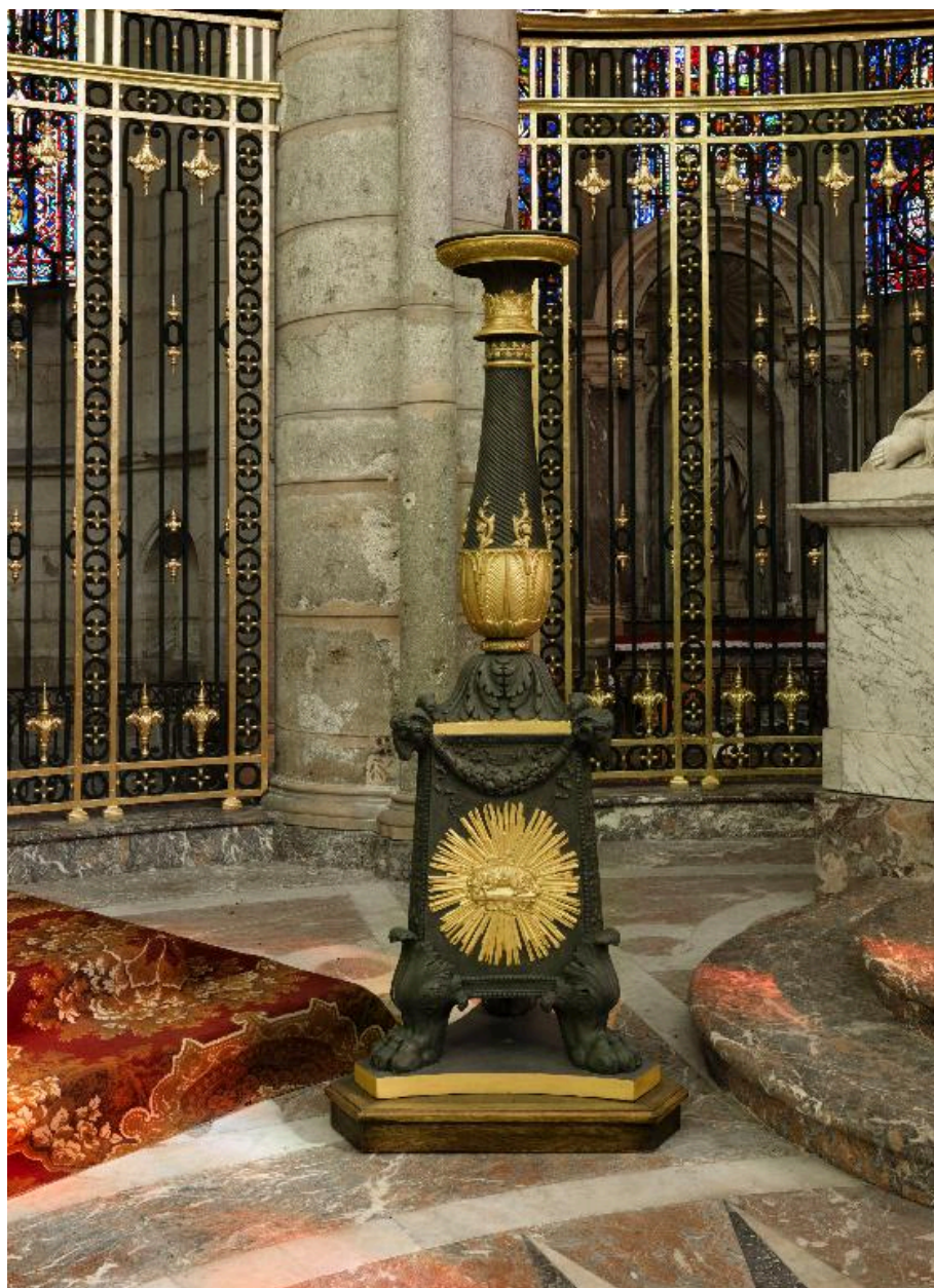
Vue générale actuelle.