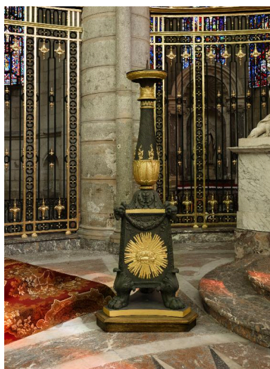
Vue générale actuelle. IVR22_20130200037NUC2A