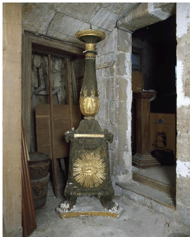
Vue du chandelier (avant restauration). IVR22_20020200549XA