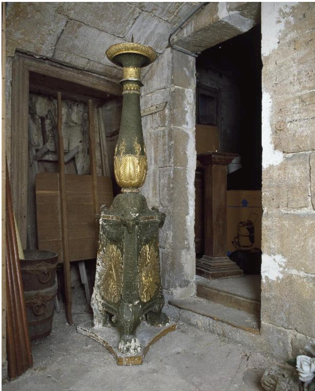
Vue du chandelier (avant restauration).