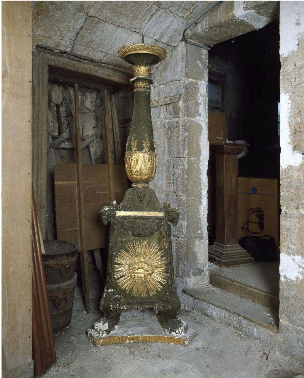
Vue du chandelier (avant restauration).