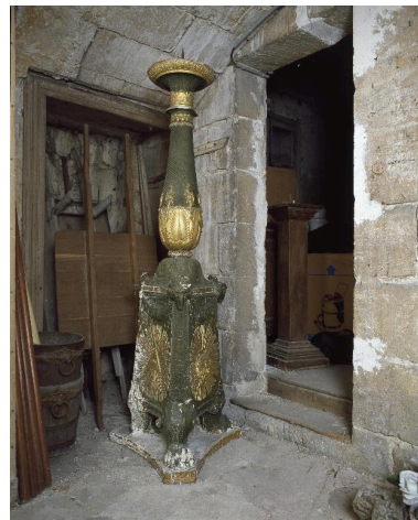
Vue du chandelier (avant restauration).