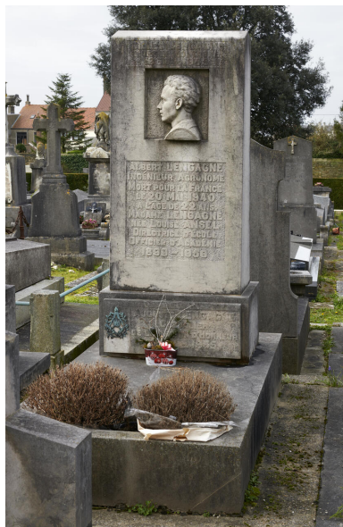
Vue générale. IVR32_20246200057NUCA