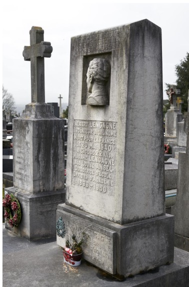
Vue de trois quarts de la stèle. IVR32_20246200058NUCA