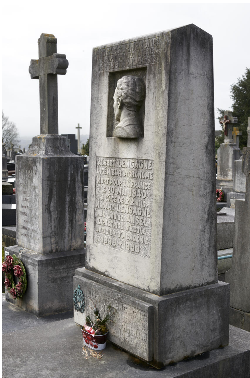
Vue de trois quarts de la stèle.