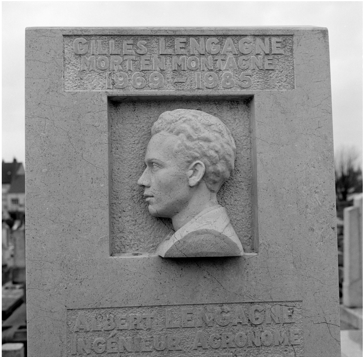
Vue de détail du bas-relief d'Albert Lengagne.