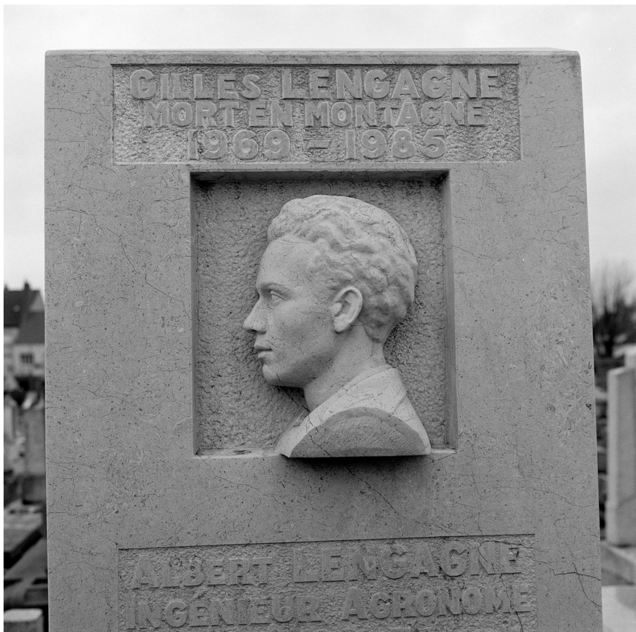
Vue de détail du bas-relief d'Albert Lengagne.